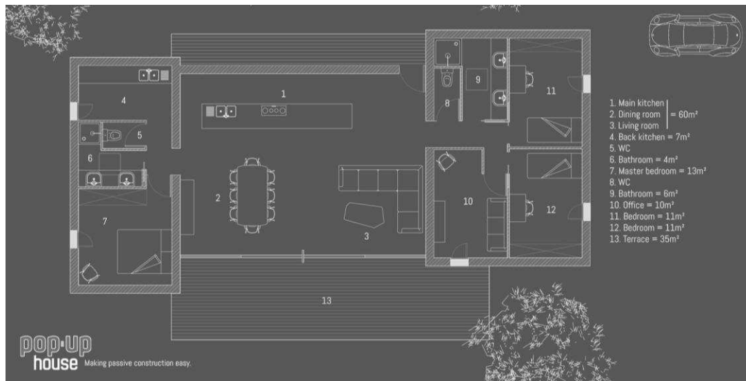
Plan intérieur en coupe verticale de la Pop-up House.

L'interpénétration de l'extérieur et de l'intérieur traduit grâce aux matériaux cette volonté de symbiose avec l'environnement et une grande sensation de liberté de mouvement. La végétation paraît arriver jusque dans votre salon tandis que le vent agitant la cime des arbres est arrêté par une barrière de verre protectrice. On pourrait y projeter mille histoires de vies. Beauté et le confort sont réunis dans un espace splendide et où l'intimité est garantie par les parois intérieures modulables ainsi que par la rangée d'arbres entourant la construction. Très lumineuses, disposant de grands espaces intérieurs, les photographies des projets de maisons alternatives telles qu'elles sont présentées dans des articles tels que celui de Guizmo.com , Journal du Design , Blog Esprit Design , ou Soon Soon Soon , nous présentent de véritables équilibres entre œuvres d'art et structures d'habitation, qui appellent le spectateur à la contemplation.