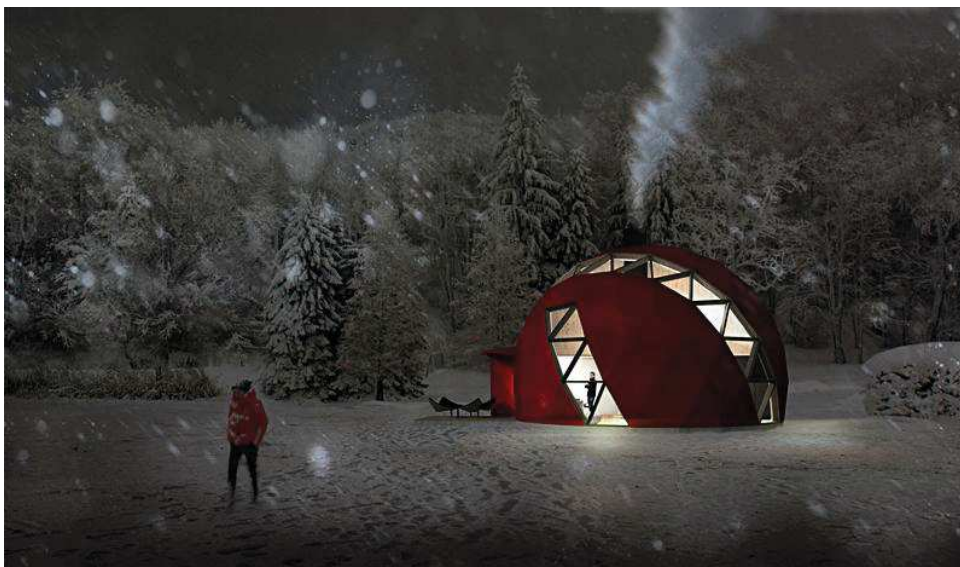
Modélisation 3D disponible sur le site internet de DOM(E)

L'interpénétration de l'extérieur et de l'intérieur traduit grâce aux matériaux cette volonté de symbiose avec l'environnement et une grande sensation de liberté de mouvement. La végétation paraît arriver jusque dans votre salon tandis que le vent agitant la cime des arbres est arrêté par une barrière de verre protectrice. On pourrait y projeter mille histoires de vies. Beauté et le confort sont réunis dans un espace splendide et où l'intimité est garantie par les parois intérieures modulables ainsi que par la rangée d'arbres entourant la construction. Très lumineuses, disposant de grands espaces intérieurs, les photographies des projets de maisons alternatives telles qu'elles sont présentées dans des articles tels que celui de Guizmo.com , Journal du Design , Blog Esprit Design , ou Soon Soon Soon , nous présentent de véritables équilibres entre œuvres d'art et structures d'habitation, qui appellent le spectateur à la contemplation.