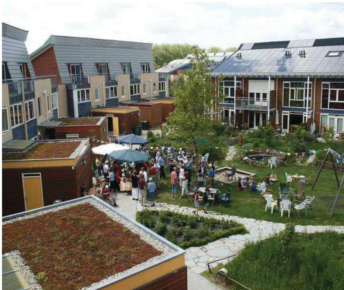
Quartier Eva Lanxmeer , image disponible à l'adresse suivante : http://www.saintjeandebraye.fr/Vie-Citoyenne/Projet-d-habitat-participatif-Mon-toit-c-est-nous/Habitat-participatif-pourquoi-pas-vous

d'urbanisme. Surtout grâce à son site internet, nous avons accès à de nombreuses publications mais aussi à une grande revue de presse et de documents relatifs aux débats le concernant, ou que le quartier a hébergé.