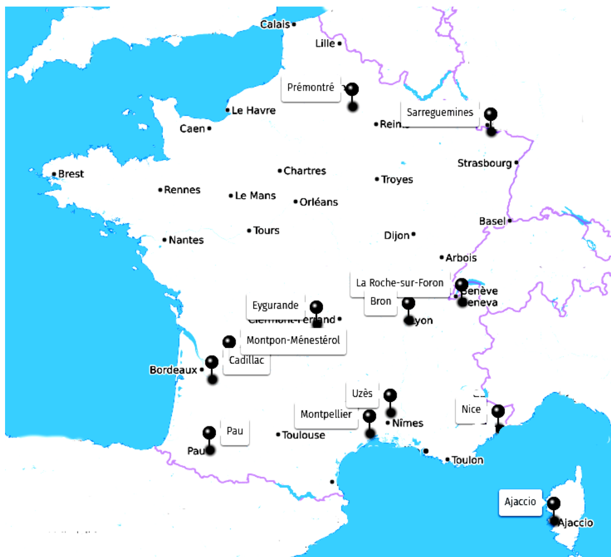
Carte 1 : Répartition géographique des USIP sur le territoire

On retrouve par ailleurs une large bande du territoire situé entre Paris et Clermont-Ferrand, où ce type de structure se montre absent.