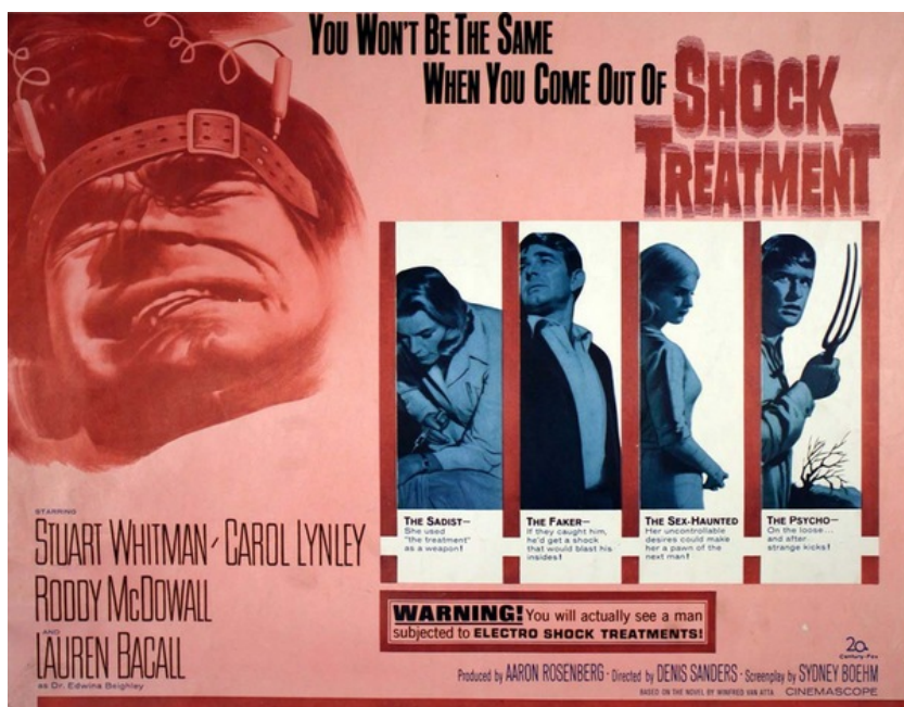
Visage grimaçant sur l'affiche de Shock Treatment, 1964

D'autres films peuvent montrer un traitement lors duquel les patients gardent les yeux ouverts, ce qui est impossible au cours d'une telle stimulation. Les visages grimaçants, par ailleurs, que l'on retrouve dans les représentations et argumentations contre un traitement jugé douloureux et brutal, sont métaphoriques de la torture subie consciemment. Aucune explication n'est faite de la contraction musculaire faciale consécutive de la stimulation musculaire directe après la décharge, qui est alors interprétée comme une grimace douloureuse.