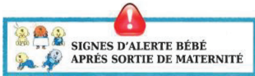
Figure 1 : Fiche rédigée par le réseau régional de périnatalité

Votre enfant sort du service Maternité. Durant son séjour, il a bénéficié d'une surveillance médicale réalisée par les pédiatres, puéricultrices et sages-femmes de la maternité.