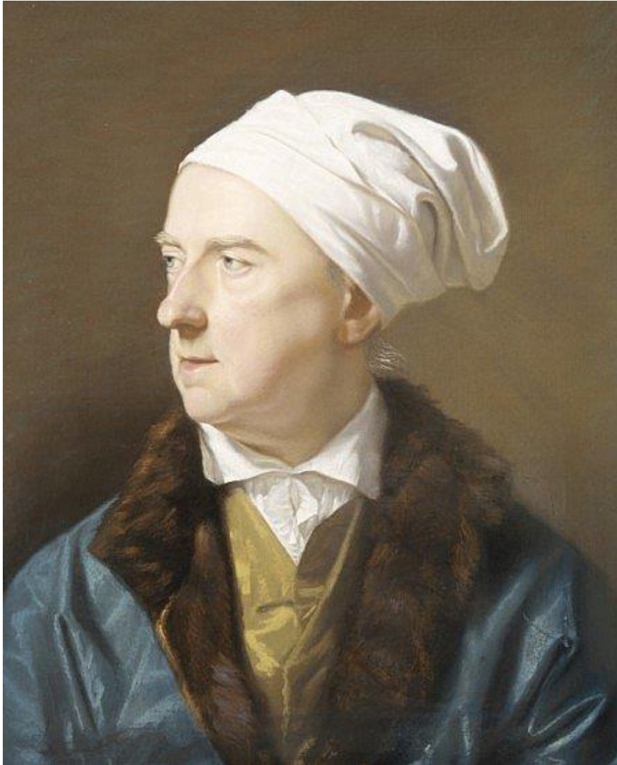
Figure 5 : Archibald Skirving. Gavin Hamilton, Rome, vers 1788, Scottish National Portrait Gallery.