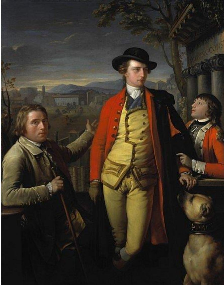
Figure 2 : Gavin Hamilton. Douglas Hamilton, 8th Duke of Hamilton, accompagné de John Moore et son fils lors de son Grand Tour, Rome, 1775-1777, Scottish National Portrait Gallery.