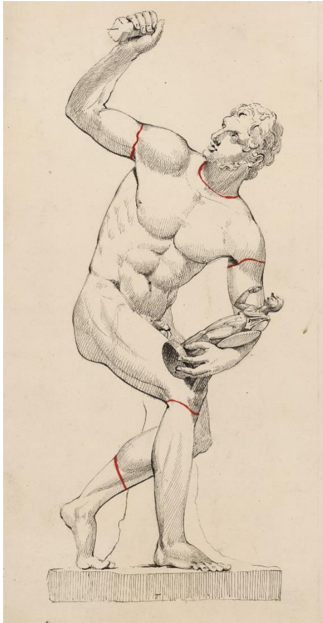
Figure 4 : Dessinateur inconnu. Discobole Lansdowne restauré par Gavin Hamilton en Diomèdes, entre 1772 et 1805, British Museum.

(Les restaurations sont délimitées en rouge, le torse est antique).