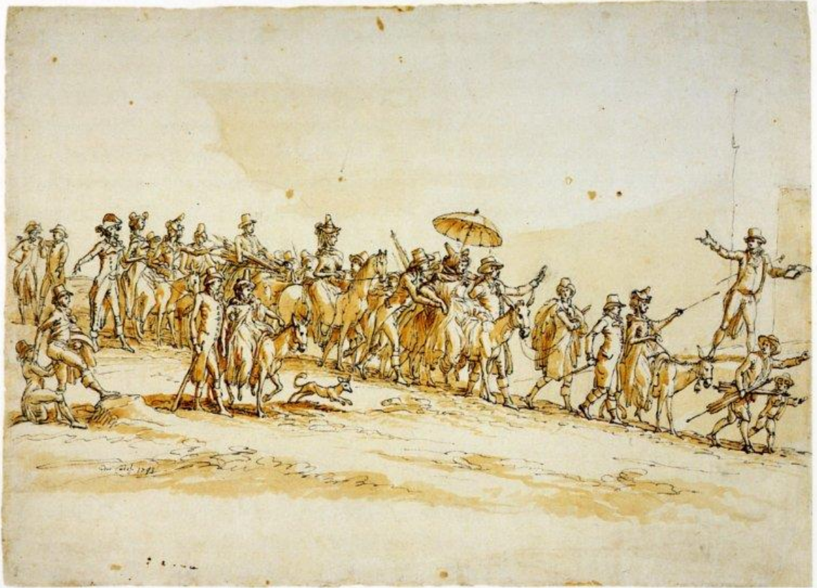
Figure 3 : Giuseppe Cades. Gavin Hamilton conduisant un groupe de grands touristes sur le site de Gabies, 1793, Scottish National Gallery.