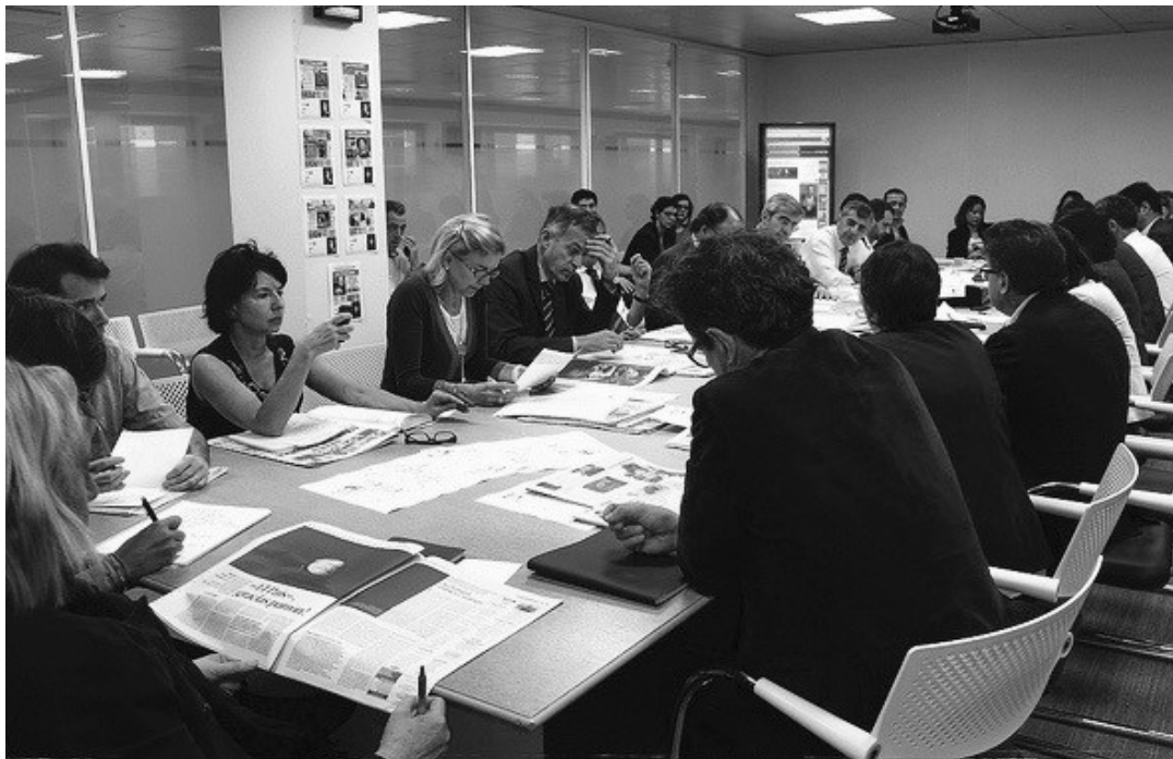
Les coulisses d'une conférence de rédaction