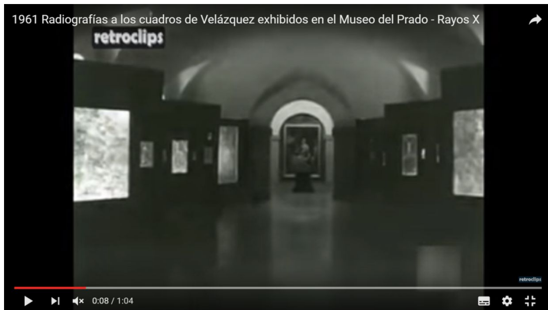
Capture d'écran à la 8 e seconde, reportage sur l'exposition Radiografías des tableaux de Velázquez au musée du Prado, 1962 81 .

Elles soutiennent les radiographies et les tableaux tels qu'ils sont en 1962 afin de pouvoir faire une comparaison entre l'œuvre achevée et ce qui se cache derrière la dernière couche de peinture. Un ingénieux système éclaire parfaitement les radiographies ce qui permet au visiteur de les observer facilement.