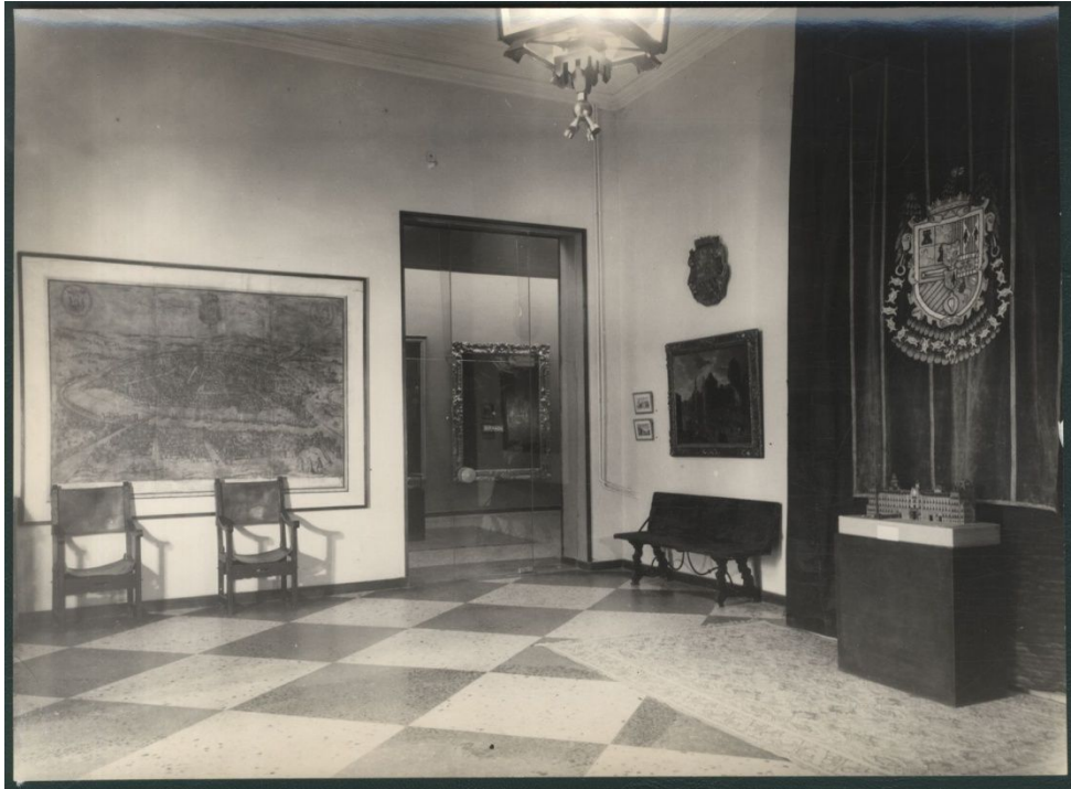
Salle de l'exposition Velázquez y lo velazqueño , 1960 77 .

Il est aussi présent sous la forme d'une suspension classique que l'on trouve dans toutes les habitations (photographie 6) et enfin l'éclairage zénithal qui a pour inconvénient de ne pas être constant. Comme cet éclairage est assez froid et que les œuvres picturales qui sont la principale attraction de cette exposition sont fixées au mur, cela donne une ambiance froide, cela ne permet d'apprécier l'œuvre à sa juste valeur. Il apparaît çà et là des meubles parfois organisés sous la forme de period room pour tenter de casser ce manque de dynamisme et de fermeture de l'espace. La photographie 5 rend compte de cette tentative de rendre l'espace plus vivant avec l'installation d'une table en bois agrémentée d'un porte-plume et ses deux plumes, d'un document posé sur la table, d'un pupitre à pied orné d'un ouvrage ouvert et d'un objet volumineux de forme arrondie, en fer, percé de petits trous réguliers qui est posé au pied du pupitre. Cela laisse à penser que l'on souhaite recréer l'ambiance de travail de Velázquez ou du moins un intérieur typique du XVII e siècle. On dispose dans les différentes salles d'exposition des objets, des meubles, des statuts pour donner du dynamisme et de la vie à cette exposition.