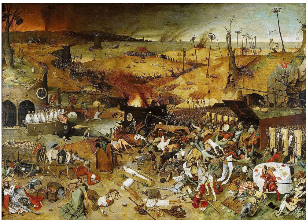
Pieter Bruegel, Triomphe de la Mort , 1562, musée du Prado.