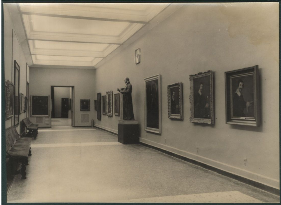
Salle de l'exposition Velázquez y lo velazqueño , 1960 74

d'or peinte sur la voûte de l'édifice. Ce n'est pas un espace malléable, on doit composer avec les contraintes du lieu.