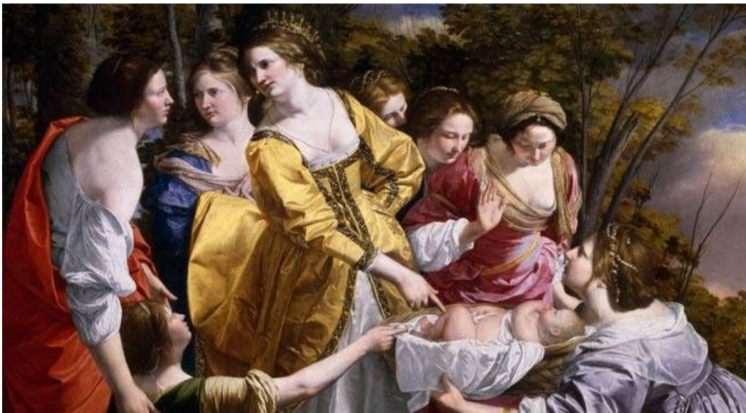
Orazio Gentileschi, Moïse sauvé des eaux du Nil , musée du Prado.

Le musée du Prado réussit à éveiller l'intérêt, ce long papier démontre que le pari est gagné. Les Espagnols sont sensibles à leur trésor national, que cela touche à la peinture espagnole ou étrangère. Le journaliste fait tout un développement sur le contexte politique, économique et culturel dans lequel la peinture italienne implose au XVII e siècle et en quoi elle change totalement la vision et la technique picturale. Elle révolutionne l'art pictural. C'est cette révolution que le musée du Prado conserve depuis tant d'années sans que personne ne le sache.