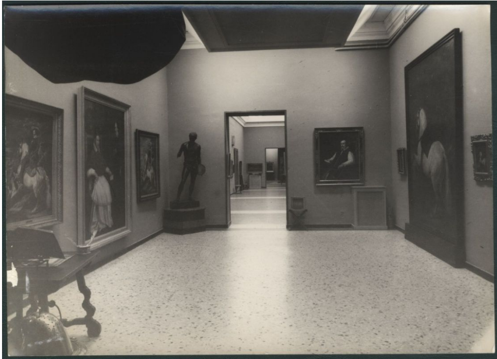
Salle de l'exposition Velázquez y lo velazqueño , 1960 76 .

Autre point important dans une exposition : l'éclairage. Il est un facteur d'ergonomie, il permet de rendre visible les objets. C'est aussi un moyen d'expression, de mise en espace et il crée des effets d'ambiance. Il ne faut pas oublier qu'un mauvais éclairage peut détériorer une œuvre. Bien que les photographies soient en noir et blanc, on peut en déduire que l'éclairage général est celui qui domine, l'éclairage directionnel n'est que très peu utilisé dans cette exposition. L'éclairage général se trouve sous différentes formes : il est inséré dans un faux plafond avec un éclairage qui semble être blanc (photographie 5).