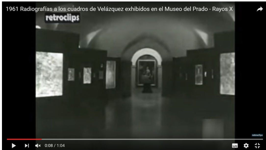
Capture d'écran à la 8 e seconde, reportage sur l'exposition Radiografías des tableaux de Velázquez au musée du Prado, 1962 81 .

Elles soutiennent les radiographies et les tableaux tels qu'ils sont en 1962 afin de pouvoir faire une comparaison entre l'œuvre achevée et ce qui se cache derrière la dernière couche de peinture. Un ingénieux système éclaire parfaitement les radiographies ce qui permet au visiteur de les observer facilement.