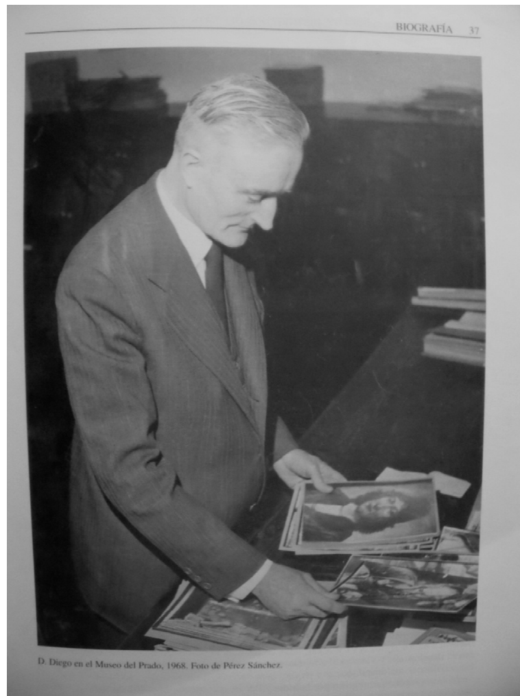
Diego Angulo Íñiguez au musée du Prado, 1968, 199

Il voyage énormément pour ses études, répondant aussi à de multiples invitations que lui adressent de nombreuses institutions dans le monde. Progressivement, Diego Angulo devient un homme lettré prestigieux désiré par toutes les sphères intellectuelles.