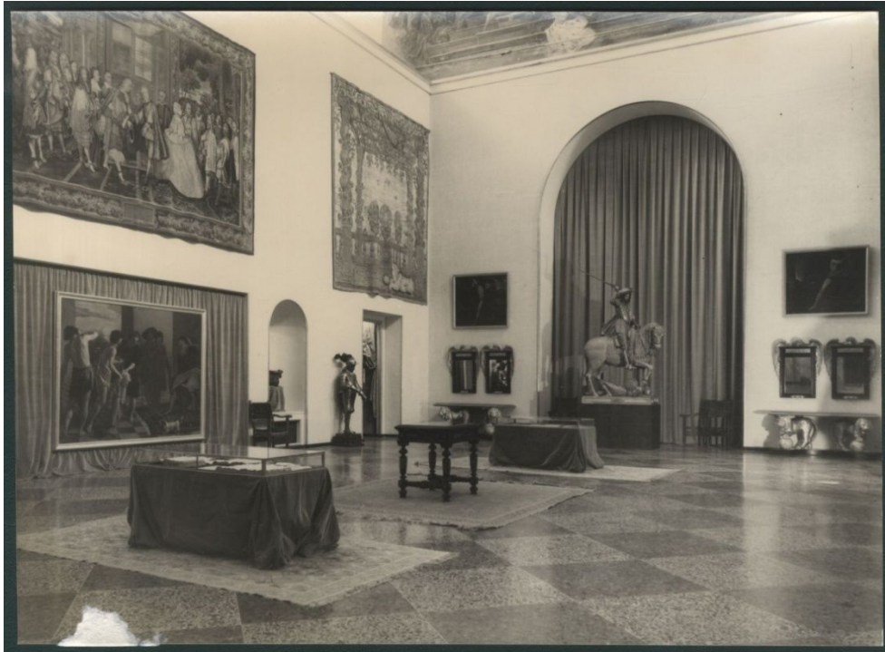
Salle de l'exposition Velázquez y lo velazqueño , 1960 75 .

Les supports des expôts sont avant tout primaires, c'est-à-dire des éléments qui ne bougent pas tels que les murs et les sols. Les tableaux du peintre sont accrochés aux murs. L'exposition est complétée par d'autres expôts du XVII e siècle : des supports secondaires tels que des niches et des vitrines sont utilisées et des supports tertiaires comme les étagères. Il y a une variété assez large des supports qui empêche toute monotonie. Toutefois, l'accrochage au mur reste majoritaire. Le jeu des supports est somme tout classique : les documents écrits ou imprimés sont dans des vitrines tables ce qui permet au visiteur de lire et d'observer à hauteur les expôts. Les statuts et bronzes sont quant à eux sur des socles situés dans les coins des salles ou dans des niches ce qui réduit tout risque de dégradation. Néanmoins, ce type de présentation empêche le visiteur de faire le tour de l'œuvre car aucun miroir ne semble être disposé derrière l'expôt ce qui permettrait de l'observer à 360 degrés.