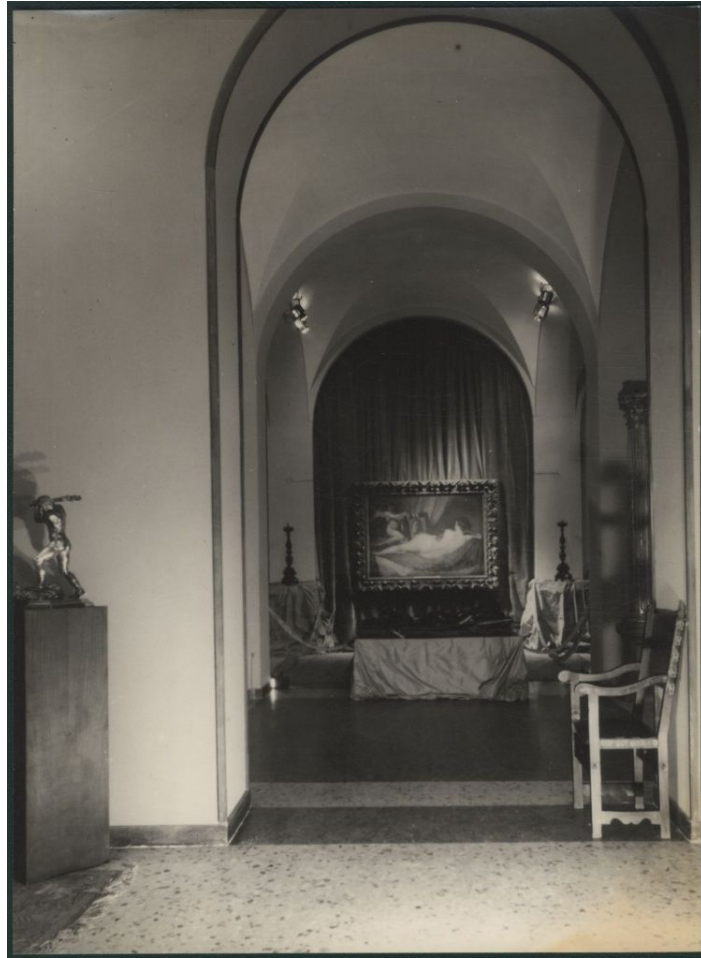
Salle de l'exposition Velázquez y lo velazqueño , 1960 78 .

Un type d'éclairage directionnel a été relevé : il s'agit de La Vénus au miroir (photographie 7) qui bénéficie d'un éclairage dirigé qui met en valeur le tableau et son environnement. Il y a une mise en scène du tableau qui est mis en retrait du reste de l'exposition. On crée une sorte d'autel rectangulaire recouvert d'un drap placé sous le tableau, ceint de deux chandeliers posés sur des socles eux aussi recouverts d'un drap. Le mur qui soutient le tableau est lui recouvert d'un tombé de drap. Cette mise en scène au caractère quasi mystique et l'éclairage dirigé crée une ambiance de recueillement et de contemplation. L'œuvre est seule, dans une alcôve qui est un espace de transition entre deux salles.