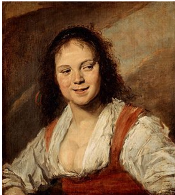
Frans Hals, La Bobémienne , musée du Louvre.

On réitère l'expérience en 1966 où le musée du Prado accueille une œuvre de Frans Hals, La Bobémienne (annexe 7).