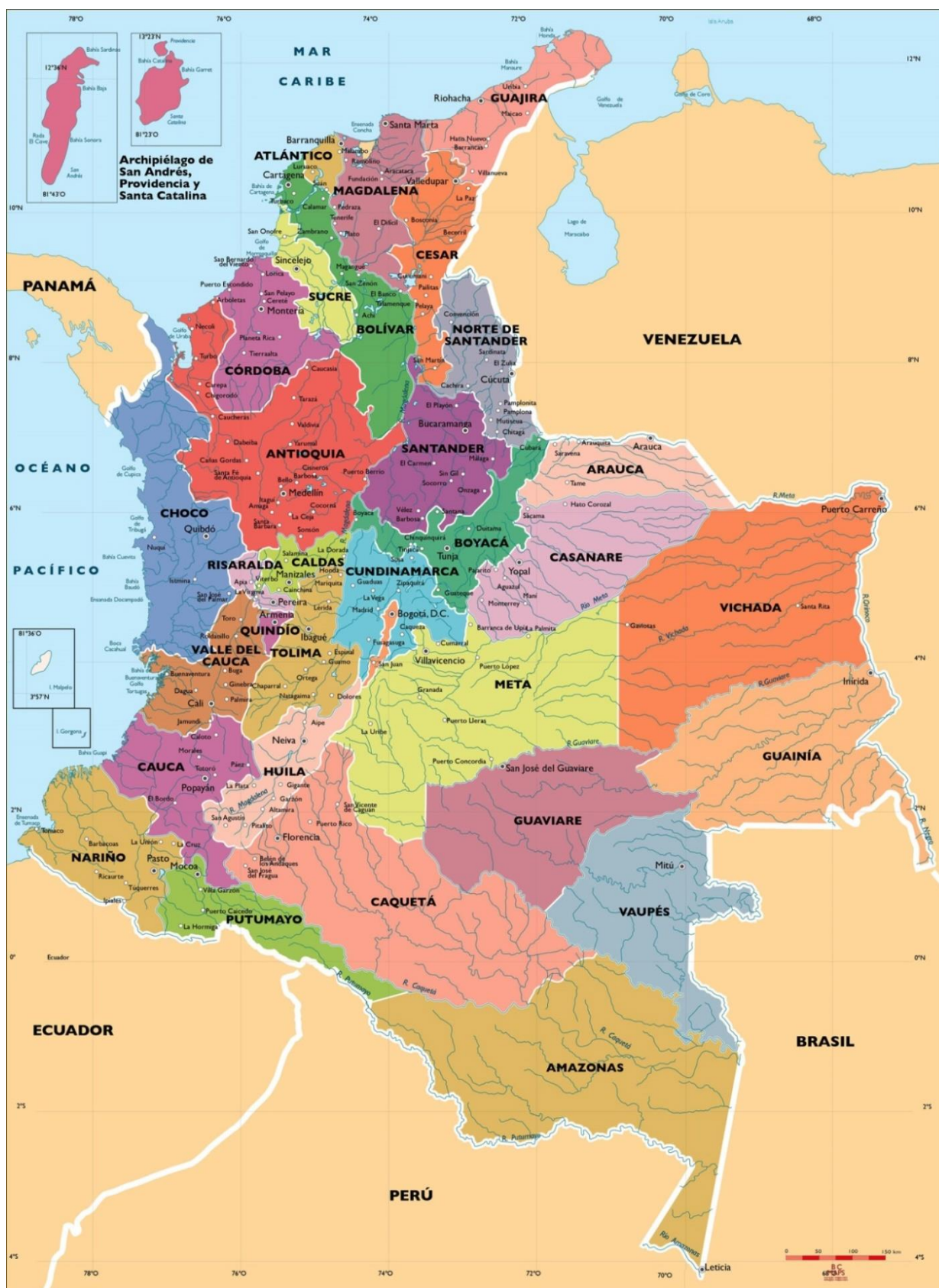
Mapa actual de Colombia