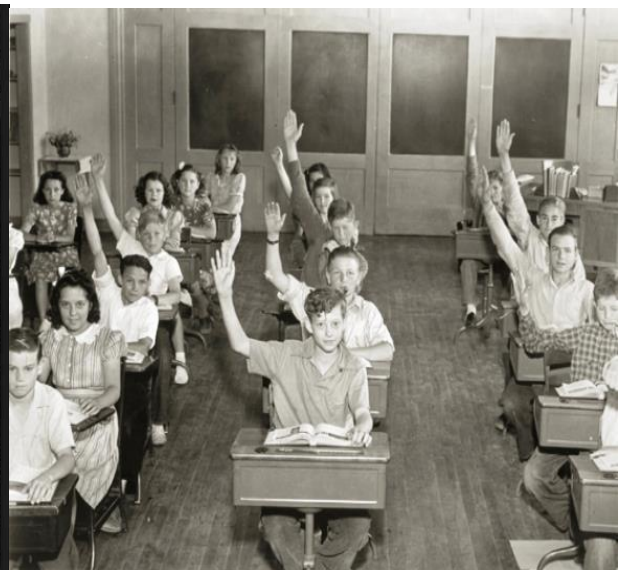
The Education of Black Children in the Jim Crow South abhmuseum.org/2012/.../education-for-blacks-in-the-jim-crow-sou...

Ces quatre documents iconographiques nous servent d'illustrations sur la réalité dramatique à laquelle confrontait la communauté africaine-américaine dans le Sud des Etats-Unis durant la période de Reconstruction et l'ère Jim Crow. Les deux premiers nous démontrent le degré de terreur que connaissait alors cette communauté. Les deux derniers nous laissent entrevoir le niveau d'inégalités qui existait dans les services offerts aux Noirs et aux Blancs dans la société sudiste durant l'ère Jim Crow.