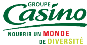
Logotype du Groupe Casino

Toutefois, ce désir explicite de faire de la diversité une richesse, se trouve dans la composition du Guide « Gérer la diversité religieuse en entreprise ». C'est ainsi que le document intègre des fiches de présentation des grandes religions. Mon interprétation est de donner un signe visible de l'accueil des diversités ; et permettre d'évacuer les amalgames afin de donner légitimité aux managers. Non pas qu'ils soient encouragés à entrer dans la subjectivité des cas, mais qu'ils aient ainsi les moyens de ne pas y entrer.