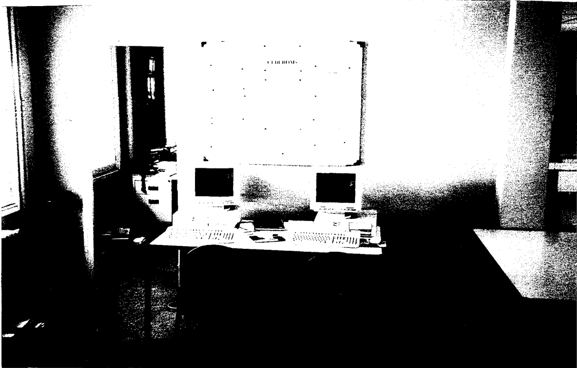
- La salle océane

Deux ordinateurs proposent directement Internet en accès libre.