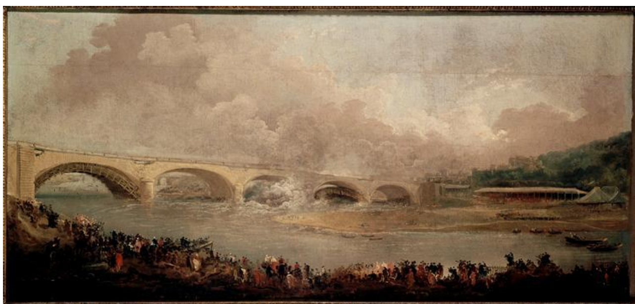
Le décintrement du pont de Neuilly, le 22 septembre 1772