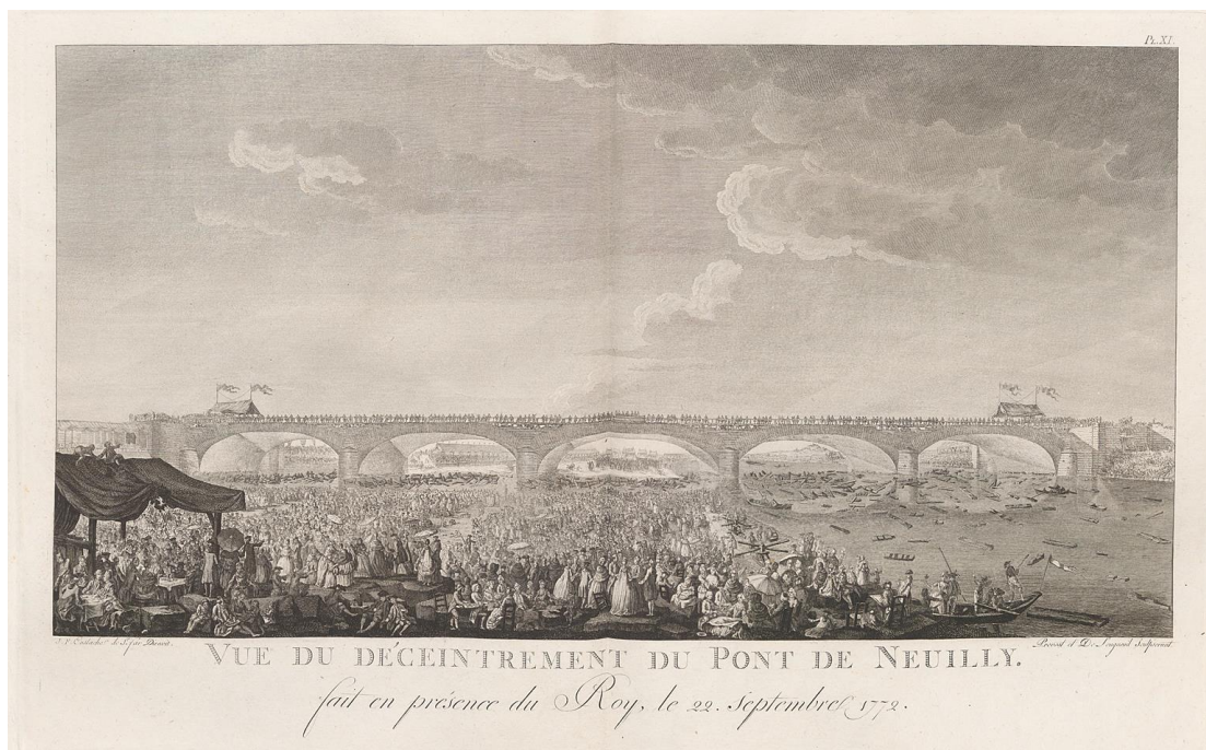
Planche XI, « Vue du décintrement du pont de Neuilly », Ibid.