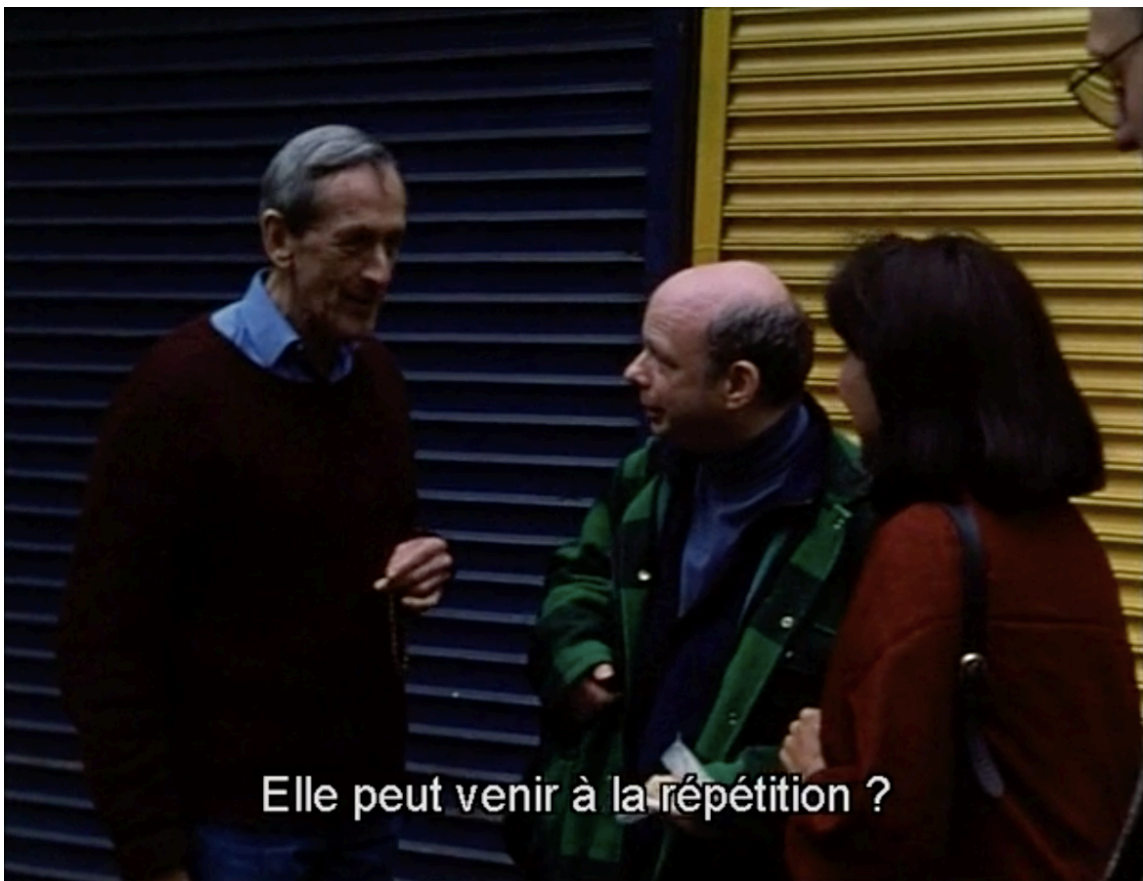
Wallace Shawn (Vanya) dans la rue