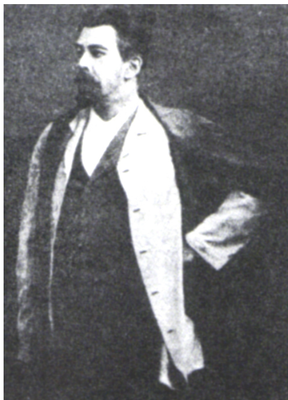
Constantin Stanislavski dans le rôle du Docteur Mikhaïl Astrov