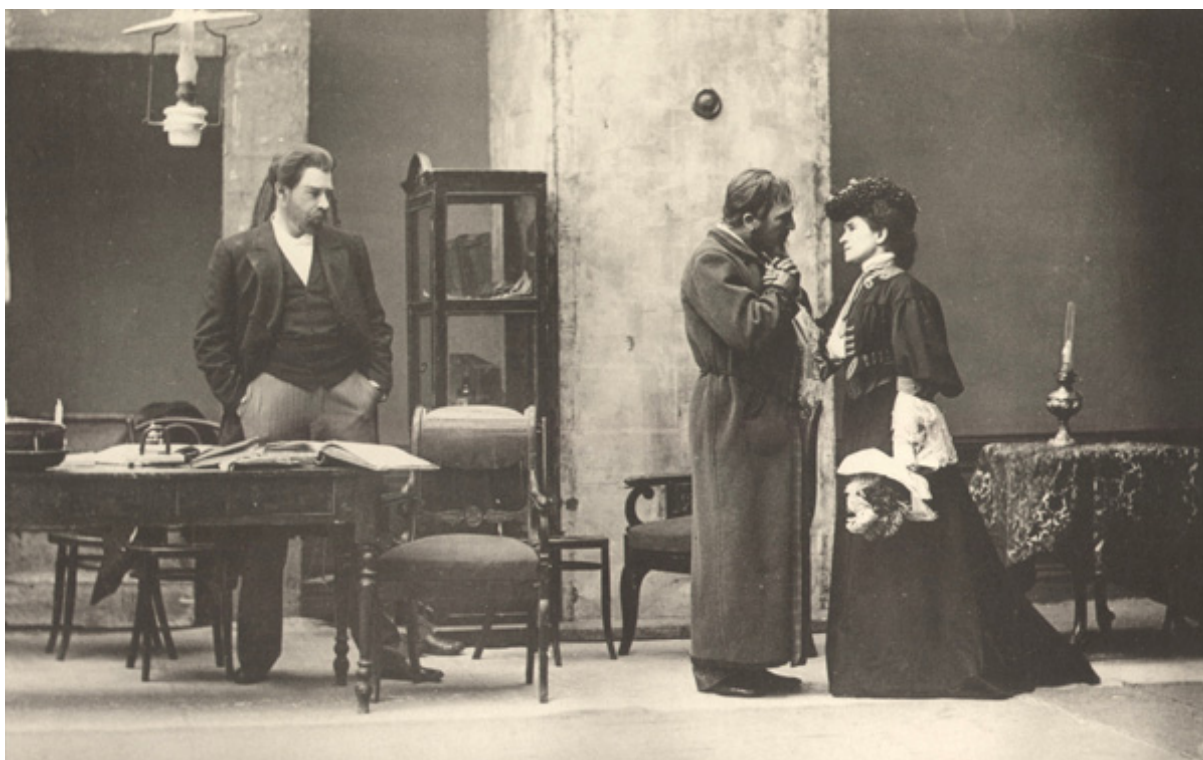
Scénographie de la première mise en scène d' Oncle Vanya . On y retrouve la table ronde de l'Acte II de Vanya on 42nd Street .