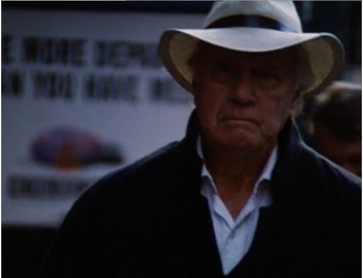
George Gaynes (Pr. Serebryakov) dans la rue