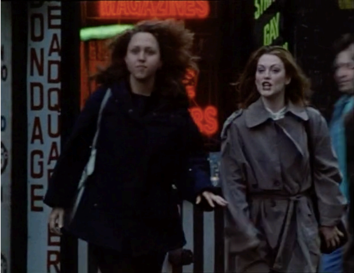
à droite, Julianne Moore (Yelena) dans la rue