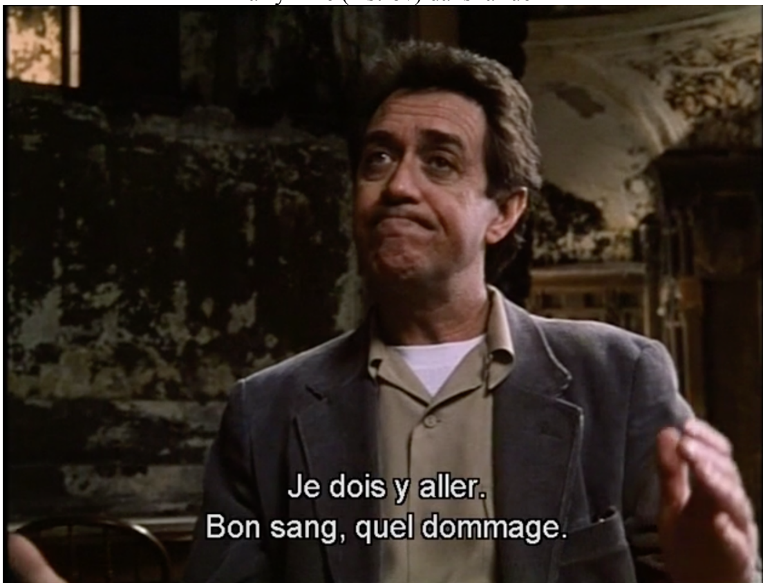
Astrov pendant la pièce