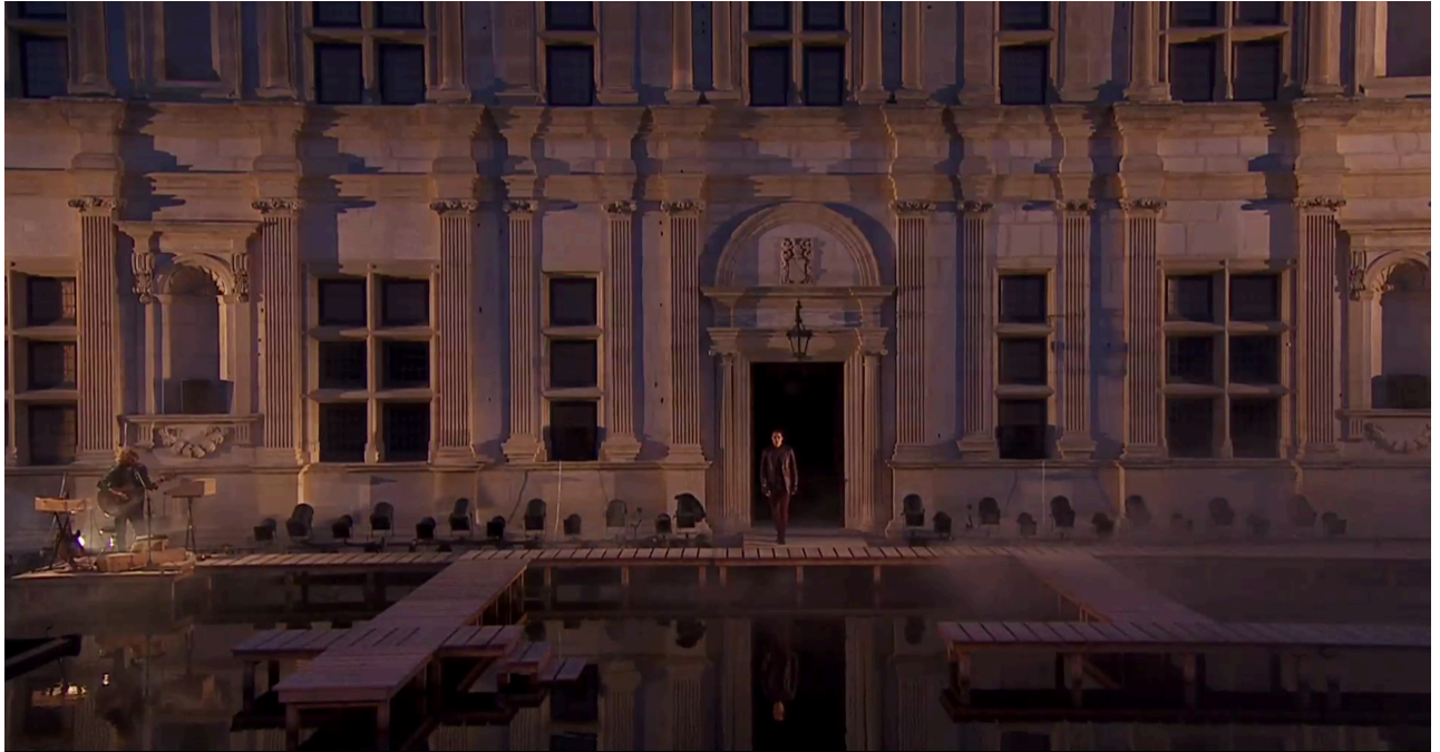
Lucrece Borgia , de Victor Hugo, mise en scène David Bobée