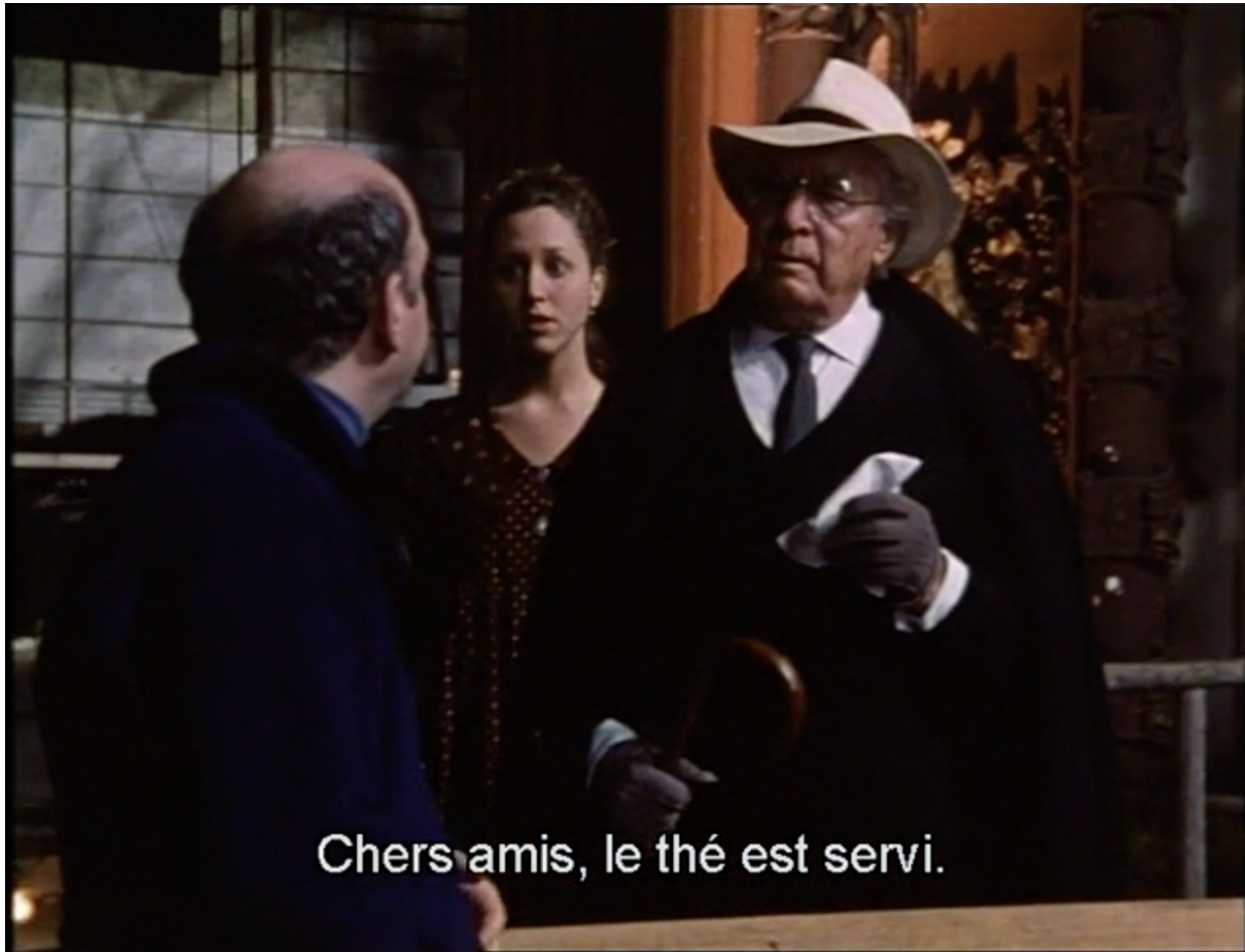
Pr. Serebryakov pendant la pièce

On peut voir que le seul changement de costume du Professeur est l'ajout d'une cravate à sa tenue de ville.