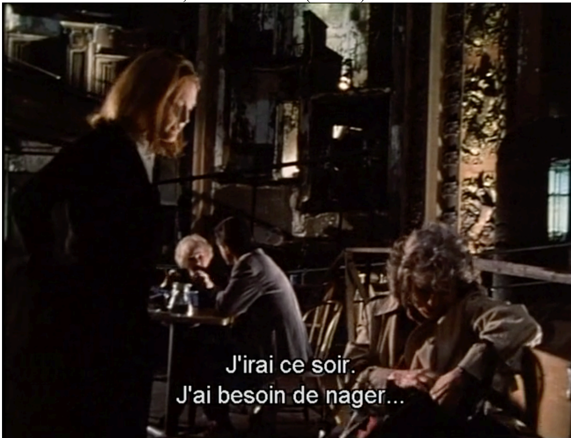
à gauche, Julianne Moore, arrivée dans le théâtre, ôte son manteau et devient Yelena.