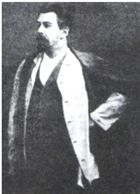
Constantin Stanislavski dans le rôle du Docteur Mikhaïl Astrov