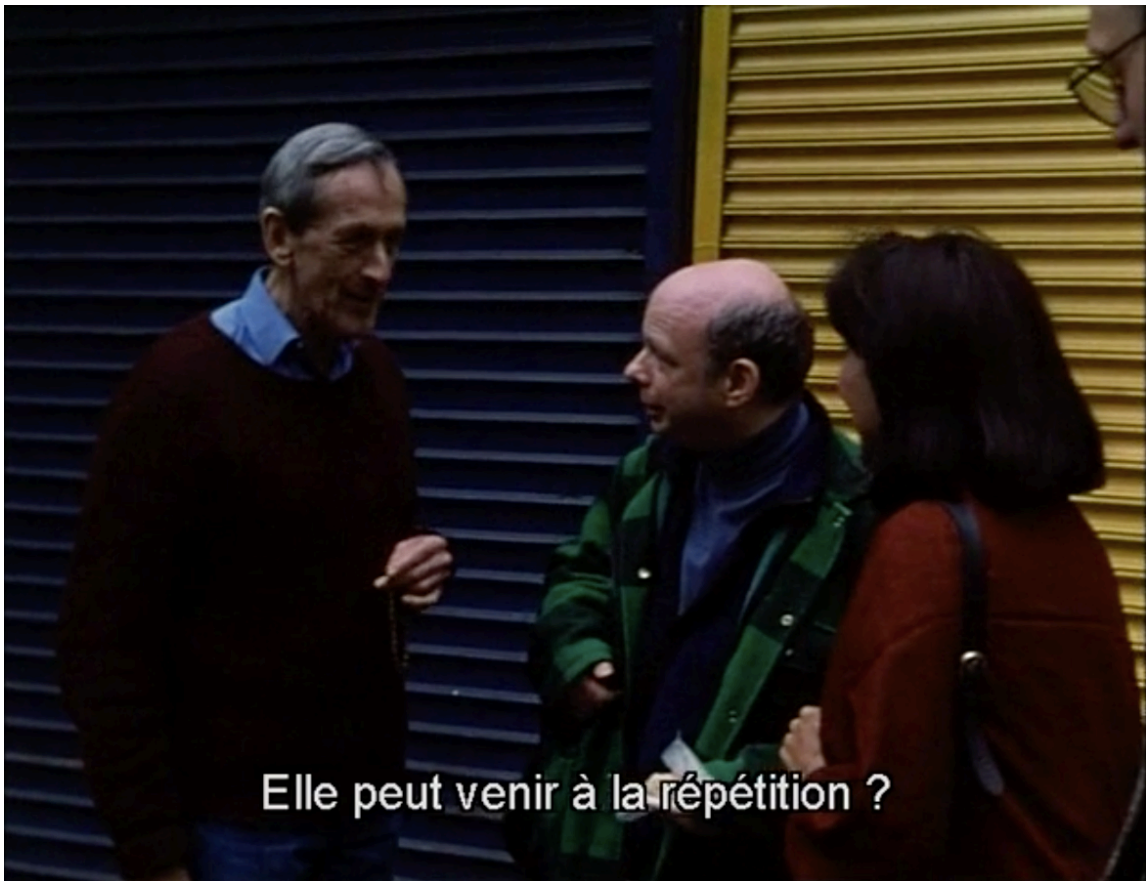
Wallace Shawn (Vanya) dans la rue