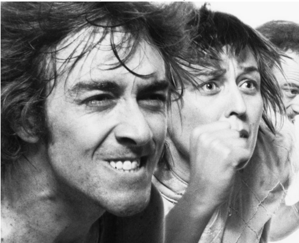
André Gregory, Saskia Noordhoek Hegt et Gerry Bamman