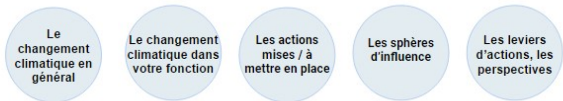
Figure 1- Une grille d'entretien élaborée selon 5 thèmes

→ Une grille d'entretien élaborée autour de 5 grands thèmes :