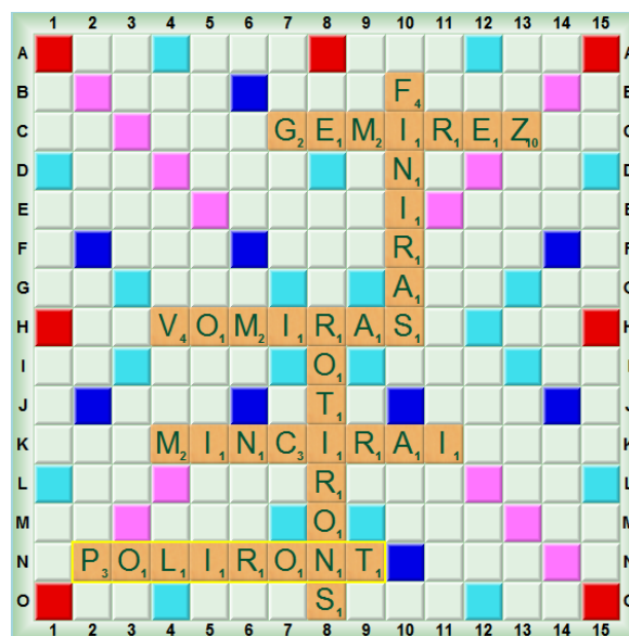
Fig. 17 : La grille finale de la partie 2