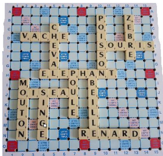
Fig. 2 : Un croisement de mots possible