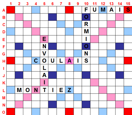
Fig. 8 : La grille avant le dernier coup

élèves ont sept lettres et 2mn30 pour rendre un bulletin avec leur solution. Le top de chaque coup est un mot conjugué à l'imparfait, un temps étudié plus tôt dans l'année et dans lequel les terminaisons sont identiques pour tous les groupes.