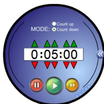
Fig. 16 : L'échauffement de la partie 2