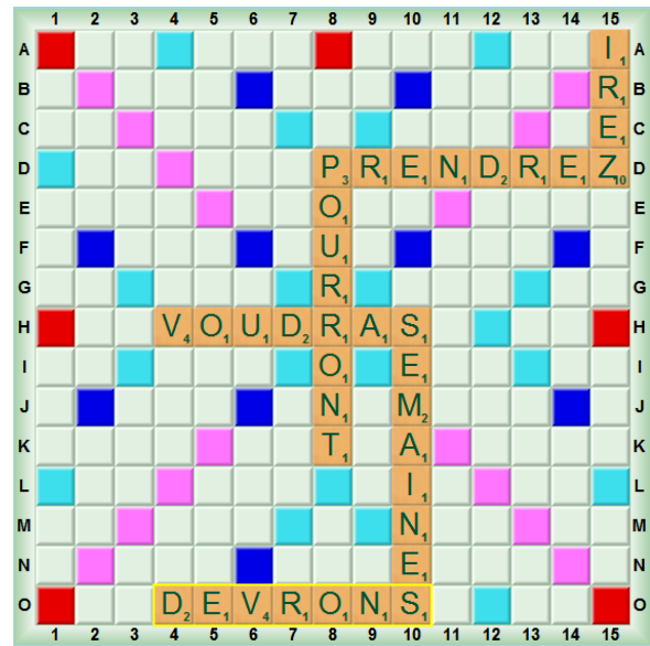
Fig. 19 : La grille finale de la partie 3