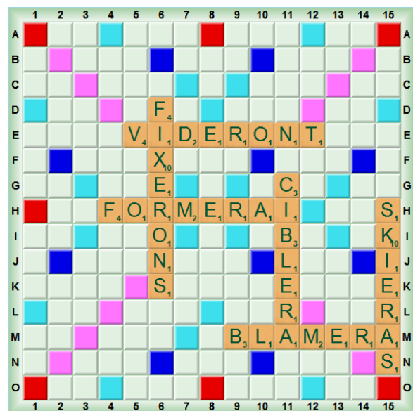
Fig. 14 : L'échauffement de la partie 1