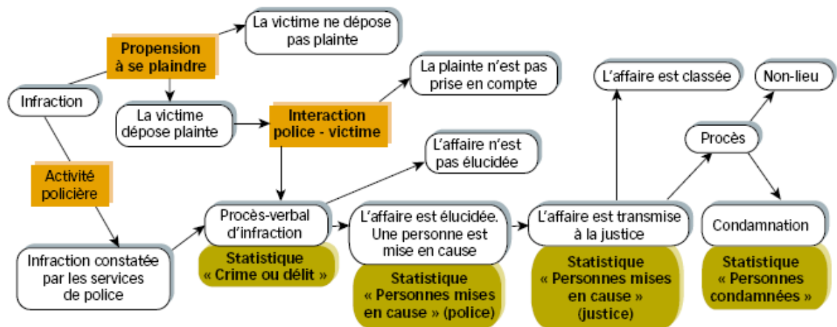
Document 2 : Schéma du manuel de 1ère SES, Hatier

Le document ne fut pas analysé collectivement comme je le fais d'habitude afin de permettre une meilleure compréhension du document et avant laisser les élèves se lancer dans la tâche demandée. J'ai choisi d'agir ainsi afin de coller au mieux avec la situation de problème telle que j'ai pu la comprendre. Également, sur la même page du manuel se trouvait un document sur les politiques du chiffre qui pouvait aider les élèves à mieux appréhender et comprendre le document sur lequel ils devaient travailler.