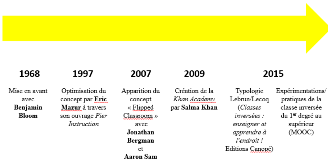
Tableau adapté du site www.pedagogie.ac-nantes.fr : Le numérique à l'École : quelle culture pour quels usages ?