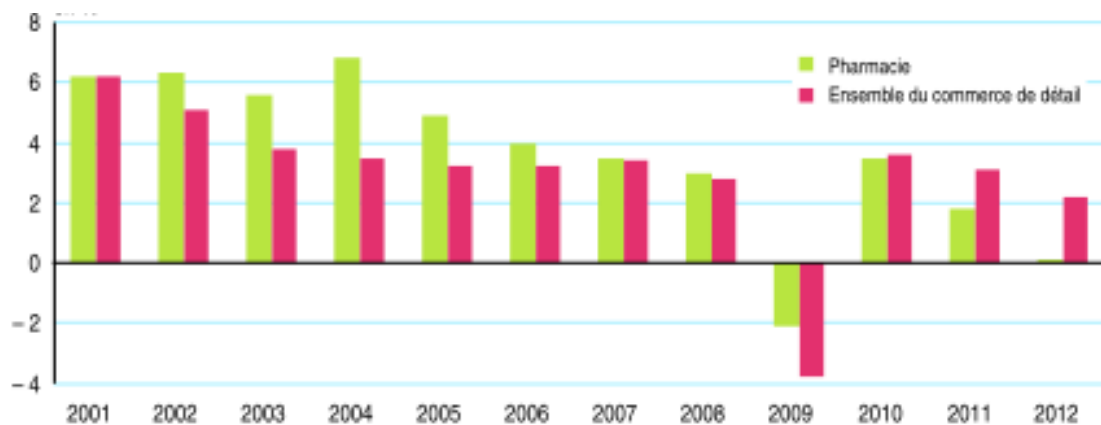
Tableau 4 : Taux de croissance annuel des chiffres d'affaires du secteur de la pharmacie et du commerce de détail depuis 2000 (en pourcentage).

Entre 2000 et 2006, le chiffre d'affaires du secteur de la pharmacie avait progressé de +5.6% par an en valeur.