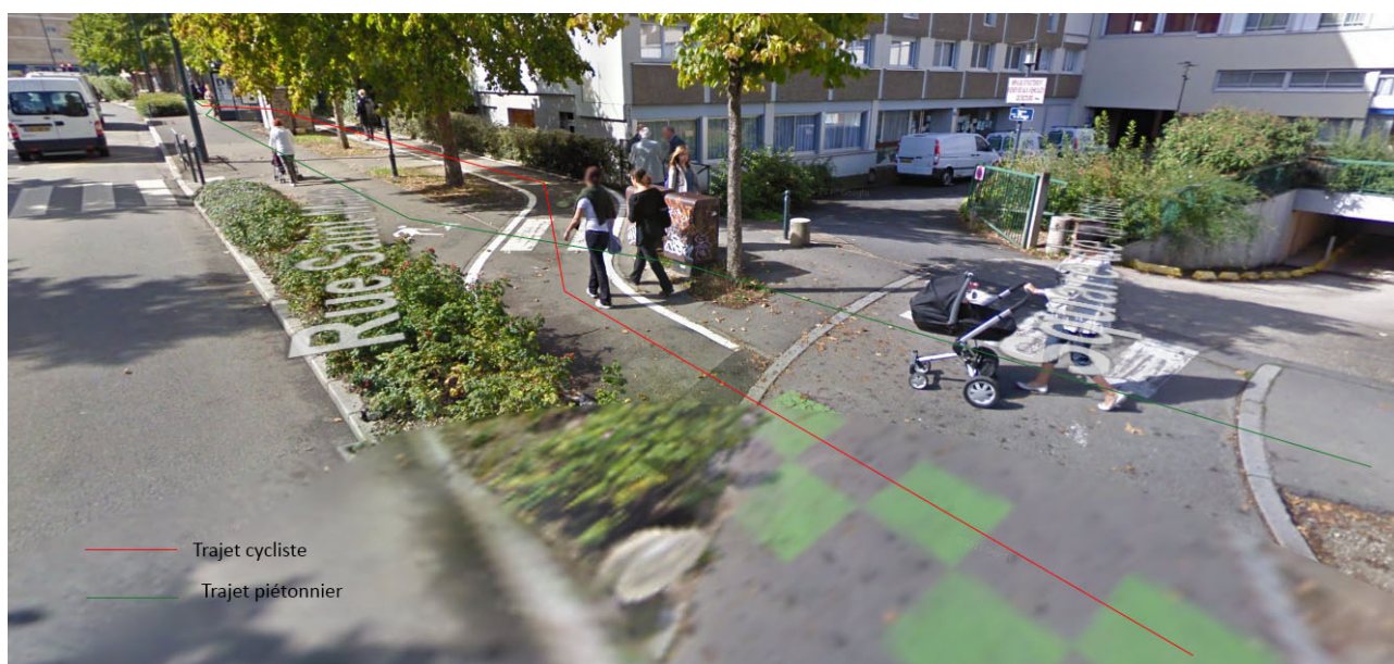
Exemple de la rue de Saint Malo, Rennes, Google Street View.

Il est donc clair que nous n'avons pas encore le génie hollandais pour la création de ces pistes, et qu'elles sont donc aujourd'hui, en tant que dispositif de signalétique, mal conçues. Et pourtant il y a de la demande, à l'image de J. qui serait favorable « Pour qu'il y ait des voies sécurisées et fonctionnelles pour les cyclistes » ainsi que la reconnaissance de ce qui a été produit, avec tout de même un bémol pour B. « C'est bien qu'il y ait plus de pistes cyclables, mais ce n'est pas toujours clair ». Nous sommes donc dans une situation où le vélo n'est pas remis en cause, la piste cyclable non plus, mais bien le déploiement de ce dispositif. A partir de ce point, il semble y