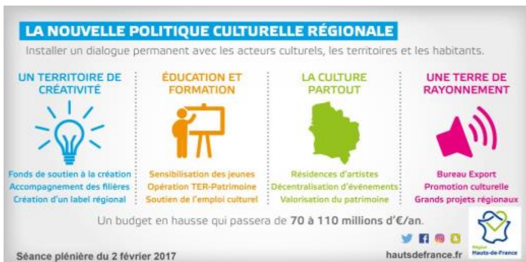
Infographie du Conseil régional sur la nouvelle politique culturelle

Au contraire de son homologue Laurent Wauquiez, président de la région Auvergne-Rhône-Alpes de la même famille politique, Xavier Bertrand tient un discours et une mise en œuvre volontariste autour de la culture. Il semble s'être au contraire inspiré du prédécesseur de Wauquiez, Jean-Jacques Queyranne, qui avait testé la concertation comme outil de création de politiques publiques 26 . La concertation démocratique des acteurs régionaux faisait alors acte d'innovation dans la réflexion et l'adaptation territoriale sur les politiques culturelles. Le changement de région a été l'occasion de mettre en place ces outils de politiques publiques dans le domaine de la culture. Le Channel a d'ailleurs directement bénéficier de cette vitalité régionale, puisque 1 million lui a été promis pour relancer une édition des Feux d'Hiver 27 .