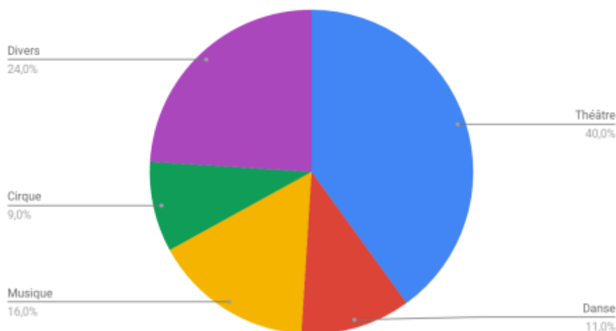
Répartition de la programmation par discipline

Cette répartition est une ligne de conduite idéale que s'est fixé le directeur pour présenter la convention d'objectifs pluriannuelles. Il se laisse néanmoins la liberté de transgresser ces objectifs en fonction des spectacles vus et de la qualité des créations contemporaines en présence.