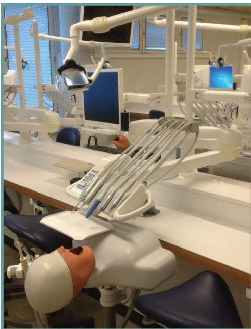
Figure 6 - modèle type de salle de TP

Chaque station est évaluée par un ou deux examinateurs et dure entre 5 et 15 min. L'épreuve peut se dérouler sur un patient réel ou simulé. L'appréciation globale résultera de la moyenne des appréciations reçues. Dans l'université publique de la Complutense de Madrid, en fin de 5e année l'étudiant doit valider l'ECO (Evaluación Clínica Objetiva Estructurada). L'étudiant sera interrogé parmi une liste de 69 items pratiques et théoriques.