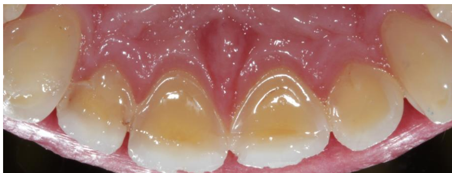
Figure 5 : Erosion des faces palatines des incisives maxillaires liée à une consommation régulière d'alcool

Il convient également de supposer que les facteurs alimentaires favorisant la carie ou