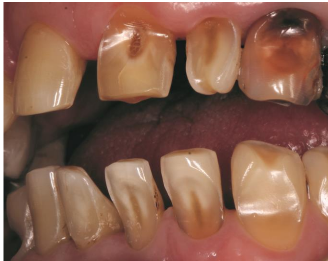
Figure 4 : Erosions sévères des faces vestibulaires, liée à une consommation excessive de soda associée à un brossage inadapté (Equipe d'OCE du CHU de Rennes)

Sur la façon de consommer les boissons, les études sont mitigées. Nahás Pires Corrêa et Coll(18) soulignent que la façon de boire n'est