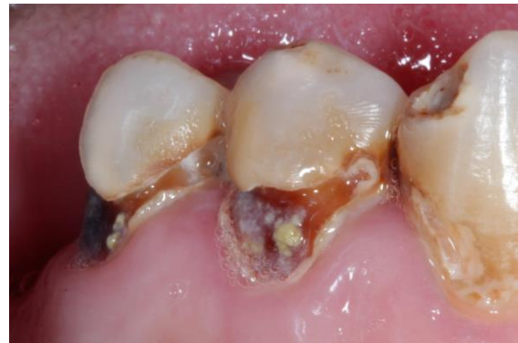
Figure 2 : Caries du collet chez un patient sujet au grignotage.

Pour Feldens et Coll, les habitudes alimentaires dès les premières années de la vie influent sur la sévérité des caries apparaissant les années suivantes (12).