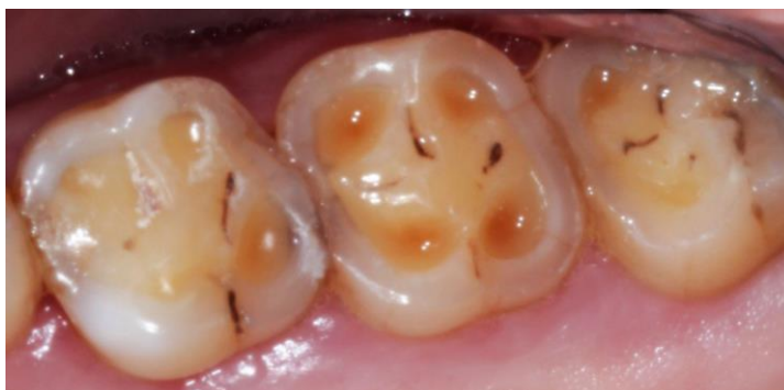
Figure 3 : Erosion occlusale des molaires maxillaires chez un consommateur de soda (Equipe d'OCE du CHU de Rennes)

Enfin, Feldens et Coll concluent que les enfants allaités 3 fois par jour ou plus, à 12 mois, sont plus à risque de caries précoces de l'enfance sévères par rapport à ceux qui n'ont pas d'allaitement ou seulement maximum 2 fois par jour. Le risque est également plus important pour les enfants ayant 8 repas par jour, comparé à ceux qui en ont moins de 7. Une fréquence importante d'allaitement à 1 an est associée à une augmentation du risque