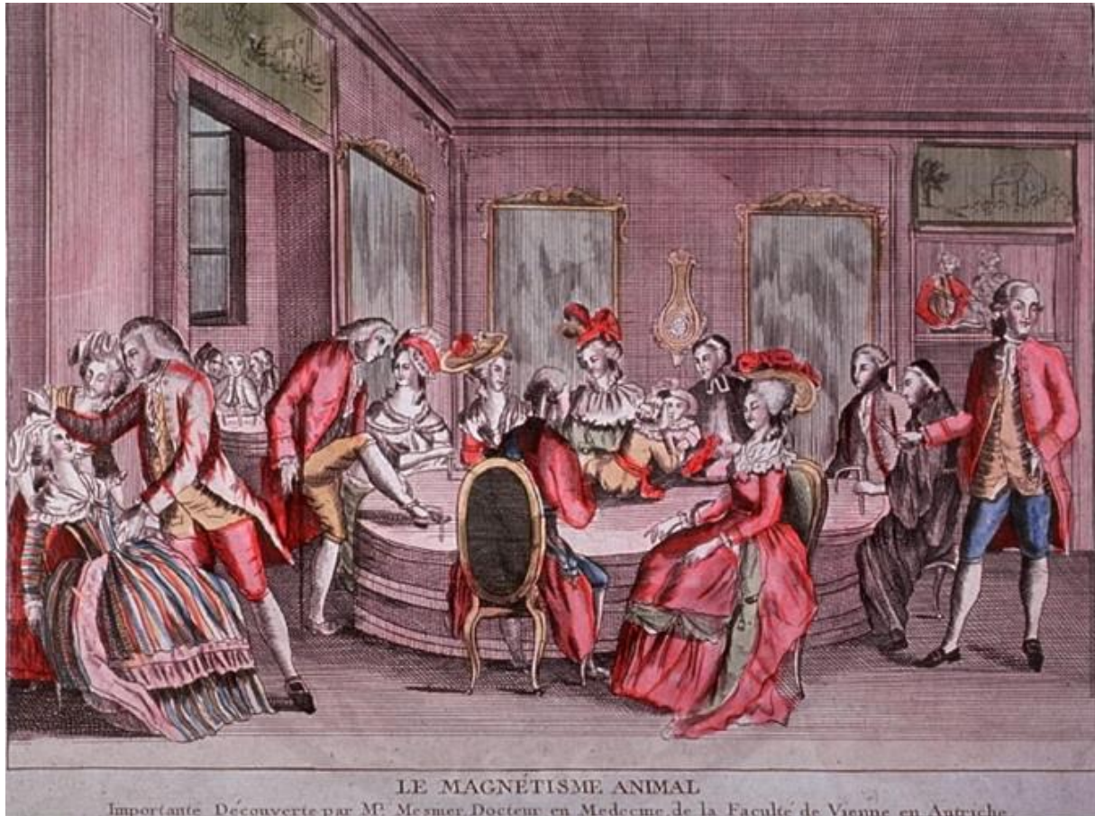
Figure 1 : Le magnétisme animal, séance du baquet de Messmer

Source : Artiste inconnu, Le magnétisme animal, vers 1780