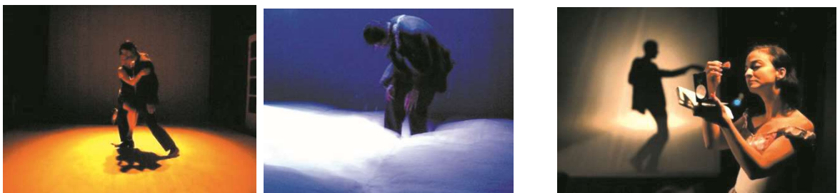
Figure 14 : photographies officielles de Pénélope ô Pénélope

Les photographies de Pénélope ô Pénélope laissent deviner que la danse est également un élément important du spectacle :