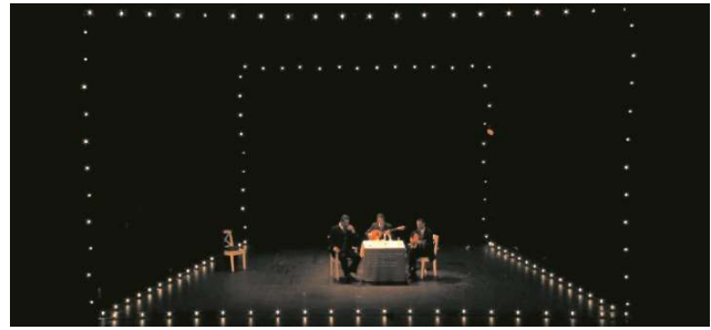
Figure 3 : Photographie de Ménélas Rebétiko Rapsodie de Simon Abkarian

Les chants rébètes ne sont pas présents dans l'édition du texte Ménélas Rapsodie . Les surtitres permettent de les rendre visibles et les chants rébètes 65 ne disparaissent alors pas totalement quand le chanteur termine. Les photographies et la captation du spectacle témoignent de leur existence et les conservent même après les représentations. Un lecteur de la pièce qui n'a pas vu le spectacle ne peut pas savoir qu'il lui manque une partie du texte, et les surtitres forment une sorte de nouveau livre, sur un support différent de l'impression traditionnelle, offert aux spectateurs et spectatrices. Ces chants racontent une histoire d'amour et ont la même forme que le texte de Simon Abkarian (un monologue à la première personne du singulier, adressé à l'être aimé parti 66 ). L'écriture sur scène crée un phénomène de coprésence, avec la parole redoublée par l'écriture. Les surtitres apportent un élément visuel de monologue fleuve, et mettent en page ce que dit le comédien.