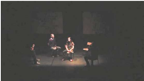
Figure 9 : Iliade , capture d'écran de la captation, à 20min.27

Quand Hector finit sa réplique, les quatre autres comédien-ne-s changent la disposition du plateau, en même temps que la lumière dessine un espace au centre, séparé du public car derrière le tapis en papier blanc. Bascule des lumières qui montre les deux espaces de jeu distincts.