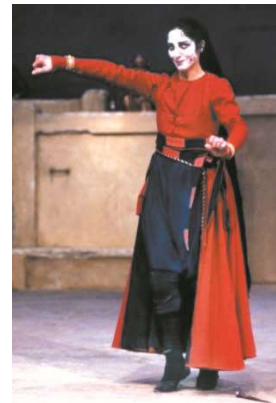
Figure 2 : Photographie du Théâtre du Soleil, d'Agamemnon : Clytemnestre.

La dimension traditionnelle des Atrides est celle des théâtres balinais et japonais, qui sont des formes de spectacles qui reposent sur des traditions culturelles ancestrales.