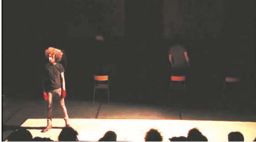
Figure 7 : Iliade , capture d'écran de la captation, à 20min.22

Dans Iliade , ces scènes se déroulent au milieu et à l'arrière du plateau, et le quatrième mur est matérialisé par le tapis en papier blanc en avant-scène (décrit par Pauline Bayle comme le « champ de bataille » 127 ).