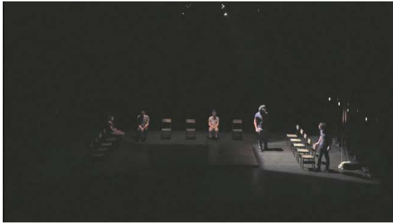
Figure 19 : capture d'écran d' Odyssee , à 4min.50.