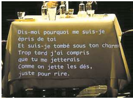
Figure 4 : Photographie de Ménélas Rebétiko Rapsodie de Simon Abkarian