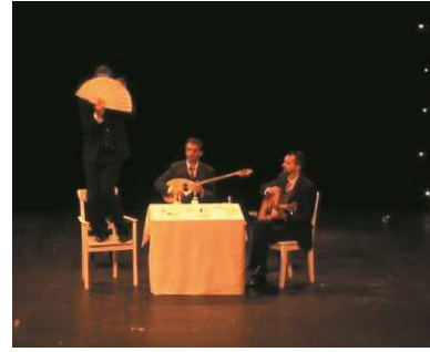
Figure 6 : Ménélas Rebético Rapsodie, capture d'écran de la captation à 55min.53

Ménélas imite Tyndare : « C'est Hélène qui choisira, vous tous accepterez son choix. »