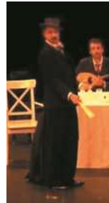
Figure 20 : Capture d'écran de Ménélas Rebétiko Rapsodie, à 22min.12.

« Pourquoi s'est-elle sauvée ta jument en chaleur ? »