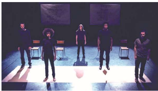
Figure 17 : Iliade , photographie de la compagnie À Tire-d'aile.

Dans Iliade et Odyssée , les moments de récit à la première personne sont matérialisés sur scène par le placement des comédien·ne·s car ils et elles forment systématiquement une configuration de groupe, souvent en ligne :