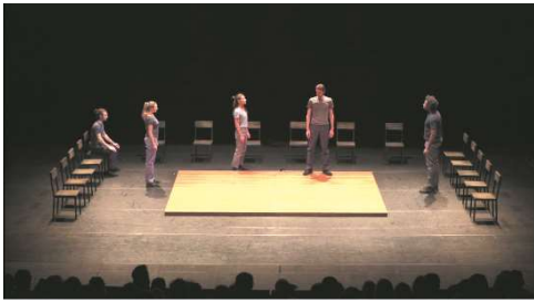
Figure 11 : Odyssée , capture d'écran de la captation à 23min.28

Cependant, dans Odyssée , l'espace de jeu des scènes dialoguées est aussi délimité par le cadre des chaises :