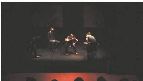
Figure 8 : Iliade , capture d'écran de la captation, à 20min.25

Hector décrit « les Grecs assiégeurs désormais assiégés ». Pas de quatrième mur, adresse au public, espace de jeu délimité par des lumières latérales qui créent un couloir.