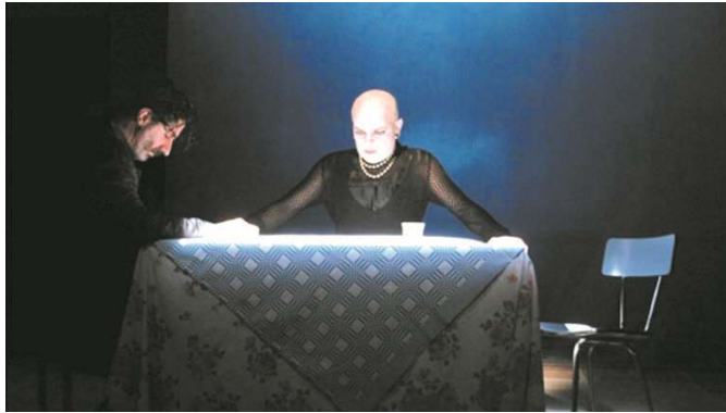
Figure 24 : Photographie officielle de Pénélope ô Pénélope, © Karim Dridi.

version de 2008. Mais dans la reprise de cette année 2018, c'est une comédienne qui récupère le rôle (Ariane Ascaride). Les deux comédien·ne·s n'ont aucun trait en commun, aucun·e des deux n'étant androgynes : Georges Bigot est grand, costaud et chauve, alors qu'Ariane Ascaride est petite et menuë, avec des cheveux longs.