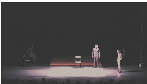
Figure 10 : Odyssée , capture d'écran de la captation, à 11min.04

La lumière a une importance majeure dans le jeu, en créant soit un espace ouvert sur celui du public, et proche de lui, soit un espace clos qui délimite concrètement l'univers de la fiction en train de se faire. Le même procédé scénographique est utilisé dans Odyssée :