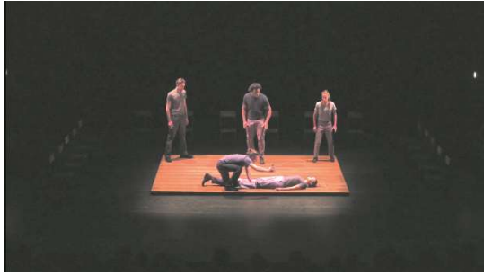
Figure 13 : Odyssée , capture d'écran de la captation à 31min.50.