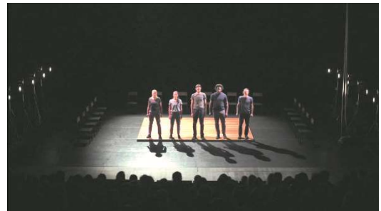
Figure 16 : Odyssée , capture d'écran de la captation à 27min.31.

Les comédien·ne·s en rang décrivent une scène de combat.