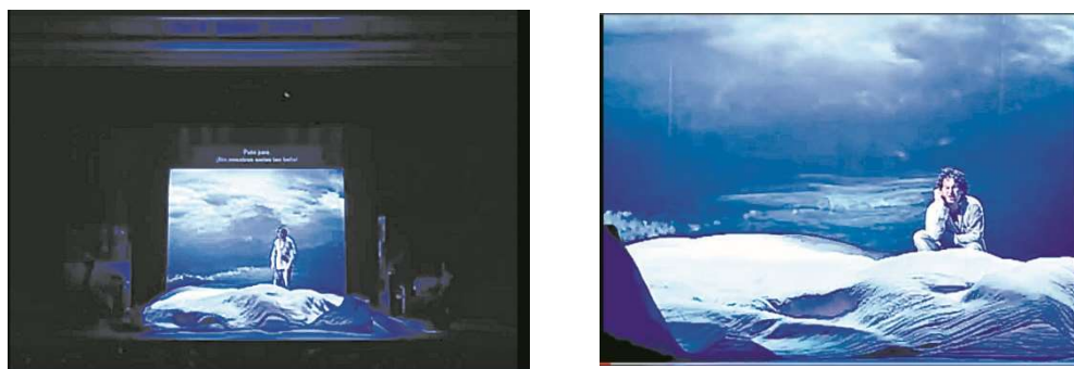
Figure 15 : Pénélope ô Pénélope , captures d'écran d'un extrait du spectacle,

La dimension musicale, chantée et dansée des spectacles d'Abkarian participe à la création d'un univers poétique non naturaliste, accentué dans Pénélope ô Pénélope par la scénographie. En effet, dans la scène 4, lorsque Théos revient de son voyage en mer, on le voit sur scène dans un océan de tissu :