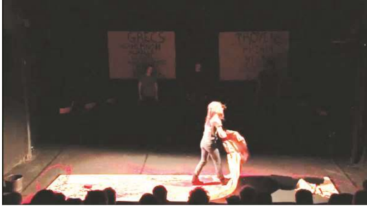
Figure 12 : Iliade, capture d'écran de la captation à 1h.00.27

Achille, après s'être éclaboussé de sang, déchire le papier représentant le champ de bataille pendant que, au fond de la scène, les quatre autres comédien·ne·s décrivent son avancé dans le camp troyen.