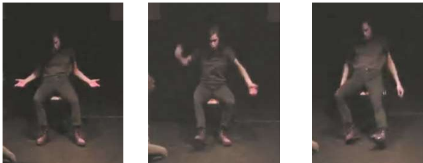
Figure 22 : Captures d'écran de la captation d' Iliade , 0min.25 à 0min.50

Quant aux personnages humains, leur traitement est plus subtil : ils sont actualisés mais on les reconnaît sans problème, et nulle trace de parodie ou de caricature. L'humanisation des personnages, surtout celle d'Achille et Hector, passe principalement par le jeu. L'interprétation d'Achille par Charlotte van Bervesselès offre une vision décalée du héros. En plus d'être joué par une femme, Achille a parfois l'attitude physique d'enfant capricieux :