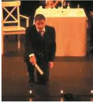
Figure 5 : Ménélas Rebético Rapsodie, capture d'écran de la captation, à 55min.18

Ménélas imite Tyndare : « C'est Hélène qui choisira, vous tous accepterez son choix. »