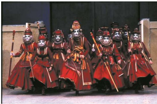
Figure 1 : Photographie du Théâtre du Soleil, d'Agamemnon : le chœur.

Dans Les Atrides , la société grecque antique est transposée au Japon, par les costumes qui sont des vêtements traditionnels japonais :