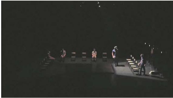
Figure 19 : capture d'écran d' Odyssee , à 4min.50.