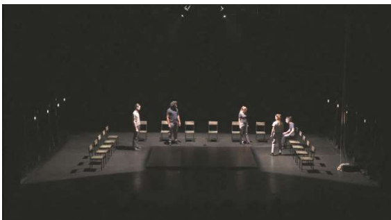
Figure 18 : capture d'écran d' Odyssée , à 4min.30

En effet, dans Iliade et Odyssée , les comédien·ne·s quittent très peu le plateau, même lorsqu'ils et elles ne sont plus en jeu. Les lumières délimitent souvent des petits espaces en plongeant le reste de la scène dans l'obscurité, dans laquelle les comédien·ne·s qui ne jouent pas attendent, immobiles et presque invisibles, et s'animent pour les changements de décors et d'épisodes. Si ils et elles sont dans l'ombre, les comédien·ne·s restent toujours visibles, on devine leur présence derrière ou autour de ceux et celles sous les projecteurs. De cette façon, on ne les voit plus comme des personnages mais bien des comédien·ne·s. De plus, dans Odyssée , dès la quatrième minute, les comédien·ne·s changent de personnages à vue : ils et elles jouent les prétendants parlant à Télémaque puis, quand la lumière change, ils et elles se déplacent et deviennent la Nourrice et Télémaque (interprété par un autre comédien).