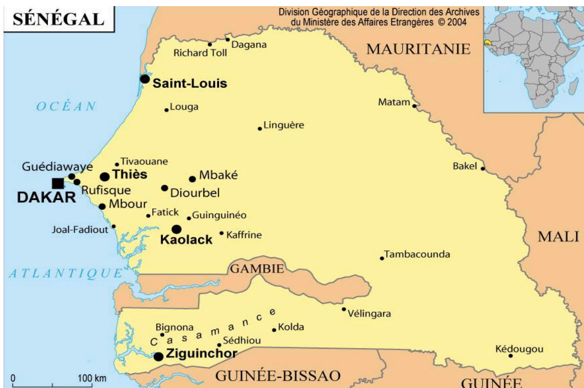
Image n° 1 : Sénégal : situation géographique en Afrique et carte des villes (10)

En Normandie, dans certaines communes de Seine-Maritime, et plus particulièrement au Havre, il existe une diversité culturelle importante due à une immigration principalement d'origine subsaharienne et significativement sénégalaise, depuis le milieu années 1970 jusqu'à la fin des années 1990 (9). Selon la définition adoptée par le Haut Conseil à l'Intégration, « un immigré est une personne née étrangère à l'étranger et résidant en France. Les personnes nées françaises à l'étranger et vivant en France ne sont donc pas comptabilisées. À l'inverse, certains immigrés ont pu devenir français, les autres restant étrangers. La qualité d'immigré est permanente : un individu continue à appartenir à la population immigrée même s'il devient français par acquisition. C'est le pays de naissance, et non la nationalité à la naissance, qui définit l'origine géographique d'un immigré »(4).