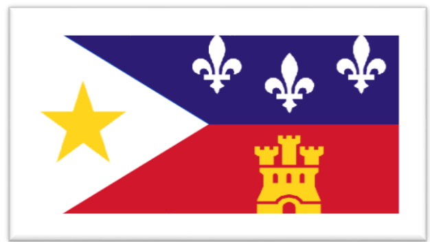
Drapeau 2 : Cadien