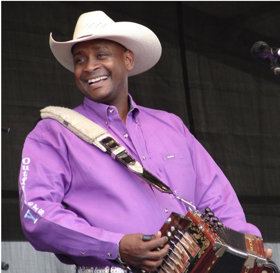
Photographie 1 : Geno Delafosse

Ce témoignage, qui est assez radical dans son propos, nous prouve que ce thème est à considérer. Pour certains Créoles, le Zydeco est leur musique, car ils connaissent la société dont il parle puisqu'ils en sont issus. Cependant, tous les Créoles ne vivent pas dans les mêmes lieux. Il y a des Créoles ruraux et des Créoles urbains. Ces deux populations ne peuvent pas avoir toutes leurs références en commun. Certains musiciens vont alors choisir de s'adresser aux ruraux plutôt qu'aux citadins. Pour ce faire, ils vont notamment adapter leur apparence physique et s'habiller d'une certaine manière. Généralement ces musiciens vont adopter une tenue vestimentaire de fermier ( cowboy ) qui parlera plus aux Créoles ruraux, et ceux-ci s'identifieront alors à ces musiciens. C'est le cas notamment de l'artiste Geno Delafosse que l'on peut voir sur l'illustration suivante.