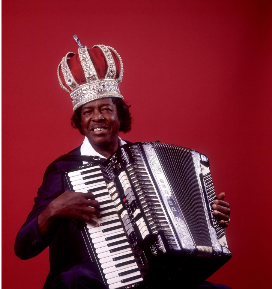
Photographie 3 : Clifton Chenier