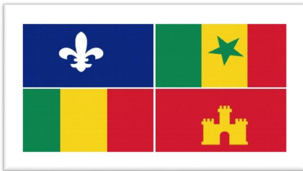
Drapeau 1 : Créole

postulat que cette identité est une réalité. Mais cela pourra effectivement être discuté, car la frontière entre plusieurs identités n'est pas forcément quelque chose de tangible, comme dans le cas qui nous occupe, entre identité cadienne et créole. Malgré cela, l'identité culturelle (puisque'il s'agit de ce qui nous intéresse) se forme autour de symboles communs à la collectivité. Ces symboles sont des repères qui permettent aux individus de s'identifier. Nous allons ici prendre un exemple. Un des symboles les plus utilisés par les populations est celui de l'étendard, du drapeau. Chaque pays possède son drapeau, et ce symbole est souvent repris par des identités intra-nationales. Avec le renouveau de la culture française en Louisiane, les Cadiens se sont retrouvés autour d'un drapeau ; les Créoles ont fait de même.