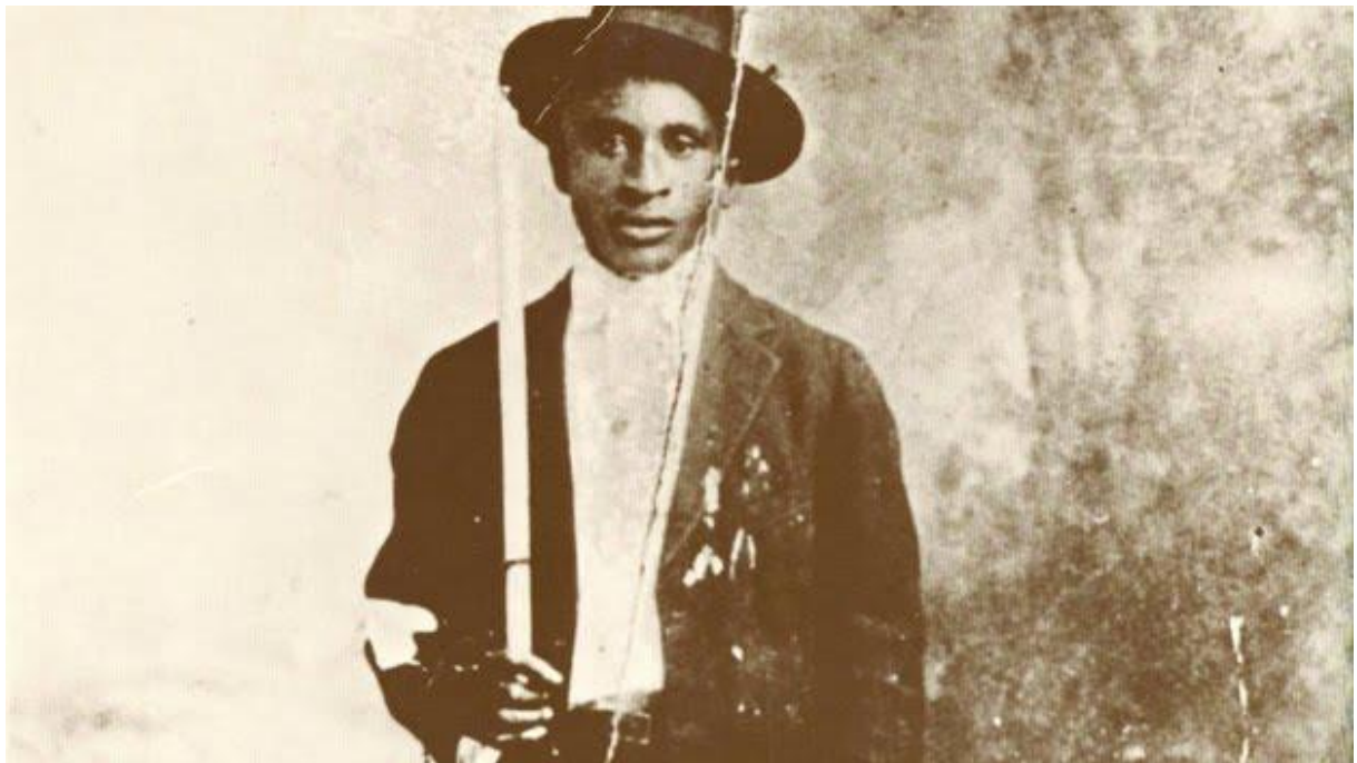
Photographie 2 : Amédée Ardoin