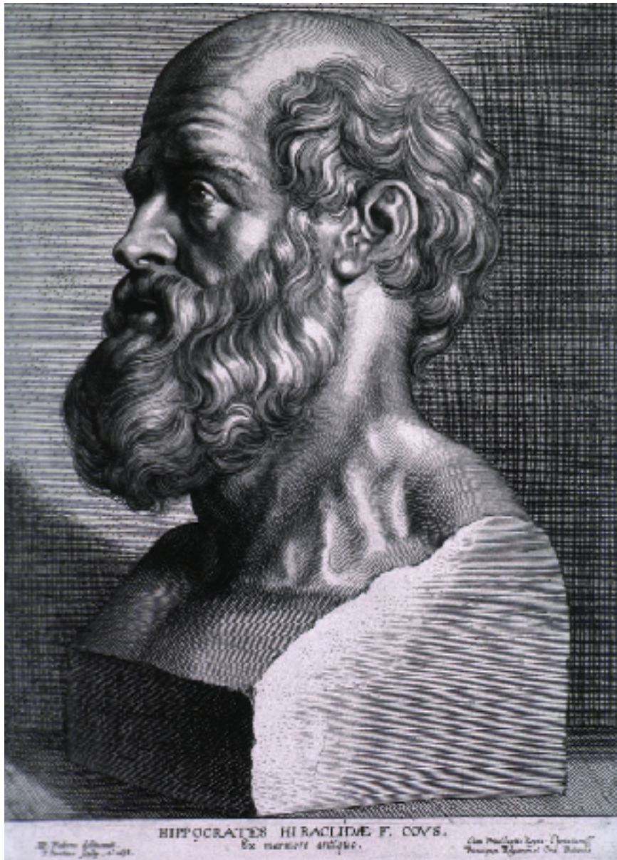
HIPPOCRATES HIRACLIUM F. COVS. Ex marmore antiquo.