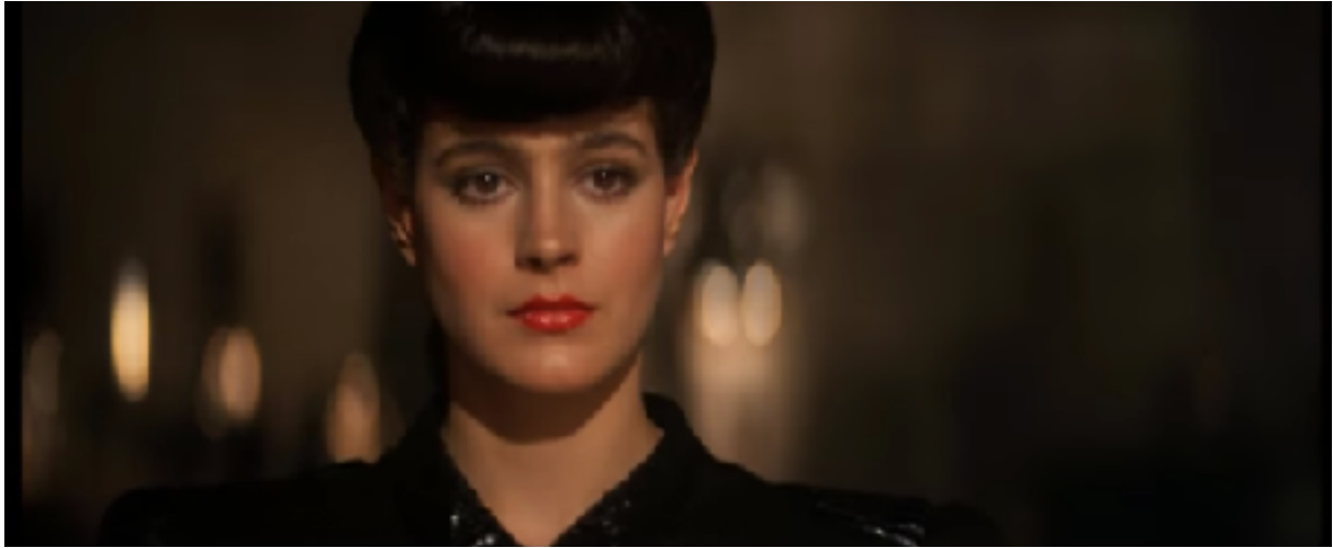
Fig. 9. Ci-dessus: Sean Young dans la peau de Rachel.

Rachel a les lèvres rouges comme la rose, les cheveux noirs comme l'ébène, le teint blanc comme la neige (Fig. 9). Comme elle, elle est pure et innocente, et comme elle, le prince charmant sauvera sa vie en échange de son amour éternel, action cristallisée dans le dessin animé par un baiser chaste, et dans Blade Runner par un viol. Dans le cas de Rachel, elle croque métaphoriquement la pomme, et donc accède à la connaissance, lorsqu'elle demande des informations à Deckard que Tyrell, son dieu, refuse de lui donner. Ainsi, elle outrepassa la prescription divine et pousse Deckard, dans le rôle d'Adam, à partager son péché. La fuite de la gynoïde entraîne sa condamnation à mort et la mise en danger de la vie de Deckard. Ils fuient donc Los Angeles ensemble, pour aller se cacher dans une nature désolée. Ils auront un enfant et ainsi marqueront l'avènement d'une nouvelle espèce. La réadaptation de contes et mythes est un moyen parmi d'autres de replacer la femme dans une position de culpabilité inhérente à sa condition, pour laquelle, elle doit être punie ou sauvée, comme théorisé par Mulvey. Ex Machina va dans le sens contraire de cette prescription, mais Ava incarne tout de même une menace pour l'humanité et, spécifiquement, pour l'homme. Ces deux cas démontrent qu'ici la femme et le péché ne font qu'un. Le corps féminin porte en son sein la symbolique du péché et de la tentation (sexuelle). Ainsi, la responsabilité du désir masculin