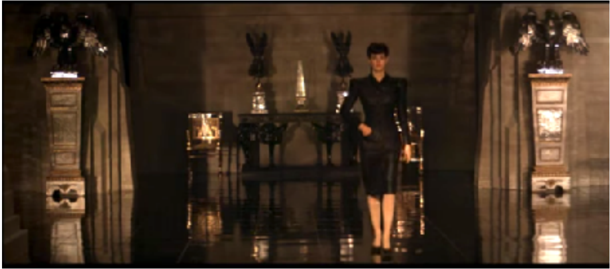
Fig. 10. Ci-dessus: Rachel telle qu'elle est habillée lorsqu'elle rencontre Deckard pour la première fois.

au premier volume de Women in Film Noir 104 d'E. Ann Kaplan par la phrase: « L'homme doit contrôler la sexualité féminine afin de ne pas être détruite par elle. » 105 . Cette phrase offre effectivement un résumé parlant de la relation entre Deckard et Rachel. La figure de la femme fatale est, dans ces films, caractérisée par sa force de caractère, son autonomie et son aura sexuel agressive. En d'autres termes, la femme fatale est caractérisée par son attitude connotée masculine. Lorsque Deckard et le spectateur rencontrent Rachel, cette définition lui colle à la peau. Comme évoqué plus haut, elle présente un grand sang froid et une attitude de provocation séductrice maîtrisée envers Deckard. Elle porte un tailleur jupe noir rigide, ce qui évoque un professionnalisme appartenant à la sphère du masculin, effet renforcé par ses épaulettes saillantes (Fig. 10). Cependant, le tailleur lui marque la taille et accentue ses hanches en laissant apparaître de longues jambes effilées perchées sur de hauts talons. Elle porte ses cheveux bruns en un chignon sévère qui lui descend sur la nuque et une frange courte à la mode des 50s. Dans le clair obscur ambiant, ses lèvres rouge vermillon ressortent dans l'image. Elle est filmée en semi contre plongée à plusieurs reprises, ce qui accentue son aspect autoritaire, d'autant plus lorsque Deckard s'assoit en face d'elle tandis qu'elle reste