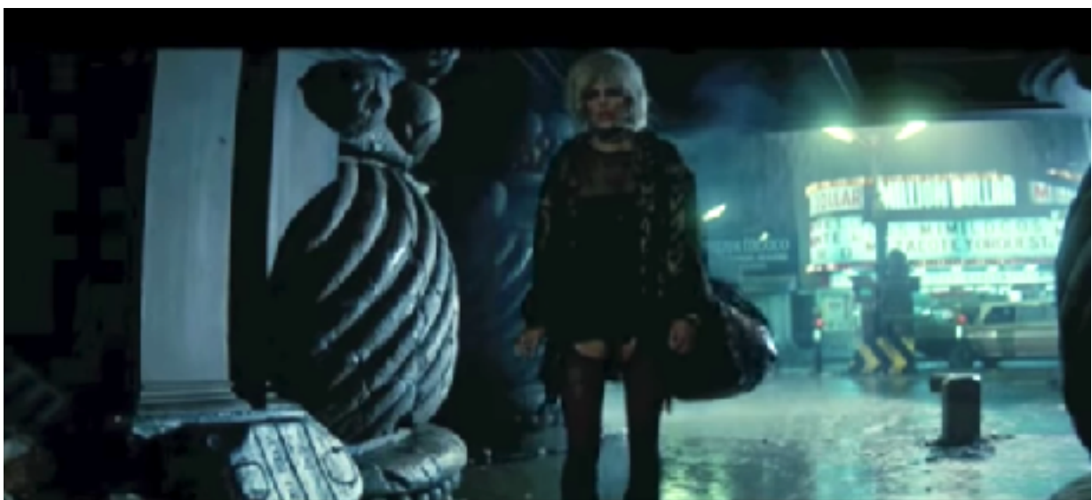
Fig. 12. Ci-dessus: Pris (Daryl Hannah) telle qu'elle apparaît pour la première fois dans le film.

Par sa transformation, Rachel a pu être sauvée, mais ce n'est pas le cas des deux autres répliquantes du film, précédemment mentionnées. Pris et Zhora, elles, ont été punies par Deckard. Leur destin funèbre est en rapport direct avec les caractéristiques physiques de leur féminité qui, contrairement à Rachel, refuse d'être subordonnée. Leur sexualité est également présentée comme agressive, mais, en choisissant le combat plutôt que la rédemption dans la docilité, elles sont condamnées à mourir. Pris est un « modèle de plaisir », elle a été manufacturée pour satisfaire les besoins sexuels des soldats dans les colonies humaines sur Mars. Sa fonction première est donc littéralement celle d'objet sexuel. Lorsqu'elle apparaît pour la première fois à l'écran, elle marche de nuit dans une rue pluvieuse de la ville en plan large. Elle porte un veste sombre ornées de découpe à motifs animaliers sur une robe noir très courte qui dévoile de longues jambes habillées de collants noirs déchirés. Elle a de courts cheveux blonds platines en bataille et, à son cou, un collier en cuir qui ressemble à un collier de chien. Elle est le stéréotype de la prostituée cinématographique qui attend le client sur le trottoir, telle que l'incarne le personnage de Julia Roberts dans Pretty Woman (Garry Marshall, 1990) par exemple. Si la femme blonde peut représenter la douceur angélique, lorsque le blond devient platine, il signifie alors l'artificialité et inspire la méfiance. Notons