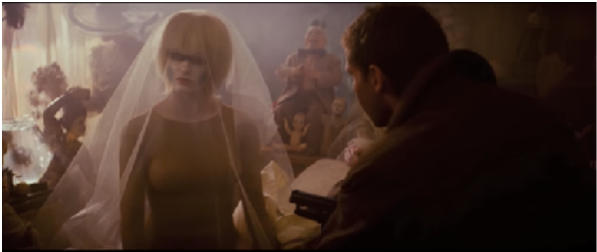
Fig.13. Deckard investiguant une Pris immobile.