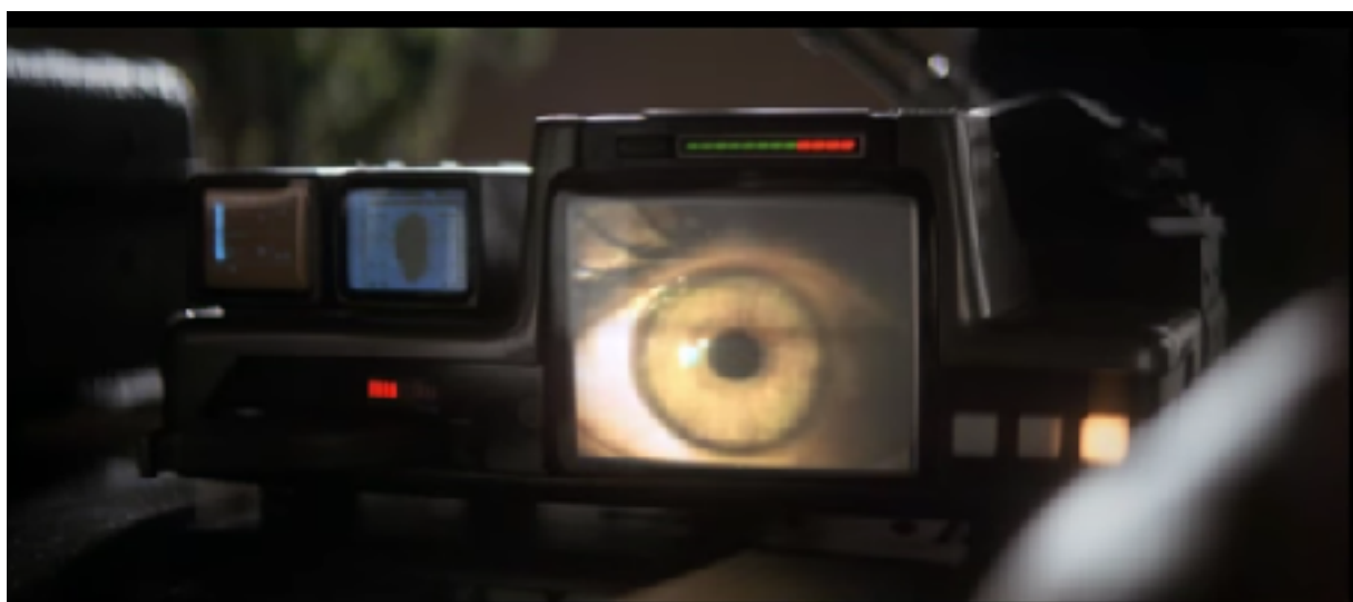
Fig. 1. Ci-dessus: la machine utilisée par Deckard pour amplifier la pupille de Rachel lors du test de Voight Kampff.

traditionnellement impartis, les femmes sont simultanément regardées et exhibées; leur apparence est codée pour produire un fort impact visuel et érotique qui connote « le-fait-d'être-regardé ». La femme exhibée est le leitmotiv du spectacle érotique [...], c'est sur elle que le regard s'arrête, son jeu s'adresse au désir masculin qu'elle signifie. » 44 . Mulvey cite deux aspects psychanalytiques qui suscitent le plaisir chez le spectateur. Le premier est la scopophilie. Le second est l'identification à l'image. Ces deux aspects sont catalysés à la fois par le personnage masculin et par le spectateur, regardant le personnage féminin. La femme est donc reléguée au statut d'image, objectivée, tandis que l'homme est un élément narratif actif. Si Mulvey se concentre sur l'étude de films hollywoodiens de la période classique que sont les oeuvres de Sternberg et Hitchcock, Blade Runner et Ex Machina offrent des pistes productives propices à l'application de ces théories. En effet, Ava et Rachel sont toutes deux sujets d'expériences. Leur statut implique d'emblée qu'elles se posent en tant qu'objets du regard. Les deux gynoïdes sont mises à l'essai, placées dans le rôle du cobaye. C'est vrai pour Rachel, comme évoqué plus haut, qui est assujettie au test de Voight-Kampff de Deckard, auquel elle a été offerte sans être consultée par son créateur (dont elle pense encore qu'il est simplement son employeur à ce moment du récit). De par la nature même du test, Rachel est