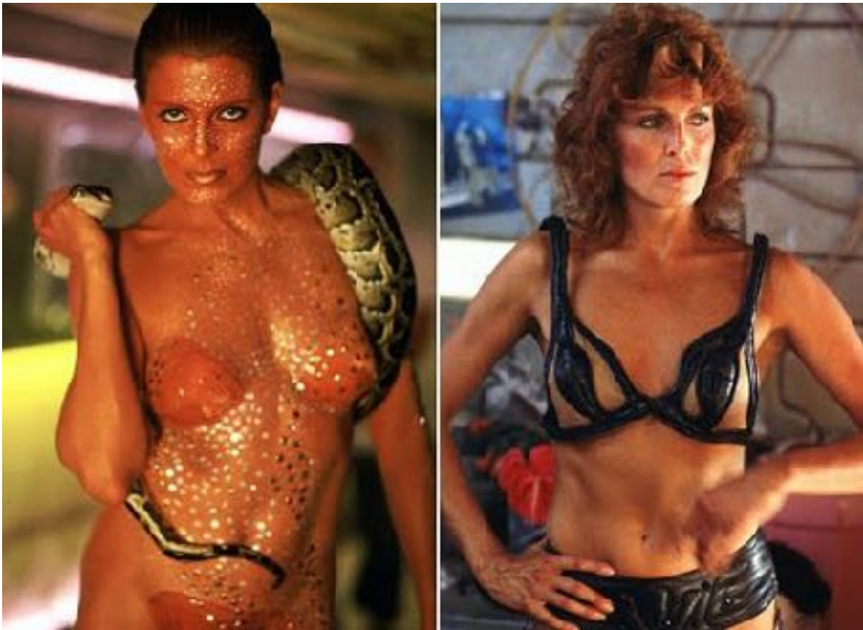
Fig. 14 et 15.. Ci-dessus: La transformation vestimentaire de Zhora.

jusqu'au moment où Deckard abat Zhora de plusieurs coups de feu. Alors qu'elle est étendue, sans vie, au milieu des mannequins d'une vitrine, un gros plan sur son visage révèle un serpent tatoué derrière son oreille, dernier rappel de sa nature pécheresse. La voilà à son tour punie. Les deux répliquantes sont coupables non seulement d'utiliser leurs corps à des fins sexuelles (l'une en tant que prostituée et l'autre en tant que strip-teaseuse) mais aussi de les utiliser pour se défendre contre Deckard. Cela implique que le corps féminin doit être utilisé uniquement pour le plaisir de l'homme et sous son contrôle strict. Si le strip-tease et la prostitution entrent dans ces conditions, ces activités impliquent également un contrôle féminin des modalités de cette utilisation, ce qui va donc à leur encontre. Deckard n'a pu contrôler ni leurs corps ni leurs sexualités et a donc dû les abattre. Leurs transformations vestimentaires montrent également qu'elles passent du statut d'objet passif, faites pour être observées et éventuellement prises, à celui de corps actif et potentiellement dangereux pour