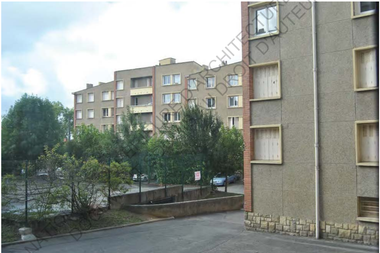
23 Photo Belle Paule

Au fil du temps, le problème du stationnement des voitures s'est posé également pour les habitants de la Belle Paule et a suscité une des rares transformations du projet originel avec la création d'un parking souterrain dans l'îlot plus à l'Est et l'installation de 8 box dans l'autre.