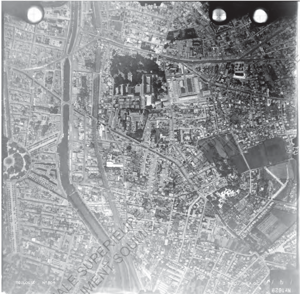
16 Photo aérienne du 3 Juin 1950

Dans le plan d'aménagement Nicod de 1947 ce terrain était situé dans le secteur B du plan, avec une hauteur des constructions qui était limitée à quatre étages sur les plus grandes parcelles (supérieures à 1000m 2 ), avec un recul obligatoire de quatre mètres par rapport aux limites séparatives et avec une densité maximale autorisée de 25 % de la surface des parcelles.