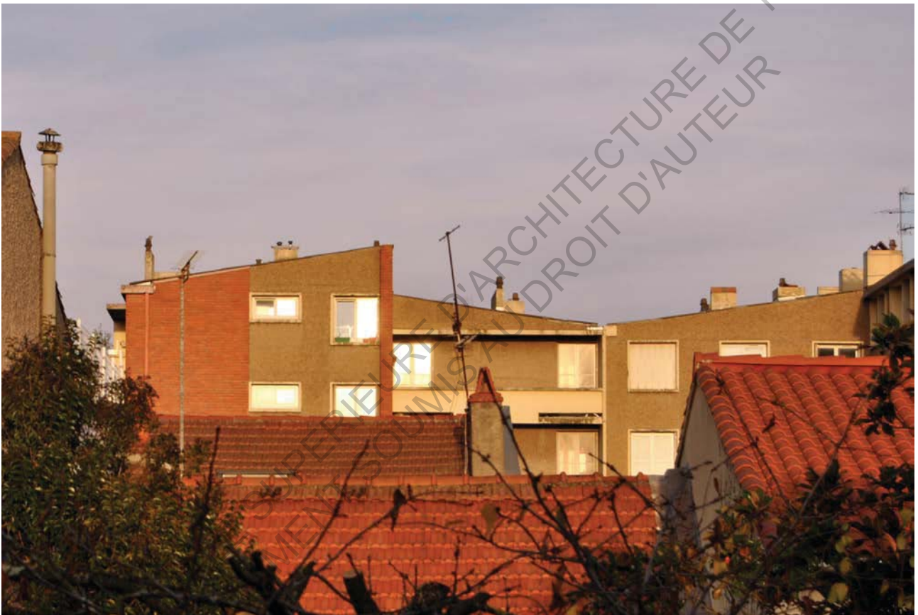
4 Photo depuis ma chambre louée pendant l'année 2016/2017