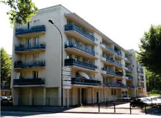
1 Photo Cité Daste Avant Travaux (© Architecte Benoit Chanson)

Ce sujet m'a surtout intéressé après la visite du quartier Empalot à Toulouse, où je me suis retrouvé face à deux approches différentes de réhabilitation de bâtiments existants faites par le même architecte.