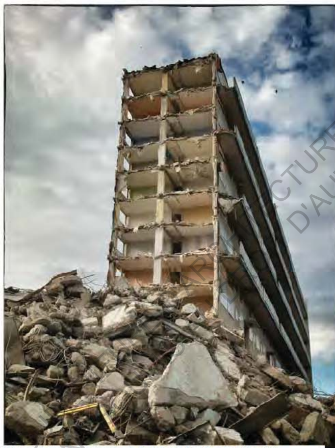
5 Démolition d'une barre à Empalot

C'est dans ce contexte que la réhabilitation joue un rôle fondamental : selon l'Union Sociale pour l'Habitat une opération de réhabilitation nécessite 8 à 10 fois moins de frais qu'une démolition pour une construction neuve.