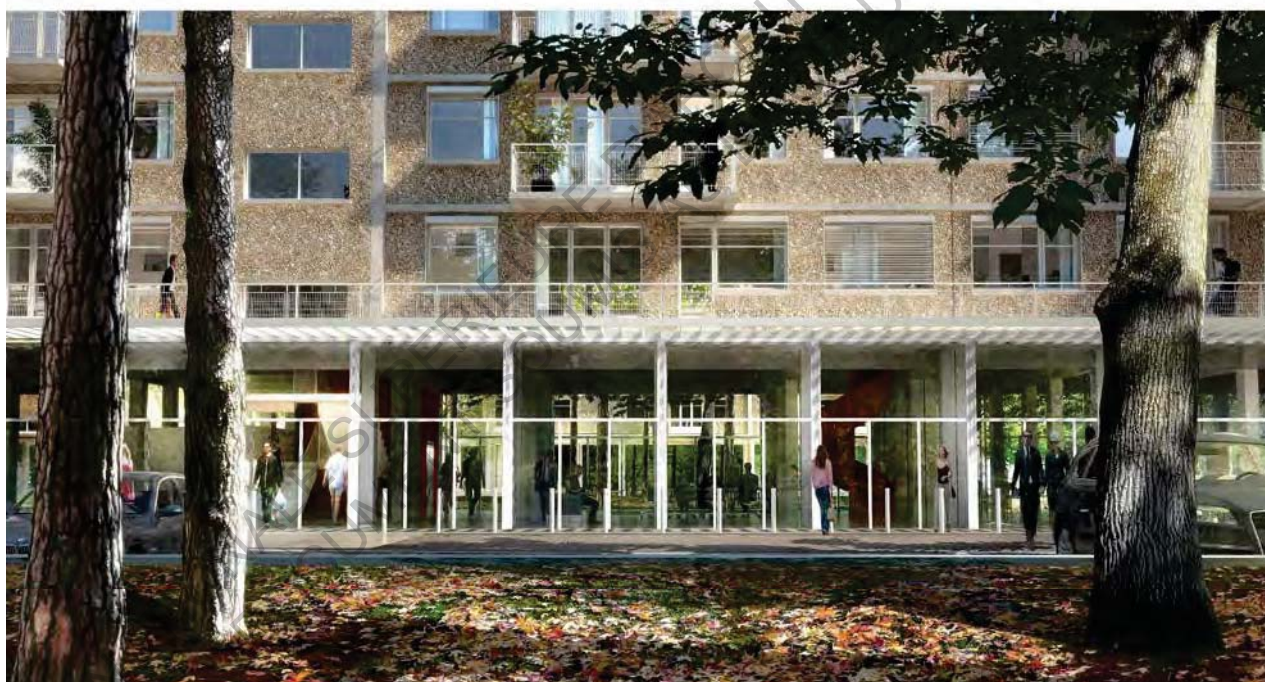
13 Avant et après la réhabilitation (© Eliet & Lehman Architectes)

À l'extérieur des bâtiments, l'intervention est visible seulement aux RDC des deux bâtiments où ont été prévues des commerces de proximité et des bureaux, en remplaçant les anciennes places de stationnement, qui sont réintégrés avec un parking souterrain. Pour garder la transparence des rez-de-chaussée, initialement en pilotis, les commerces et les bureaux prévus sont fermés par des parois vitrées. L'installation des pare-soleils horizontaux permet de protéger les locaux à niveau de la rue et crée une césure entre le neuf et l'ancien.