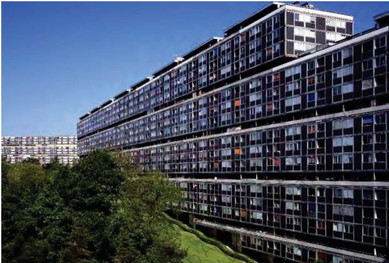
9 La Cité du Lignon

Franz Graf, architecte et professeur associé de l'École Polytechnique Fédérale de Lausanne, dirige le Laboratoire des Techniques et de la Sauvegarde de l'Architecture Moderne (TSAM) depuis 2007.