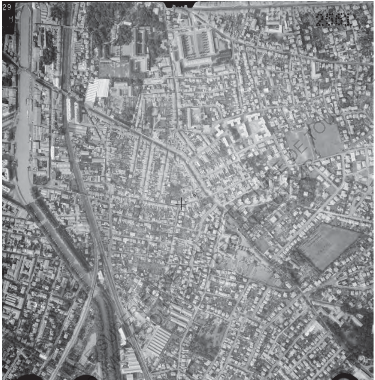
20 Photo aérienne du 9 Septembre 1958

Suite à la non acquisition des terrains mitoyens, le projet réalisé comprendra seulement 12 immeubles comprenant un total des 350 logements, dont 126 F2, 149 F3, 60 F4, 15 F5 et avec annexe à la cité, une chaufferie et des locaux commerciaux.