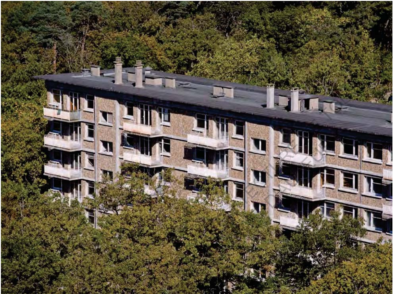
12 Shape Village à la Faisanderie

Gagnante du Prix d'architecture de l'Équerre d'argent en 2015, cette réhabilitation arrive à développer une mixité résidentielle et fonctionnelle tout en préservant la qualité architecturale de l'œuvre de Marcel Lods.