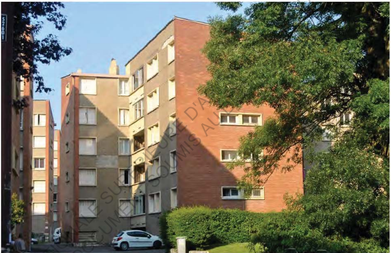
22 Photo Belle Paule

Pour l'architecte Valle, il est important d'éviter l'effet de masse produit par les Grands Ensembles, qui pourrait interférer avec le contexte pavillonnaire. Pour faire cela il cherche toujours à être cohérent avec le principe de l'îlot urbain, transposition de l'îlot traditionnel dans lequel un pavillon constituant un seul logement donne sur la rue.