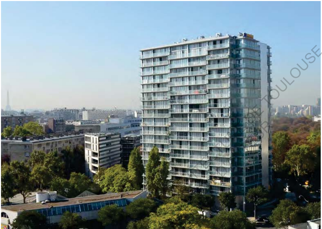
11 Tour Bois-le-Prête Après Réhabilitation

Une des premières réhabilitations françaises à avoir beaucoup de succès est sans doute celle faite par l'équipe formée par les architectes Druot, Lacaton et Vassal, gagnant le Prix d'architecture de l'Équerre d'argent en 2011.