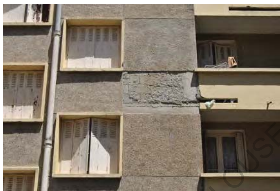
25 Photo fissures mignonnette Belle Paule

Avec des interventions qui ont été donc, rares et non homogènes, un des problèmes principaux présent aujourd'hui est lié aux infiltrations dans le revêtement en mignonnette des façades, qui ont produit la plupart des fissures, des moisissures et de l'humidité ou, dans le pire des cas, un décollement de parties entières des parements.