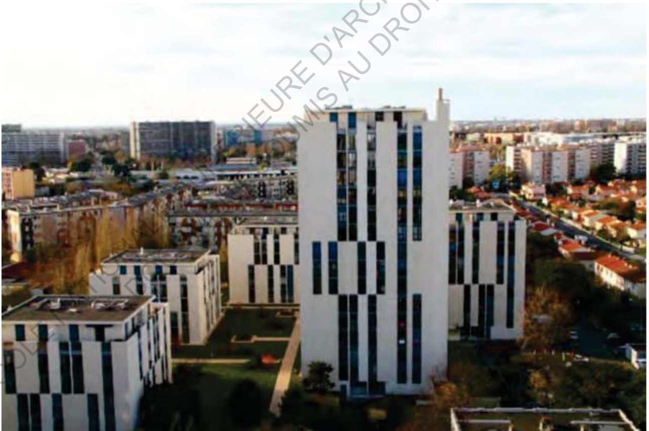
6 Les tours de Seysses, Bagatelle

Je me suis donc questionné : jusqu'où peut-on transformer l'existant ?