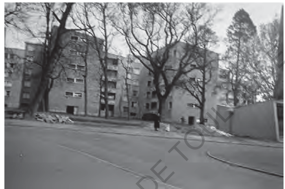
14 Images d'époque trouvés sur internet

À l'époque de sa conception, pendant la période des Trente Glorieuses à Toulouse, reconstruire c'est surtout construire. La ville rose a subi très peu de dégâts pendant les guerres : on ne compte qu'environ 500 bâtiments touchés dont 150 totalement détruits. Cependant, des nombreux logements étaient surpeuplés et/ou insalubres : à la fin de la deuxième guerre leur chiffre avait triplé, arrivant à 81000 logements.