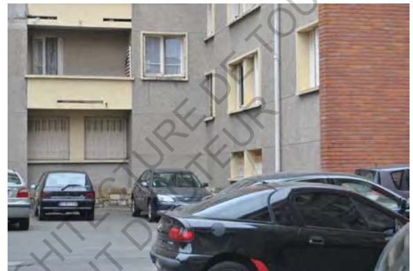
24 Photo Belle Paule

À ce problème d'espace, il faut ajouter la question des poubelles privées de la cité qui a un impact sur l'encombrement des espaces « publics », en augmentant cette perte d'urbanité tout au cœur de la cité.