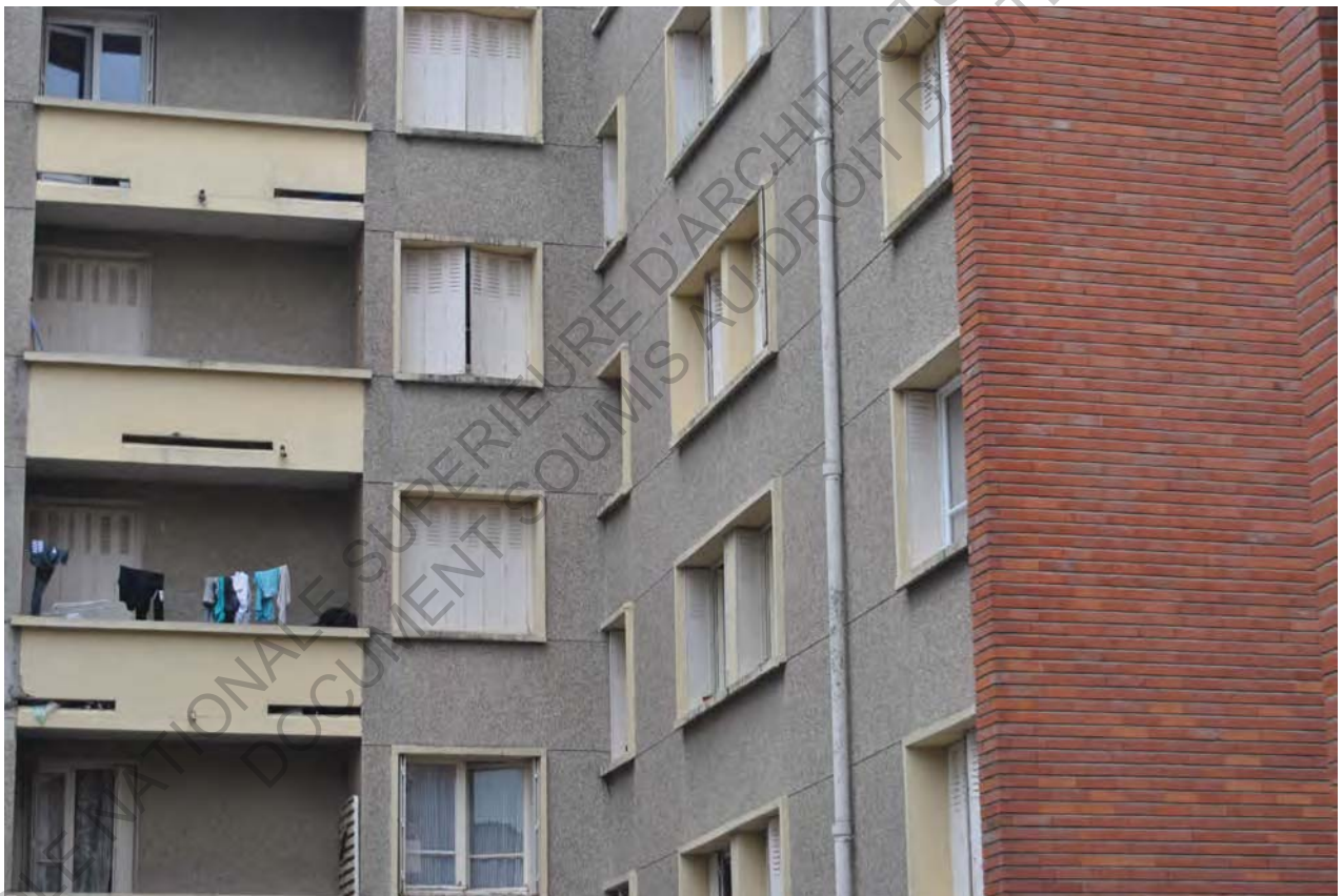
18 Photo Belle Paule 2017

Afin de conserver une unité architecturale à l'ensemble de la Belle Paule, l'architecte utilisera un même langage architectural pour tous les bâtiments, qui contribue à marquer le projet avec de son empreinte.