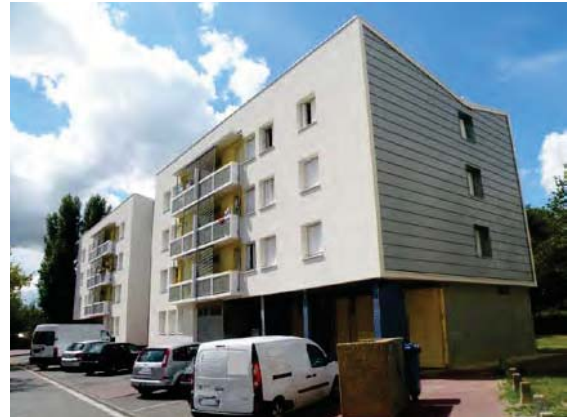
2 Photo Cité Albatros Avant Travaux (© Architecte Benoit Chanson)

Dans le même quartier, le même architecte est intervenu aussi sur la cité Albatros, ici avec une réhabilitation thermique par extérieur qui vient se superposer à la façade existante. Initialement le premier projet de réhabilitation de la cité Daste prévoyait aussi une isolation par extérieur mais c'est « grâce » à l'intervention de l'architecte des Bâtiments de France que l'unité globale de l'œuvre a été préservée.