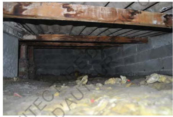
27 Photo isolation toiture bâtiment 14, Rue Chemin Coin de la Moure

Les combles des bâtiments ont été isolés mais avec une isolation qui aujourd'hui demeure ancienne et peu performante en termes de réglementation, sans compter les parties sous les escaliers des divers immeubles que restent encore couvertes seulement par une tôle transparente en plastique et au sujet de laquelle l'audit ne traite pas. La même toiture, aussi, composée en fibrociment devra comporter des interventions pour la substituer.