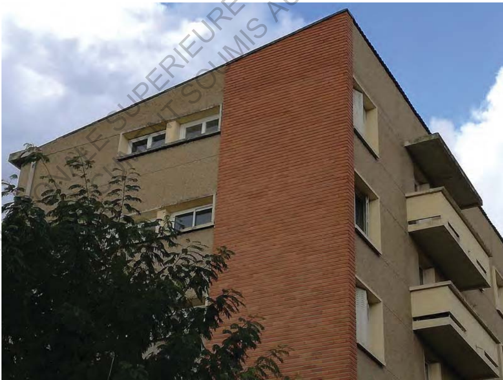
7 Belle Paule

Cette authenticité propre de l'œuvre pourra un de ces jours être mise en danger si on ne lui donne pas assez d'importance au moment d'une réhabilitation énergétique.