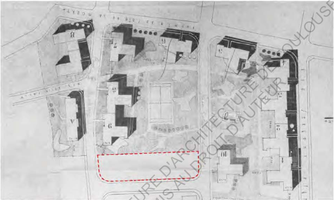
19 Permis de construire 1953

Dans son deuxième projet, l'architecte Valle, propose 10 immeubles identiques et 2 immeubles de formes différentes. Les 10 immeubles identiques sont positionnés en bord de voies en délimitant de façon discontinue un grand vide central à la manière d'un grand ilot.