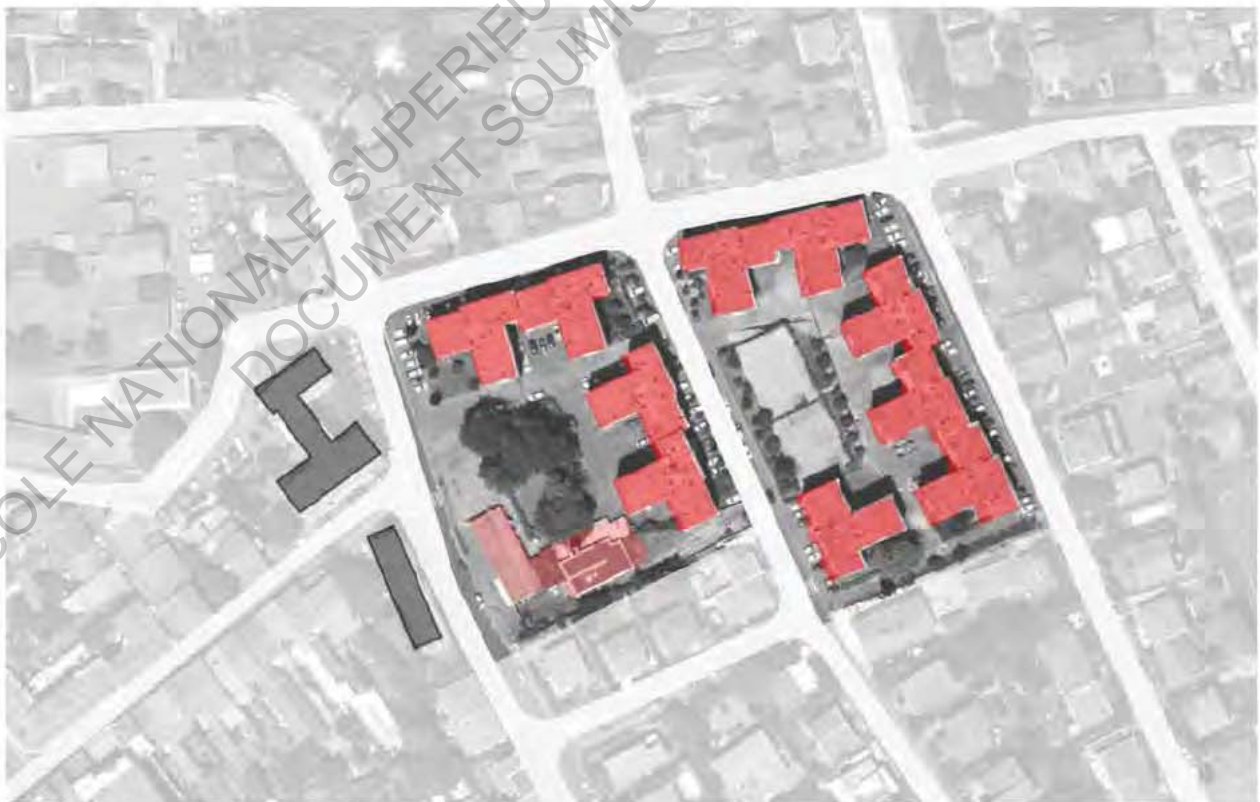
21Photo aérienne 2014

On peut noter aussi que l'architecte Valle décidera de changer la composition des bandes afin de remettre à l'échelle les ilots avec des bandes décalées formées par deux immeubles seulement, une seule bande avec trois immeubles et un seul immeuble reste « isolé » Pour les parcelles plus à l'Ouest rien ne change par rapport au deuxième projet avec les deux immeubles singuliers.