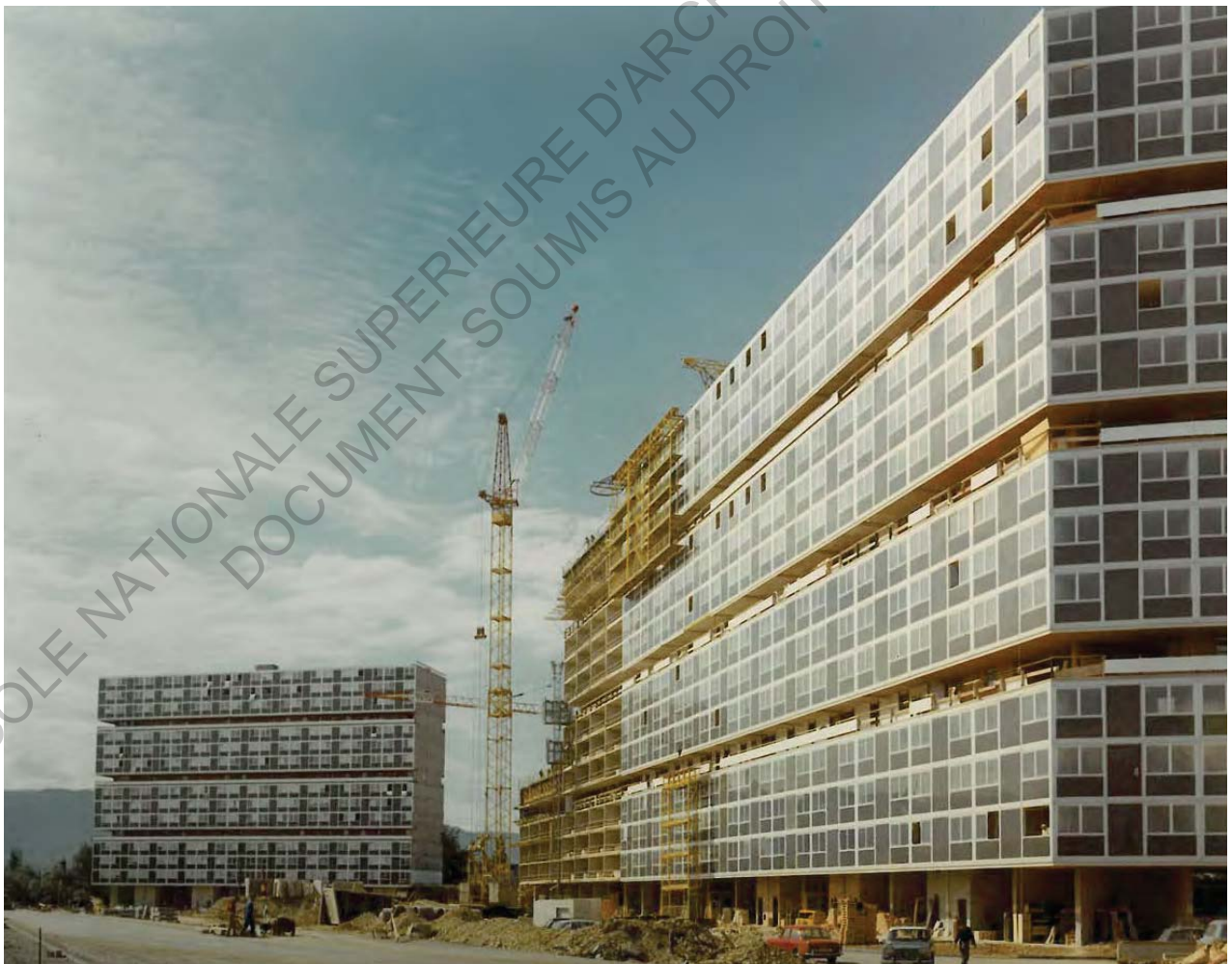
10 Le Lignon en construction (Image du livre "La Cité du Lignon")

L'étude de la cité du Lignon a commencé avec une analyse de la documentation historique du projet d'origine à l'échelle de l'ensemble, avec une attention particulière aux aspects constructifs et matériels. Parallèlement, après avoir choisi un bâtiment type sur lequel mener l'enquête, un travail de relevés détaillés à diverses échelles (de 1/50 e jusqu'à 1/5 e ) a permis de rentrer à contact direct avec l'objet d'étude.