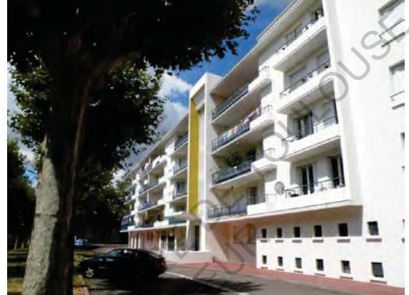
1 Photo Cité Daste Après Travaux (© Architecte Benoit Chanson)

La première intervention, faite par l'architecte Benoit Chanson sur la cité Daste, concerne une réhabilitation thermique par intérieur avec un changement de la couleur d'enduit et des éléments de second œuvre, la disparition du carroyage d'origine mais pas d'altération de l'unité globale.