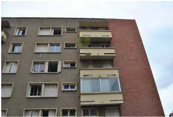
26 Photo fermeture d'une loggia et changement menuiserie

Depuis sa construction, la résidence a connu peu de travaux aussi en termes d'isolation thermique. Grâce à l'étude de l'audit et du travail fait pendant l'étude faite directement sur la Belle Paule on compte environ 60% des fenêtres qui ont été remplacées par des doubles vitrages directement par les propriétaires. Certains résidents ont posé aussi des menuiseries en aluminium pour la fermeture des loggias.