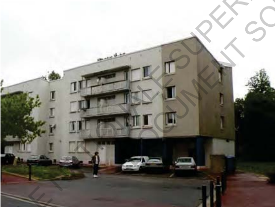
3 Photo Cité Albatros Avant Travaux (© Architecte Benoit Chanson)

La première intervention, faite par l'architecte Benoit Chanson sur la cité Daste, concerne une réhabilitation thermique par intérieur avec un changement de la couleur d'enduit et des éléments de second œuvre, la disparition du carroyage d'origine mais pas d'altération de l'unité globale.