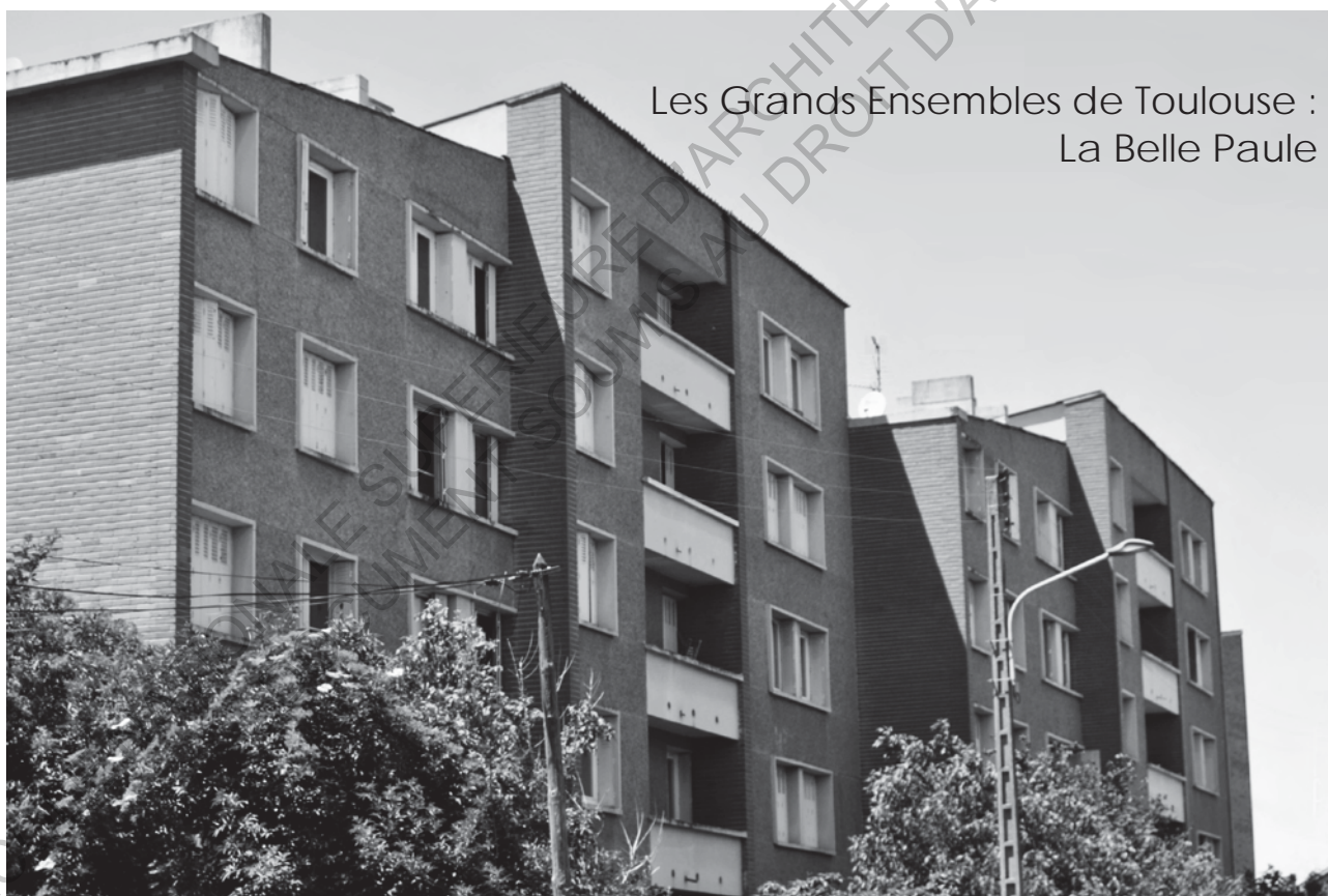
Les Grands Ensembles de Toulouse : La Belle Paule