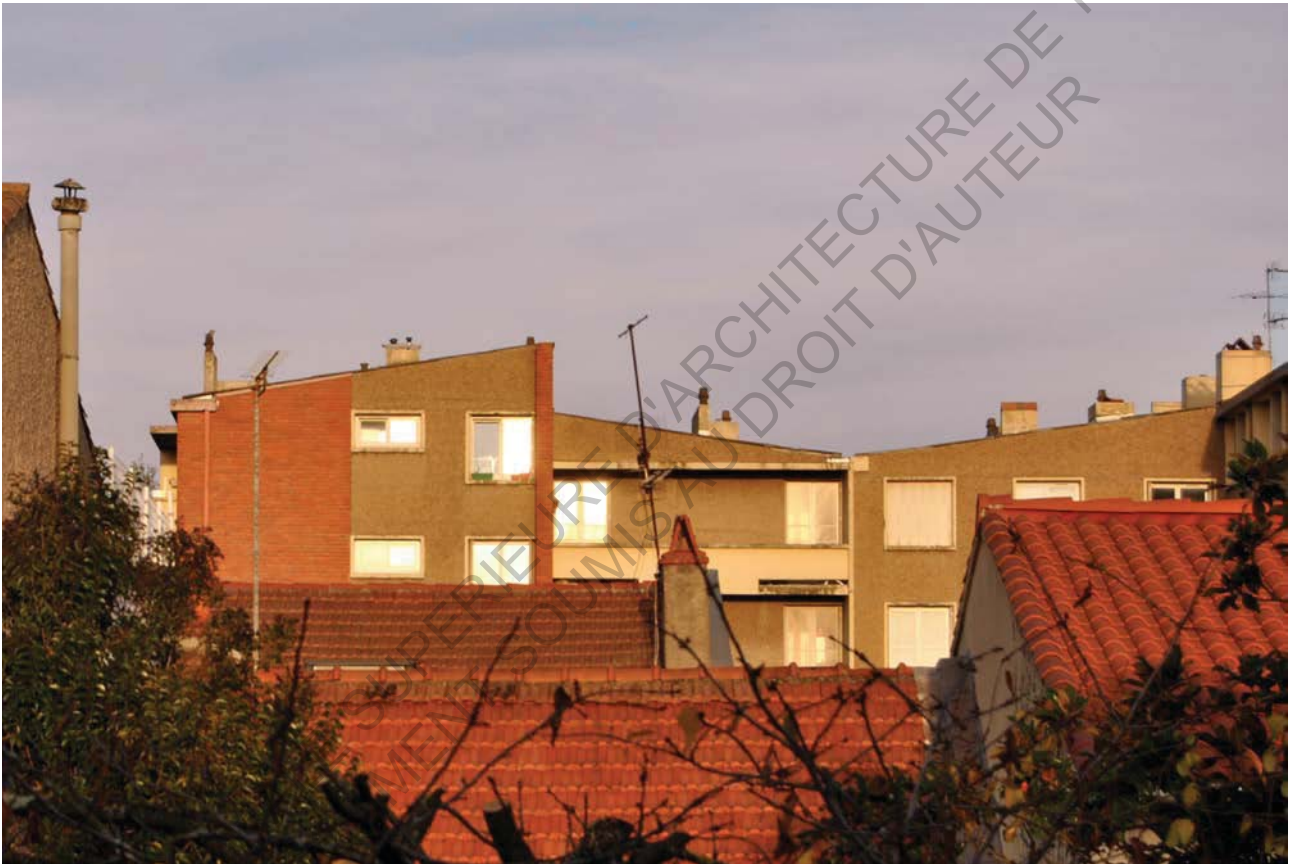
4 Photo depuis ma chambre louée pendant l'année 2016/2017