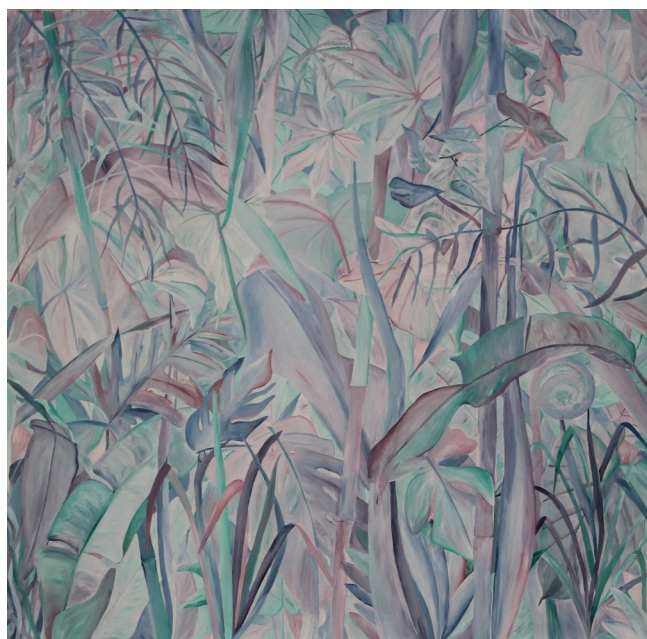
Composition 2 , série « Là-bas », 2017, acrylique sur toile, 160 x 160 cm