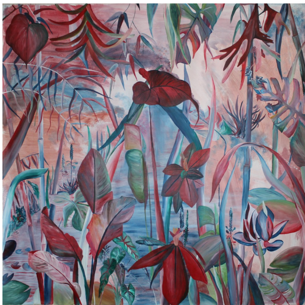
Composition 3 , série « Là-bas », 2017-2018, acrylique sur toile, 160 x 160 cm (travail en cours)

On peut noter quelques paramètres constants de mon travail. Tout d'abord, chacune de mes peintures, chacun de mes dessins est en format carré. Ce dernier est une forme mathématique permettant des compositions géométriques et centrées, et ne donnant aucun sens de lecture au tableau du fait de sa régularité. Il produit donc des effets visuels particuliers : c'est une forme imposante, stricte. Le carré permet d'accentuer l'équilibre et la stabilité de la composition qui est elle-même organisée par la structure du carré. Seul l'agencement des végétaux influence la perception de la toile, et non le format, qui lui, ne donne aucune dynamique, contrairement à un format rectangulaire. On peut observer comme autres paramètres, un effet de cadrage qui donne un aspect statique et frontal et un travail de saturation par les végétaux. On voit des plantes derrière des plantes, ce qui laisse imaginer que derrière ces plantes, il y a encore des plantes. Le milieu est dense, hétéroclite, oppressant, et la saturation amplifie l'effet d'exotisme. On est face à une sorte de barrière végétale. De plus, les végétaux sont représentés à des échelles extrêmement diverses.