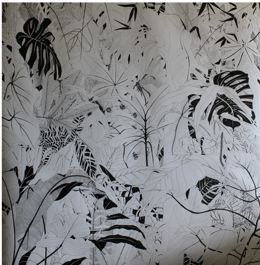
Composition 4 , série « Là-bas », 2017-2018, encre de chine sur papier, 150 x 150 cm (travail en cours)

Dans le travail en noir et blanc, je rends compte des effets visuels que peuvent produire des dessins à l'encre de chine, notamment par des traits qui sont plus définis qu'en peinture, et par les contrastes de noir et blanc. Il est en effet plus difficile de distinguer chaque végétal bien que le dessin soit précis : c'est la technique employée qui modifie la perception des végétaux et de la composition.