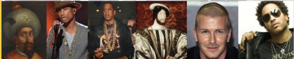
Mehmet II, sultan | Pharell Williams, chanteur | Jay Z, rappeur | François II, roi de France | David Beckham, footballeur | Lenny Kravitz, chanteur

Les garçons peuvent-ils porter des robes ?