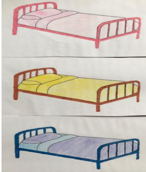
2- Les lits