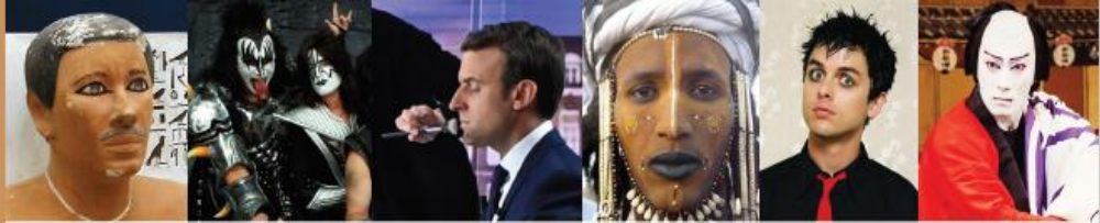
Rahotep, prince égyptien Kiss, groupe de rock Emmanuel Macron, président Homme wodaabe Billie Joe Armstrong, chanteur Ichikawa Ebizô, acteur de kabuki.

Les garçons peuvent-ils mettre du vernis ?