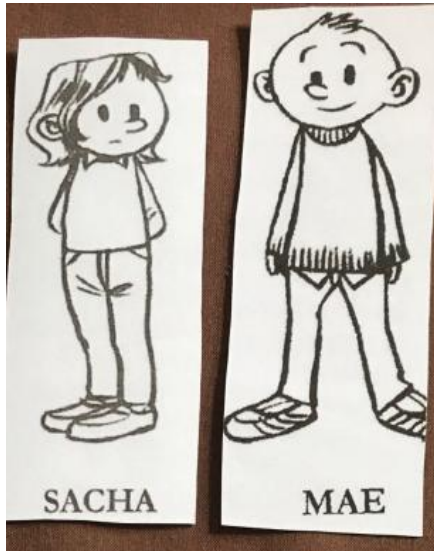
1- Les Personnages