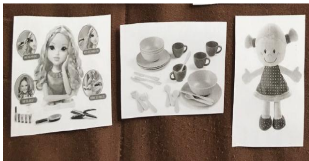
4- Jeux stéréotypés féminins