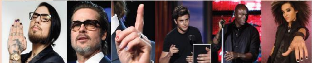
Dave Navarro, guitariste Brad Pitt, acteur Zach Efron, acteur/chanteur Seal, chanteur Bill Kaulitz, chanteur

Les garçons peuvent-ils porter des bijoux ?