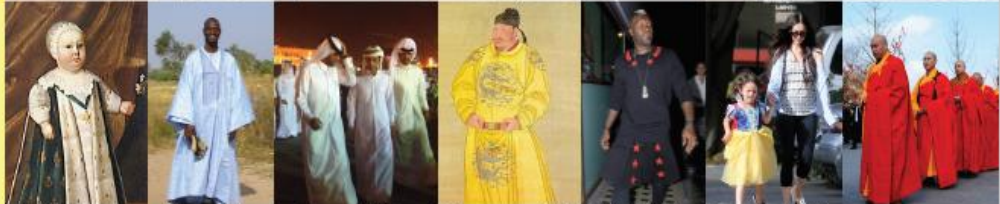
Louis XIV, roi de France Homme en boubou Hommes en dishdasha Taizong, empereur chinois Djibril Cissé, footballeur Noah Green, enfant de stars Prêtres bouddhistes