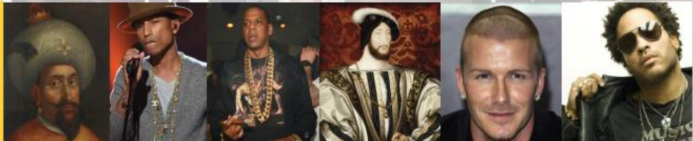
Mehmet II, sultan Phareel Williams, chanteur Jay Z, rappeur François II, roi de France David Beckham, footballeur Lenny Kravitz, chanteur

Les garçons peuvent-ils porter des robes ?