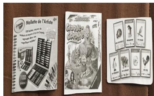
5- Jeux neutres