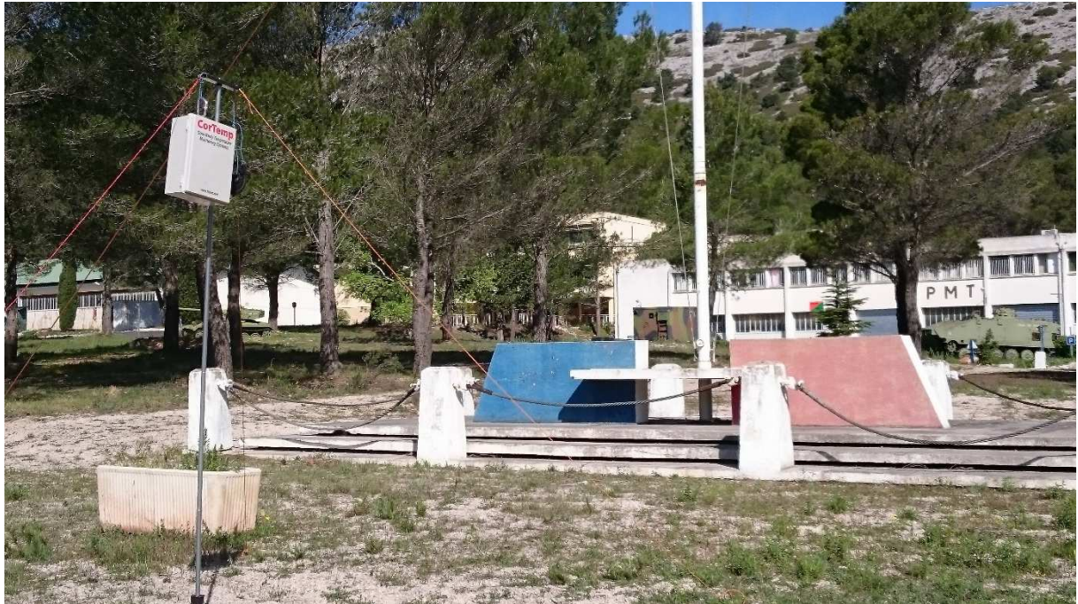
Installation de la borne de réception des données des capsules ingérées (CoreTemp HQ Inc., Palmetto, Florida).