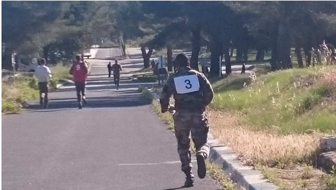
Déroulement de la marche course.