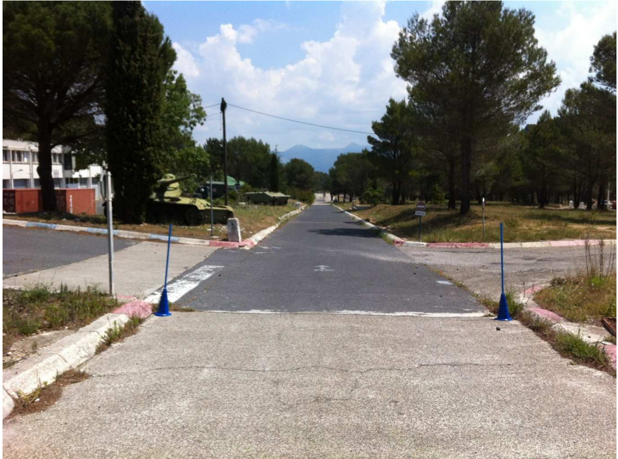
Ligne d'arrivée de la marche course.