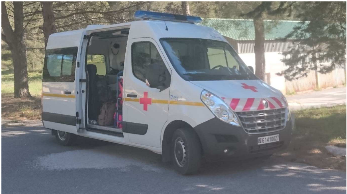
Véhicule de soutien sanitaire.