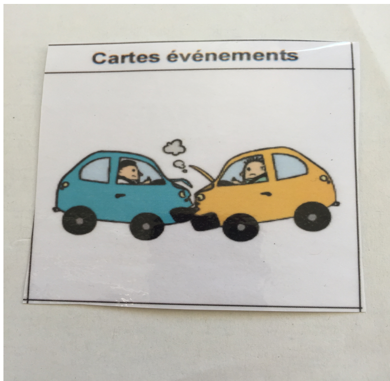
L'image choisie par Sabin