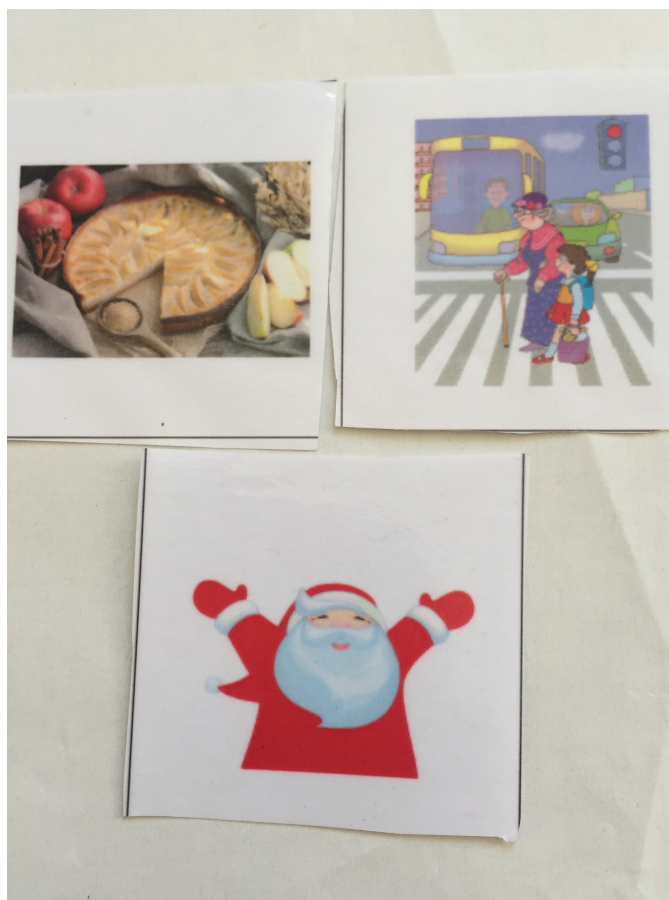
Les trois images choisies par Sabin pour inventer son histoire et le texte de l'histoire inventée

Le père Noël mange une galette aux pommes dans sa maison. Il sort de chez lui. Il va prendre son traineau avec ses rennes. Ils se sont envolés et le père Noël passe dans la cheminée. Une petite fille traverse la rue et rentre chez elle. Elle mange puis elle va dormir. Elle dort longtemps. Et quand sa grand-mère la réveille en disant chérie, le papa Noël est passé, elle descend l'escalier. Elle mange et après elle ouvre les cadeaux.