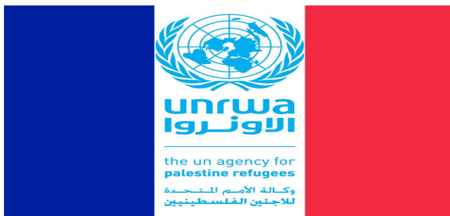
Drapeau Français avec le logo de l'UNRWA.