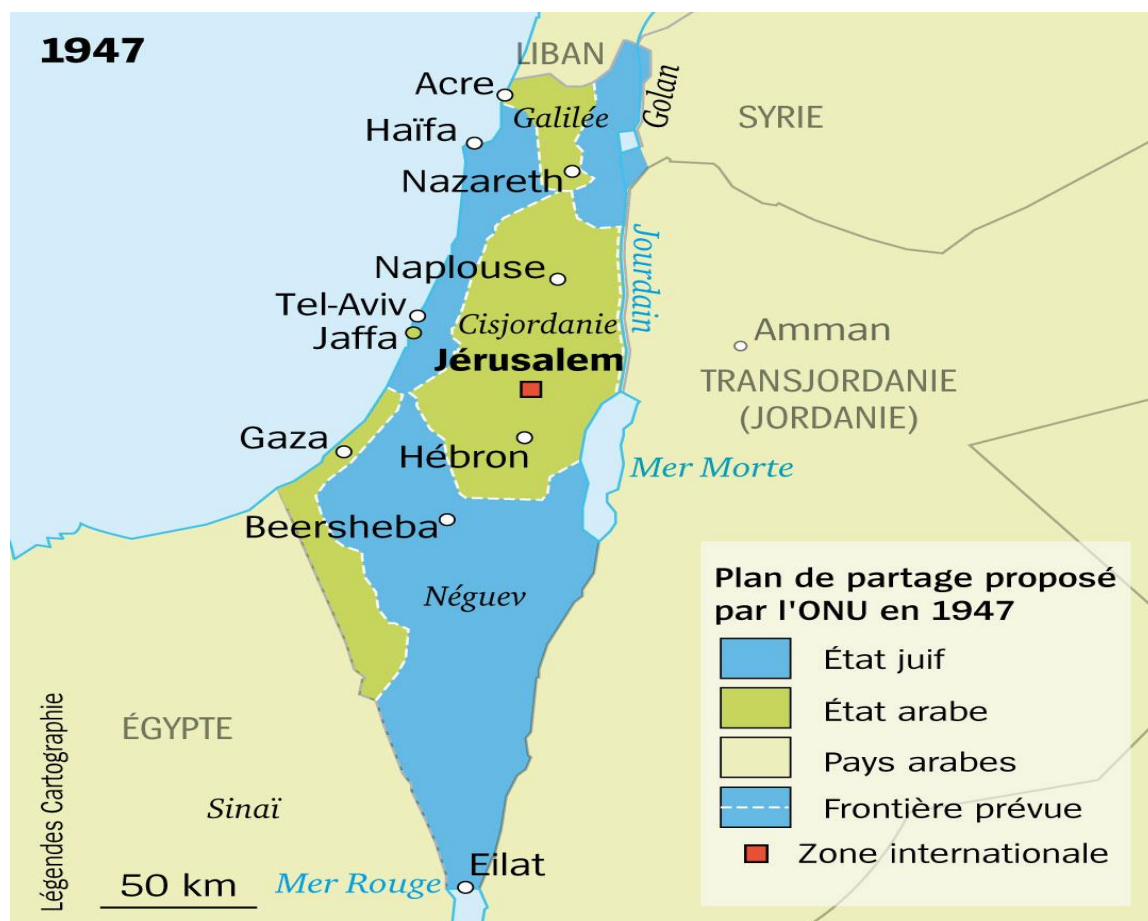
Plan de partage de la Palestine voté par l'ONU en 1947