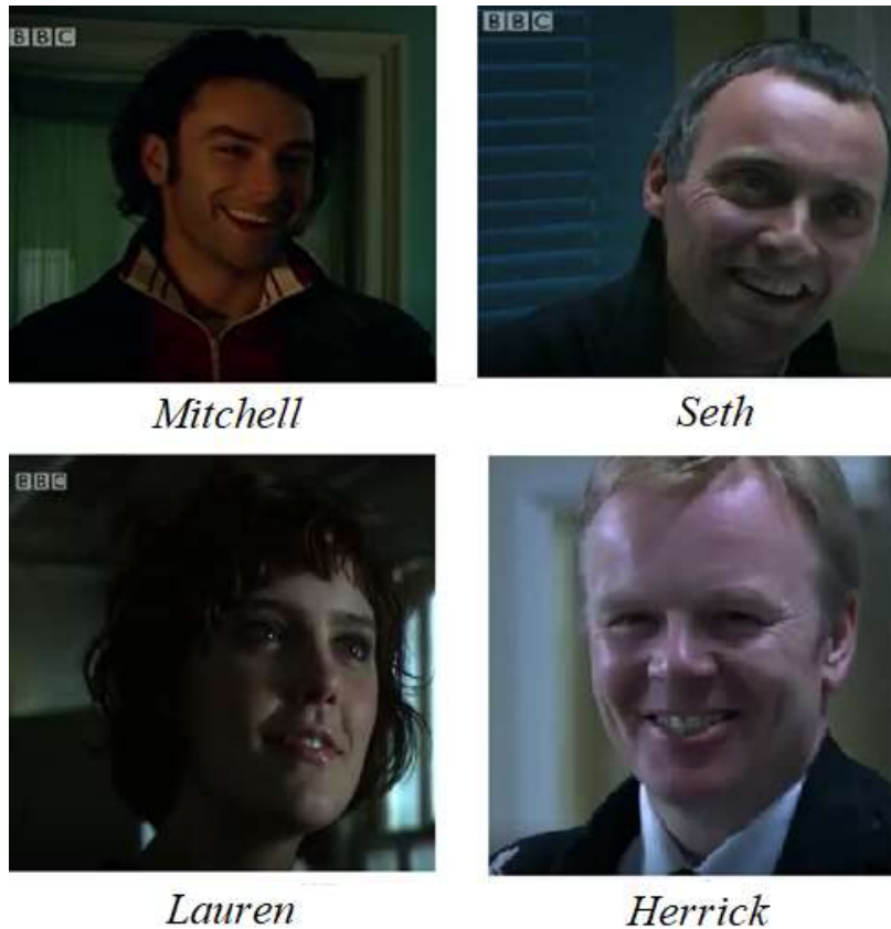
Figure 3 : Premières apparitions des vampires dans l'épisode pilote de Being Human .

L'objectif du gros plan au cinéma est d'indiquer les émotions d'un personnage afin de favoriser son identification ou son rejet. Pour les vampires, la caméra attire donc l'œil du spectateur sur seulement une partie du corps qui est sans doute la plus importante : la bouche. Le sourire a ici deux fonctions : la première est de mettre en confiance l'interlocuteur, comme le montre Herrick alors qu'il interagit avec une infirmière. La deuxième fonction est extradiégétique car elle concerne les spectateurs : en attirant l'attention sur le sourire du personnage, on annonce que celui-ci n'est pas humain et qu'il représente un danger. Cette bouche tentatrice agit donc comme un appât : un nouvel outil monstrueux servant à leurrer les proies, alors attirées sexuellement par le vampire qui pourra ainsi plus facilement se repaître de sang. Dans ce contexte, il est plus facile de comprendre l'impossibilité pour Mitchell d'allier le sexe aux sentiments, dans la mesure où le sexe est intrinsèquement lié à la chasse. Le toucher intime, comme le baiser, est à