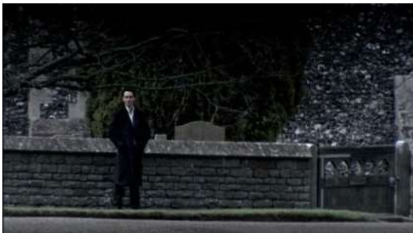
Figure 5 : Plan moyen d'Azazel.

Le médium utilisé dans ce panorama est assez sombre, tout comme les habits que portent Azazel, si bien qu'il se fond presque dans le décor. Nous pourrions qualifier ce panorama de tableau sublime tant il mêle la beauté et l'étrange, la douleur et l'extase : la nature, bien que mourante, est mise en avant tandis que le corps humain – du moins, en apparence – est relégué à l'arrière-plan. Ce n'est qu'une fois que la caméra se rapproche du personnage qu'on le discerne réellement pour la première fois, mais sans pour autant avoir la possibilité de voir clairement son visage.