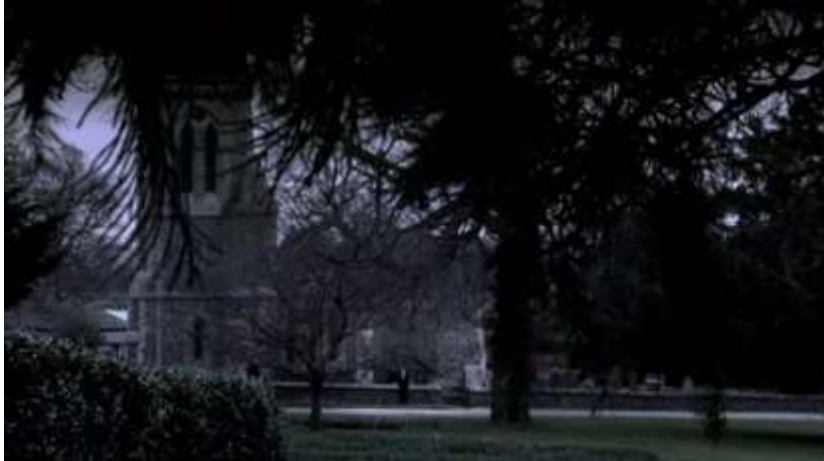
Figure 4 : Azazel au centre du tableau, comme englouti par la nature.

Le médium utilisé dans ce panorama est assez sombre, tout comme les habits que portent Azazel, si bien qu'il se fond presque dans le décor. Nous pourrions qualifier ce panorama de tableau sublime tant il mêle la beauté et l'étrange, la douleur et l'extase : la nature, bien que mourante, est mise en avant tandis que le corps humain – du moins, en apparence – est relégué à l'arrière-plan. Ce n'est qu'une fois que la caméra se rapproche du personnage qu'on le discerne réellement pour la première fois, mais sans pour autant avoir la possibilité de voir clairement son visage.