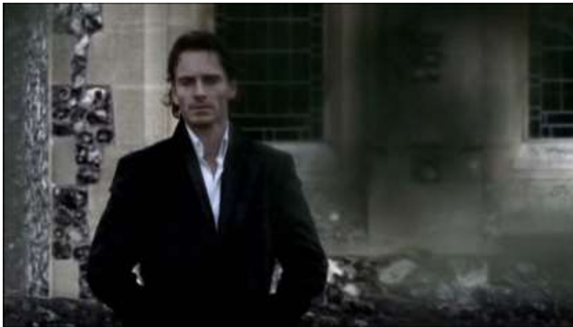
Figure 6 : Focalisation sur les traits d'Azazel.

Enfin, après un gros plan sur le visage de Cassie, l'héroïne de la série, la caméra revient sur Azazel une dernière fois, sous la forme d'un plan rapproché taille. Ces actions sont courtes – dix secondes au total pour la scène – mais assez répétitives pour attiser la curiosité du spectateur ; curiosité qui reflète ici celle de Cassie. Aucun mot n'est échangé, le spectateur s'en réfère donc à ses sens, en l'occurrence ici, la vue, pour juger le personnage.