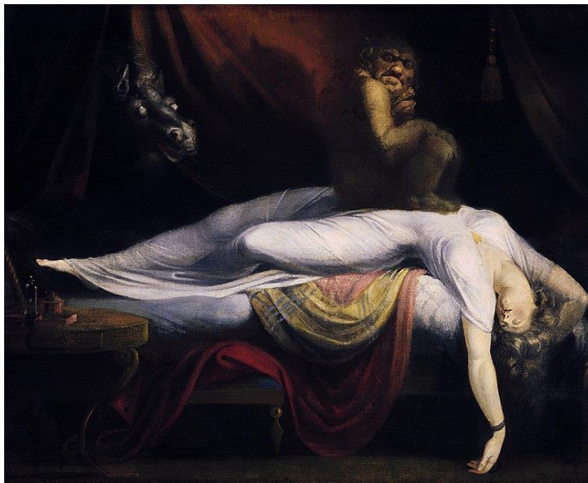
Tableau 1 Fuseli, Henry. The Nightmare . Huile sur toile, 121 x 147.3 cm, Detroit Institute of Arts, 1782.

donner un sens à tous les phénomènes inexplicables à l'époque. Le mythe de la sorcière n'était qu'une réaction défensive, immunitaire, de l'esprit qui essayait de rationaliser les événements néfastes comme la mort, la malchance, les intempéries ou les mauvaises récoltes. Durand explique qu'il s'agit d'un « principe constitutif de l'imagination 52 », lorsque l'on se représente ou symbolise un mal, un danger ou une angoisse « c'est déjà par la maîtrise du cogito, les dominer 53 ». Il est vrai que l'on a tendance à se servir de notre imaginaire pour rationaliser les choses inexplicables qui peuvent se produire autour de nous. Un mécanisme qui est de nos jours scientifiquement prouvé sur le plan neurologique au niveau inconscient. 54 Par exemple, le cerveau crée lui-même une explication rationnelle lors d'une paralysie du sommeil, comme préfiguré dans le tableau d'Henry Fuseli, Nightmare .