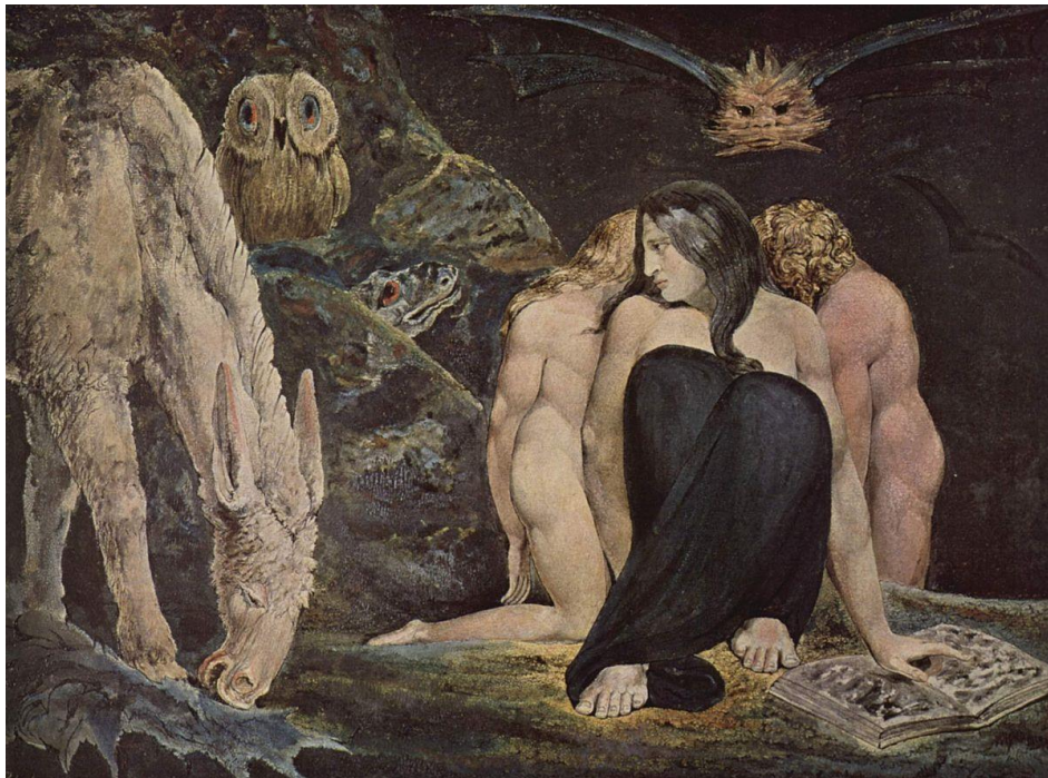
Tableau 4 Figure 2 William Blake. The Night of Enitharmon's Joy . Encre et peinture à l'eau sur papier 44 cm x 58 cm, Tate Gallery, Londres, 1785.

femmes sont prédisposées à céder au diable 74 . Le sexe féminin tout entier est réduit à une créature incapable de réfléchir et dont l'instinct animal exacerbe la sexualité. On retrouve son animalité chez Blake dans The Night of Enitharmon's Joy (aussi appelé ' The Triple Hecate ') qui montre Hécate entourée d'animaux, comme si sa place était parmi eux. Dans le tableau, elle pose toutefois sa main sur un livre, ce qui peut être interprété comme un lien avec l'art de l'écriture. Une idée qui est présente dans son poème The Tyger (1794), qui explore l'acte de création. Dans le premier vers (« Tyger Tyger, burning bright, / In the forests of the night 75 »), Blake mentionne l'habitat d'Hécate (« the forests »), tout comme son animalité (à travers l'image du tigre), ainsi le poème fait peut-être référence aux pouvoirs de création des sorcières.