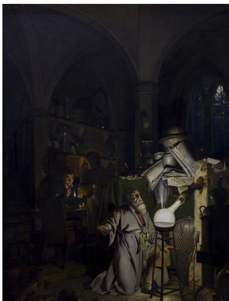
Tableau 5 Joseph Wright of Derby. The Alchemist, In Search of the Philosopher's Stone . Huile sur toile. Derby Museum and Art Gallery, Derby, 1771.

Cette idée de fusion alchimique est aussi présente dans la poésie de Coleridge. Il apparente cette fusion à un miracle (« miracle of rare device 84 ») dans Kubla Khan parce qu'il réussit à fusionner la lumière et l'ombre : « the shadow of the dome of pleasure 85 » et « that sunny dome 86 » qui se transforment en un endroit hybride : « A sunny pleasure-dome with caves of ice! 87 ». Cette unité, représentée par le dôme, un cercle rappelant la notion de perfection, est particulièrement difficile à atteindre.