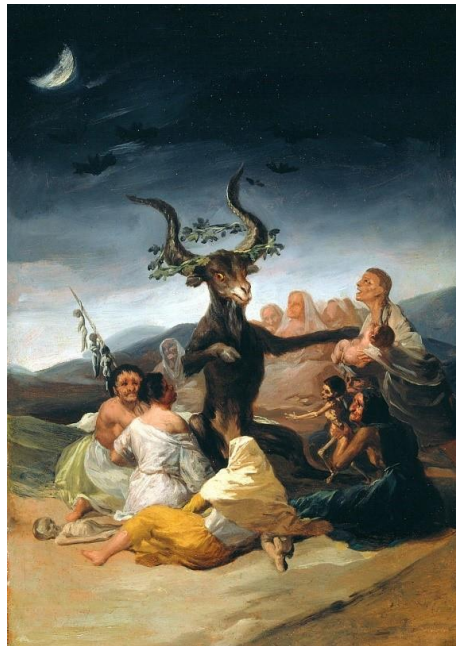
Tableau 2 De Goya, Francisco. Le sabbat des sorcières . Huile sur toile, 43 x 30 cm, Madrid, Musée Lázaro Galdiano, 1797.

reste du continent européen, comme en Espagne, par exemple 60 . Francisco de Goya a de fait peint plusieurs tableaux représentant ce rituel, car il fait partie des racines du mythe de la sorcière en Espagne, ce qui n'est pas le cas pour l'Angleterre. Bien que factice, ce rituel s'est facilement implanté dans les conceptions populaires, car il était pragmatique pour les villageois d'imaginer leurs bourreaux se réunir. C'est pour cette raison qu'il arrivait souvent de voir plusieurs femmes de la même communauté, accusées de sorcellerie.