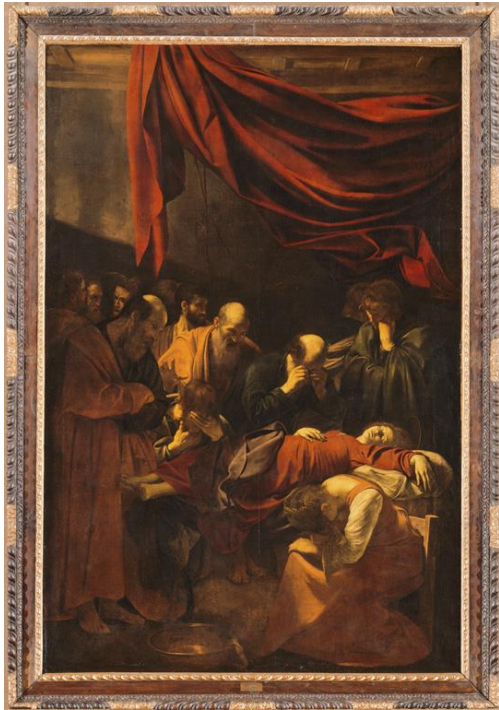
Michelangelo Merisi dit le Caravage La mort de la vierge , 1605-1606, Musée du Louvre, Inv. 54

La mort de la vierge , qui lui a été commandée en 1601, est illustrative de sa méthode. Elle est destinée à servir une chapelle de l'église Santa Maria Della Scala in Trastevere de Rome. Elle a été réalisée entre 1605 et 1606, quatre ans avant sa mort. Elle a été livrée et exposée peu de temps. Objet de scandale pour non-conformité avec les principes de moralité, elle a été refusée a posteriori, et remplacée par une autre toile de contemporain le peintre Carlo Saraceni.