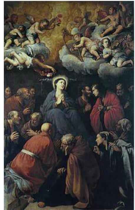
Carlo Saraceni, , La mort de la Vierge 1606 Église Santa Maria Della Scala in in Stratevere , Rome.

Cette œuvre du Caravage est symbolique des ruptures avec le traitement de scènes religieuses. L'artiste est en fin de carrière, dans ce tableau il semble que les options qu'il a prises ne sont plus des formes de rébellion, mais bien une pratique qu'il affirme. Notamment la disparation des anges, dont Stoïchita évoque la présence chez Caravage, lorsque celui-ci consent à se plier à l'exercice, il décide de l'apparence. Au sujet du Martyre de Saint Mathieu , (1599-1600), l'historien de l'art note :