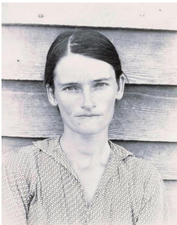
Walker Evans - 1936 Alabama, Femme de fermier

Dans l'exemple sur lequel nous appuyons nos dire, celui de l'expérience d'une rencontre esthétique à partir du travail d'Evans, le vocable de cinq syllabes a frappé les esprits, martelant de sa puissance la conscience ignorante de ce que les yeux recevaient. Qu'est-ce qui justifiait cette atteinte émotionnelle dans cette image ? Pourquoi particulièrement, cette image photographique de femme de maraîcher de l'Alabama, et non cette autre, migrante, photographiée elle aussi en 1936, pour les besoins documentaires dans le cadre de la même mission dans l'Alabama. Qu'est-ce qui dans les choix esthétiques artistiques des deux images, a créé objectivement le différent ?