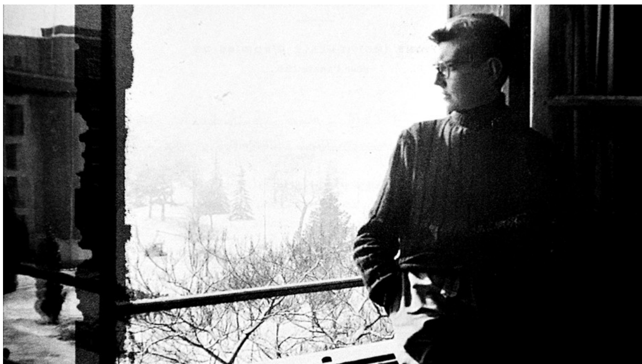
Julio Cortázar dans sa chambre en mars 1952.

un appartement proche de la Cité universitaire, « il y a des Argentins qui sont restés des années à la Cité universitaire et qui ne parlent pas le français » 322 .