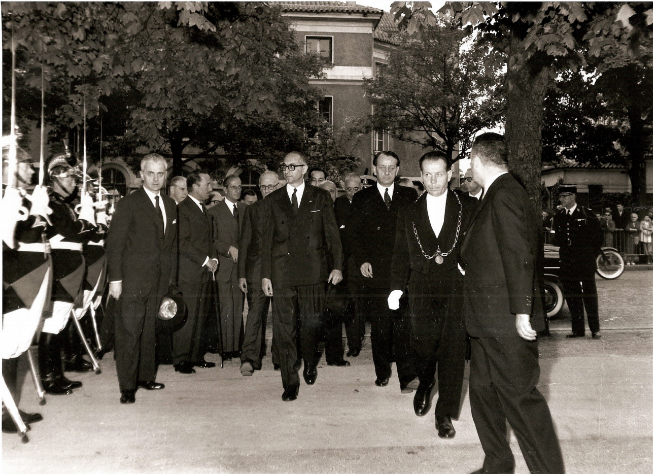
Arturo Frondizi et André Malraux sur le boulevard Jourdan, juin 1960.

Lors de cette visite, le président argentin est reçu par son homologue français, Charles de Gaulle 354 , quatre ans avant que ce dernier ne se rende lui-même à Buenos Aires et n'initie la construction du lycée franco-argentin Jean Mermoz 355 , l'un des rares résultats de son long voyage en Amérique latine en 1964 356 . Par ailleurs, Malraux s'était déjà rendu à Buenos Aires l'année précédente au cours également d'un voyage en Amérique latine au cours duquel il cherchait l'appui des États à la France à l'ONU sur les résolutions relatives à la guerre d'Algérie. Les relations n'étant pas bonnes avec l'Argentine, Malraux parvient à resserrer leurs liens et l'ambassadeur de France en Argentine est confiant après la visite quant au fait qu'elle ait permis d'obtenir le soutien de l'Argentine à l'ONU 357 . La visite de Frondizi à Paris l'année suivante semble aussi témoigner du succès de ce séjour, au moins à court-terme.