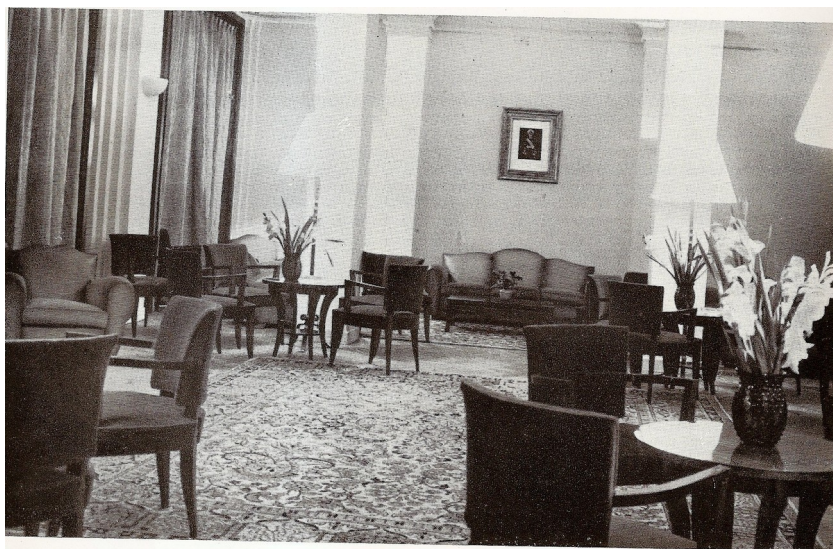
Le grand salon de la Maison dans les années 1930.

Le loyer de la Maison, de 300 francs par mois, est la moyenne de ceux pratiqués dans les résidences ouvertes en 1929 119 . En 1935, quarante places sur les soixante-quinze des deux bâtiments sont prévues pour loger des boursiers du gouvernement argentin 120 . En 1933, la Maison emploie également un personnel conséquent : en plus de Martinenche, deux concierges y travaillent ainsi que deux valets de chambre, des femmes de chambres, une cuisinière, une femme de service, un veilleur de nuit et un secrétaire 121 . On servait aussi tous les matins un petit-déjeuner aux résidents au rez-de-chaussée de la Maison 122 .