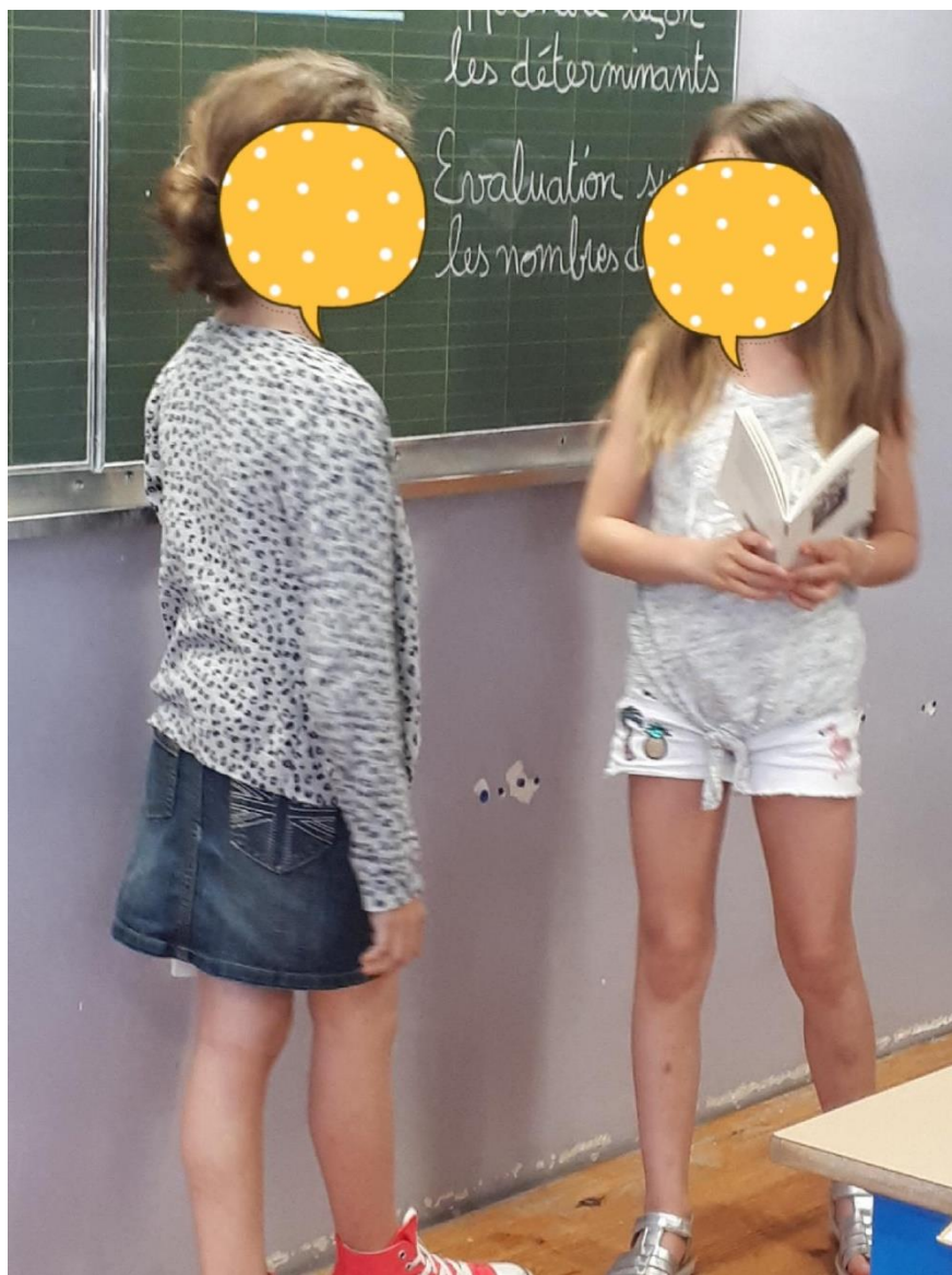
Annexe 2 : Photographies prises lors séances livres en main