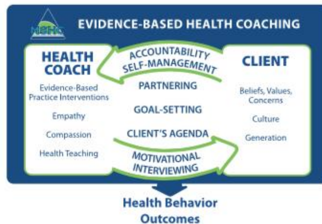
Figure 8 : Modèle clinique de coaching en santé

Source : Huffman, « Using motivational interviewing : through evidence-based health coaching », 2014