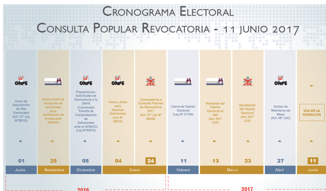
Figure 2 : Calendrier électoral du Pérou, consultation populaire sur la révocation du mandat 2017