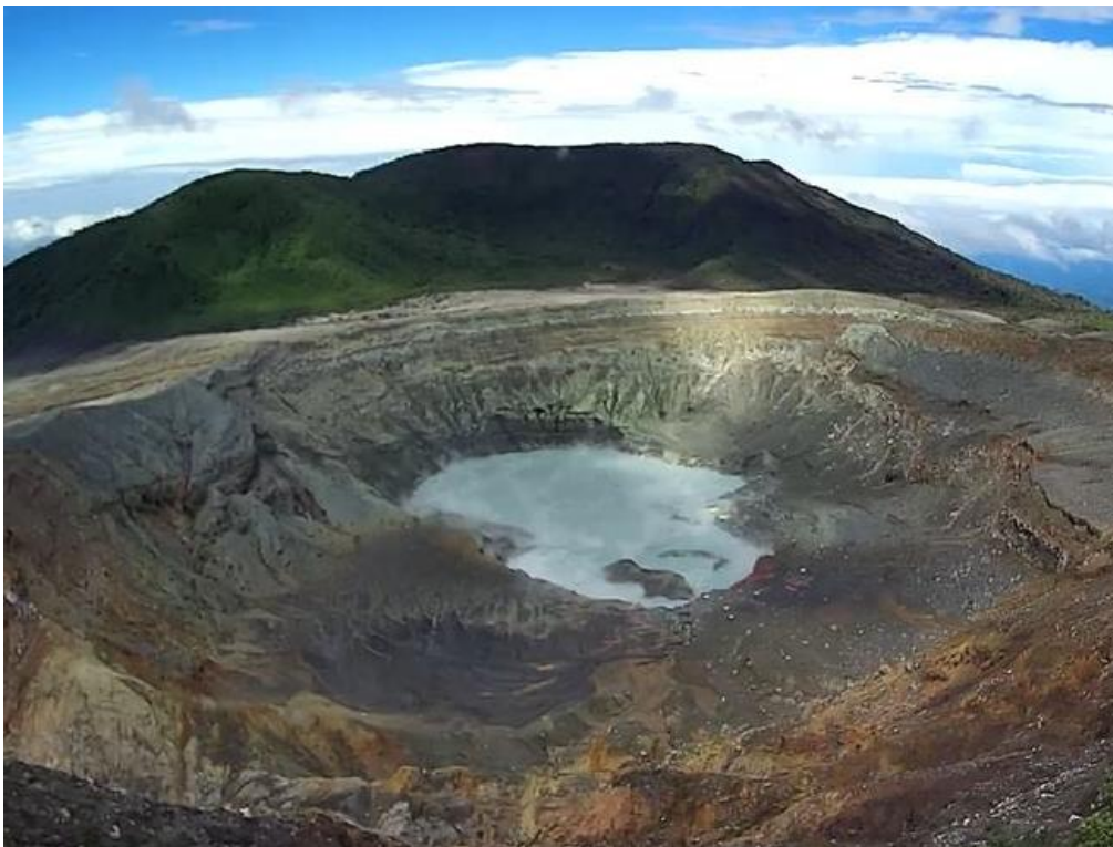
Lagune du cratère principal du Volcan Poás