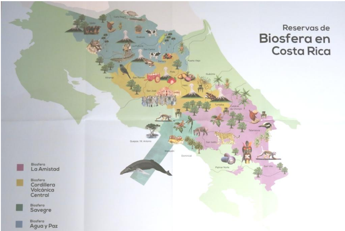
Réserves de biosphère de l'Unesco au Costa Rica.