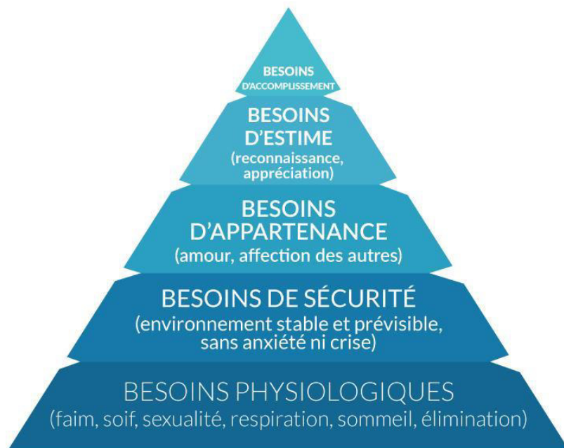
Figure 1 : La pyramide des besoins humains selon Maslow

➤ Enfin, le troisième type de problème personnel noté chez les élèves relève de la complexité à trouver sa place au sein du groupe (cf. figure 1). Le besoin de sécurité fait partie de l'un des six besoins humains d'après la pyramide de Maslow. Mais les besoins d'appartenance, d'estime et de reconnaissance en font partie aussi et participent à l'acquisition de la confiance en soi 21 .