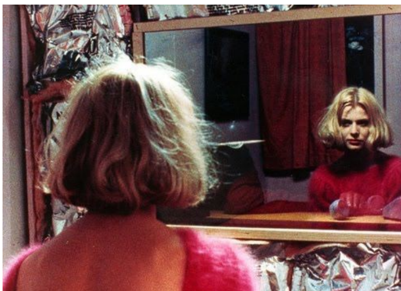
Jane et Travis, derrière la vitre, dans Paris, Texas (1984)

En effet, depuis le début, Marion pense comme si quelqu'un l'écoutait et comme si elle parlait à quelqu'un d'autre, comme si inconsciemment, elle se confiait à Daniel.