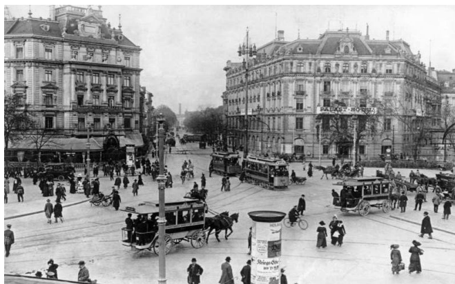
La Potsdamer Platz en 1920 (ci-dessus) et en 1961 (ci-dessous)

Grâce aux personnages des anges, et plus particulièrement celui d'Homère, Wenders parvient alors à mettre en place une sorte de passation de mémoire et de l'histoire de Berlin. De plus, à travers le personnage d'Homère, la frontière entre la fiction et le documentaire présente dans le film devient plus difficile à distinguer. En effet, comme l'exprime le réalisateur, de nombreux lieux présents dans le film n'existent plus désormais, faisant des Ailes du Désir une sorte de recueil d'images d'archives de la ville de Berlin à la fin des années 80, de la manière dont les gens vivaient et ce qu'ils voyaient. La Potsdamer Platz, déjà disparue lors du tournage, est ramenée à la vie grâce aux souvenirs du vieil homme contrastant avec le no man's land représenté à l'image. La question de la présence du documentaire au sein de la fiction est d'ailleurs abordée par François Niney dans son livre Le documentaire et ses faux-semblants 40 , où celui-ci explique qu'une fiction peut en effet faire l'objet d'une lecture « documentaristante » et agir comme un témoignage d'une certaine époque. Il considère également que n'importe quelle séquence filmée peut faire l'objet de document d'archive selon le sujet traité et la manière dont elle est utilisée.