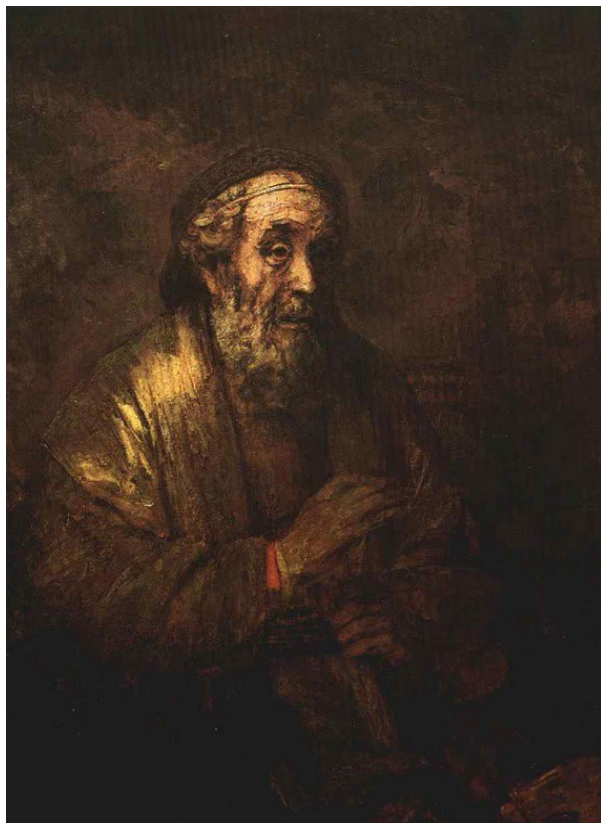
Homère, Rembrandt, 1663. Le tableau, endommagé dans un incendie, comprenait à l'origine deux disciples écoutant Homère sur la partie droite du tableau. Il se trouve actuellement au Mauritshuis à La Haye.

maintenant seul. [...] Moi, de mon côté, je ne savais pas comment intégrer Homère dans le scénario. Finalement, on s'est dit qu'Homère existerait dans cette bibliothèque et que les dialogues de Peter seraient sa voix intérieure. Curt Bois n'était ni ange ni homme, il était les deux à la fois puisqu'il a l'âge du cinéma. » 38 Bien que nous ayons déjà évoqué précédemment le personnage d'Homère dans « L'importance de l'enfance et de l'innocence » lorsque celui-ci observe un livre à la bibliothèque aux côtés de Cassiel, il est important de revenir sur sa première apparition durant les vingt premières minutes du film. Durant cette séquence, Damiel et Cassiel se retrouvent dans la Bibliothèque d'État de Berlin, quartier général des anges où ils observent et écoutent avec bienveillance les textes dont s'imprègnent hommes, femmes et enfants qui peuplent cette bibliothèque.