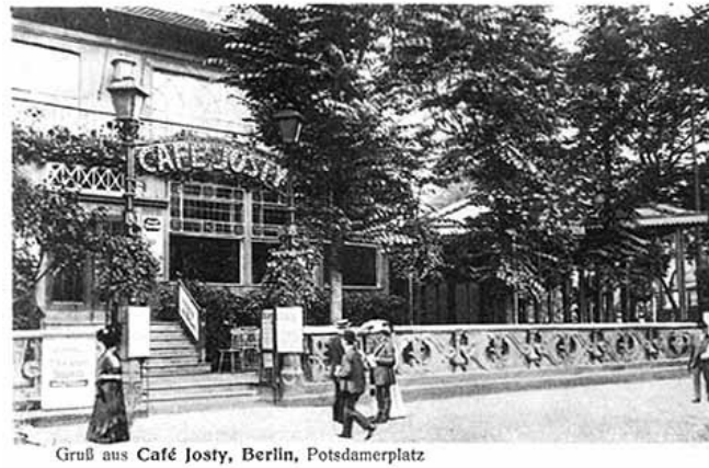
Grüß aus Café Josty, Berlin, Potsdamerplatz

Le Café Josty en 1910 (ci-dessus), le Café Josty en 1930 (ci-dessous)