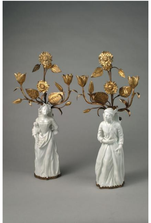
Figure 9 : Hotteur, Hotteuse (Manufacture de Chantilly), vers 1740-1745, porcelaine tendre émaillée, Cité de la céramique, Sèvres.

Le hotteur, ou porteur de hotte, désigne un vendangeur bien mieux rémunéré que ses collègues chargés de la coupe des raisins. Ces deux sculptures témoignent de cette activité laborieuse. Elles sont recouvertes d'un émail (Note 9) stannifère, caractéristique des débuts de la production à Chantilly. La statuette féminine, date d'avant 1741. Quant à la statuette masculine, elle est