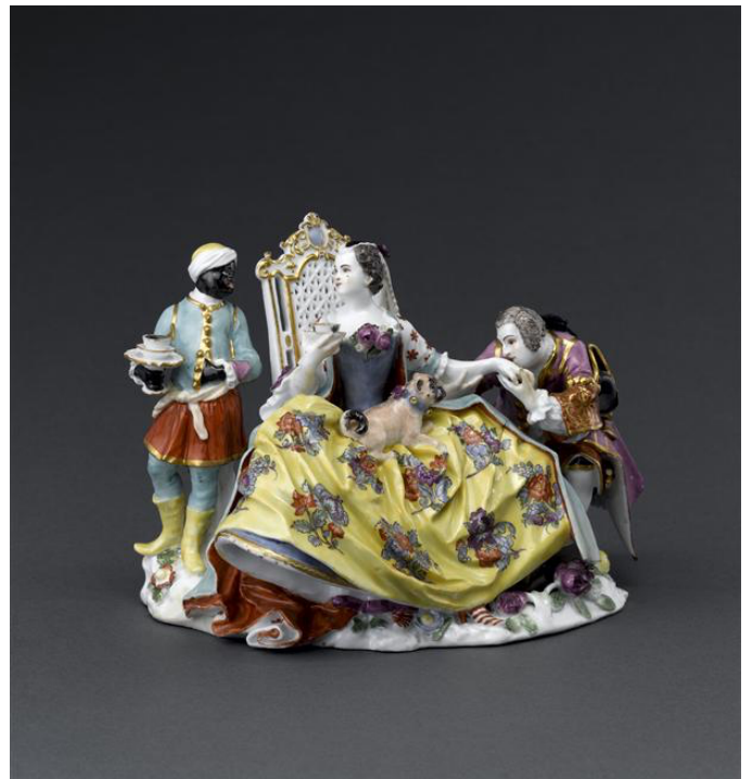
Figure 3 : Le Baise-main , Kändler J.-J. (Meissen), 1737, porcelaine dure polychrome, Musée du Louvre, Paris, Inv. OA6499.

Parmi ses couples galants, il créa aussi, en 1742, Le Clavecin (Fig.4), aussi connu sous le titre L'Épinette . Ce groupe sculpté représente une jeune fille, vêtue d'un costume moderne, au clavecin. Cette activité est interrompue par l'arrivée d'un homme qui l'enlace et la séduit. Malgré une prédominance du blanc : de la robe, du costume, des meubles etc, on remarque tout de même la présence de couleurs vives par touches, notamment sur les extrémités de la robe, les végétaux au sol et les rinceaux sculptés de l'ameublement.