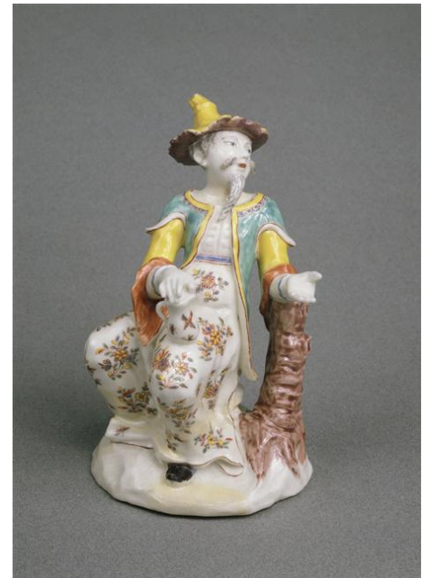
Figure 6 : Le Chinois (Manufacture de Saint-Cloud), 1720-1740, porcelaine tendre, Cité de la céramique, Sèvres.

Le modelé de cette sculpture est précis et détaillé, tout comme le décor en bouquets de fleurs et les oiseaux qui ornent le pichet ainsi que la partie inférieure du vêtement. L'attitude de la figure, combinée à la facture de l'objet, nous poussent à rattacher cette œuvre à la sculpture de genre ; il s'agirait éventuellement d'une scène domestique. On ne connaît pas la source d'inspiration de cette sculpture, qui pourrait hypothétiquement être une réalisation de