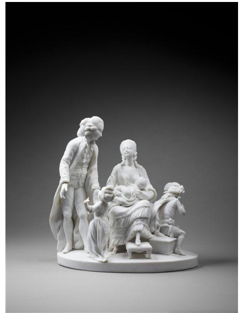
Figure 10 : La Famille (Manufacture de Locré), vers 1785, biscuit de porcelaine dure, Cité de la céramique, Sèvres.

Cette vogue pour les scènes de genre, les scènes galantes, s'est non seulement répandue par le biais des gravures françaises et étrangères mais aussi directement par celui des sculptures de Vincennes-Sèvres, qui étaient régulièrement offertes par Louis XV et ses favorites aux personnalités françaises et étrangères, et souvent copiées dès leur arrivée. On pense par exemple au biscuit de La Famille (Fig.10) exécuté à la manufacture de Locré, en France, qui partage des points communs avec le groupe de La Nourrice (1774-1799) (Cat.25) de Sèvres. Les cadeaux diplomatiques vont donc contribuer à la circulation des pièces, aussi bien en France qu'à l'étranger. La maîtrise technique, mais surtout la finesse et la délicatesse des pièces de Vincennes-Sèvres va inspirer le monde entier.