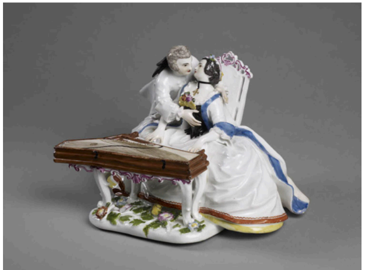
Figure 4 : Le Clavecin ou L'Épinette , Kändler J.-J. (Meissen), vers 1742, porcelaine dure polychrome, Musée du Louvre, Paris.