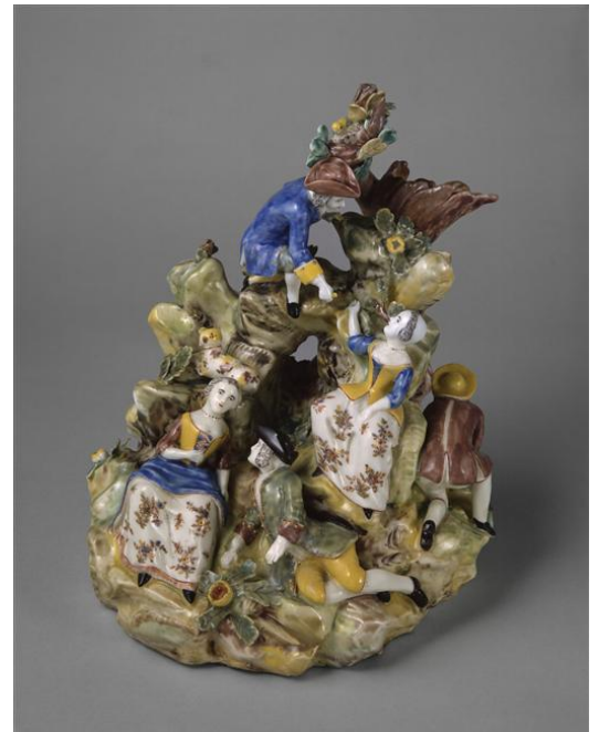
Figure 7 : Cinq personnages en train de discuter (Manufacture de Saint-Cloud), entre 1745 et 1750, porcelaine tendre polychrome, Cité de la céramique, Sèvres.

La deuxième sculpture s'intitule Cinq personnages en train de discuter , datée entre 1745 et 1750. Elle paraît assez ambitieuse pour l'époque : deux femmes et trois hommes occupent l'espace et les personnages sont organisés sur un élément en élévation, une sorte de rocher, une grotte avec un tronc d'arbre à l'arrière et de nombreux végétaux, notamment des fleurs. La polychromie de cet objet nous renseigne sur la nature des éléments : du vert/marron pour