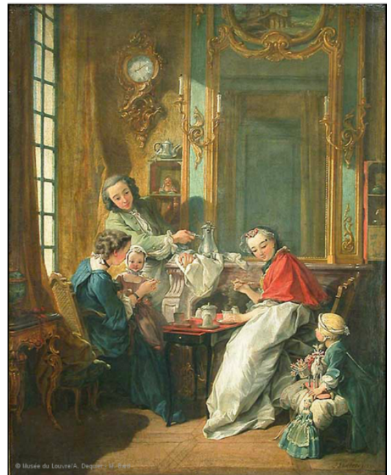
Figure 11 : Boucher F., Le Déjeuner , 1739, Huile sur toile, 81x65cm, Paris, Musée du Louvre.

En 1723, François Boucher remporte le premier prix de l'Académie de peinture qu'il intègre pour une durée de trois ans, à la suite desquels il part effectuer son voyage à Rome. Encore actuellement, le déroulement de ce séjour reste obscur, et l'on connaît relativement peu d'œuvres de cette période. À son retour d'Italie, à la fin de l'année 1731, François Boucher est agréé à l'Académie royale de peinture et de sculpture. Rapidement, il gagne en notoriété et les commandes affluent. Il peint à la cour de Louis XV et Madame de Pompadour lui confie d'importants travaux de décoration, notamment à Bellevue et à Crécy. Il est reçu dans le genre le plus prestigieux de la hiérarchie des genres, celui de la peinture d'histoire (Voir Part.1/1-2-b). Durant sa vie, il pratiqua tous les genres et toutes les techniques picturales, du dessin à la peinture, en passant par la gravure et les cartons de tapisserie. Il réalisa, majoritairement entre 1739 et 1746, de nombreuses peintures de genre, couples galants, scènes domestiques, rustiques, de la vie intime ou familiale. Il puisa son inspiration chez les maîtres hollandais du XVII ème siècle, mais aussi chez le Français Jean-François de Troy (1679-1752). Le Déjeuner (1739) (Fig.11), actuellement accroché parmi les collections permanentes du musée du Louvre, est certainement l'un de ses plus célèbres tableaux de genre.