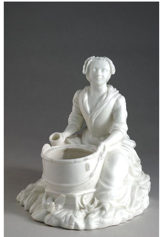
Figure 8 : La Laitière (Manufacture de Saint-Cloud), 1720-1740, porcelaine tendre émaillée, Cité de la céramique, Sèvres.

Une jeune femme assise sur un tertre, avec un seau à lait entre les cuisses, regarde devant elle, en direction du spectateur et sourit. Les manches retroussées, elle tient une mesure de sa main droite et le seau avec l'autre main. Ses cheveux tressés et coiffés encadrent son visage. Enfin, elle porte une longue robe, assez décolletée qui retombe en plis