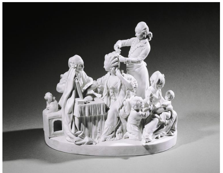
Figure 13 : La Toilette (Manufacture de Sèvres), Le Riche J.-F.-J., 1775, biscuit de porcelaine dure, Musée national des châteaux de Versailles et de Trianon, Versailles.

Elle est assise, le sein gauche dégagé et l'un de ses pieds est surélevé par un tabouret, ce qui lui permet de mieux maintenir l'enfant. La mère, et la servante à sa gauche, sont tournées en direction d'un jeune garçon agité, ce qui détourne l'attention du spectateur de la scène centrale. Ce garçon est accompagné de sa sœur, réfugiée derrière sa mère, à l'arrière de la sculpture. Les regards échangés sont tendres, attentifs et bienveillants. Contrairement à ce que nous avons pu voir pour les Cris de Paris , ici l'enfant est représenté à sa place. Cette scène, placée sous le signe de l'amour maternel, est particulièrement parlante, et on pourrait assez facilement l'imaginer prendre vie. Ce qui n'était pas le cas des sculptures d'après Boucher ou Falconet, bien plus distantes de la réalité. Tout de même, selon Anne Billon (BILLON A., 2001), on constate toujours une survivance de l'art de François Boucher dans la figure de la petite-sœur. Ce groupe rencontra un vif succès, il fut acheté à plusieurs reprises par les marchands merciers entre 1775 et 1781. Ce modèle fut probablement créé par Louis-Simon Boizot lui-même, puis Le Riche se chargea, en 1775, des pendants du Déjeuner (Cat.2) et de La Toilette (Fig.13).