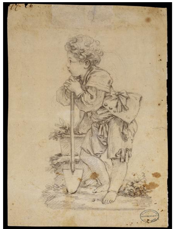
Figure 12 : Boucher F., Le Petit Jardinier, 1749, crayon et pierre noire sur papier blanc, 22x33,5cm, Inv. 2011.3.2066.

Dans la sculpture en biscuit intitulée Le Jeune Suppliant (Cat.6), cet Enfant Boucher est représenté le buste légèrement penché en avant, et les mains jointes dans une position de prière, ce qui coïncide avec le titre de l'œuvre, tandis que sur le dessin de François Boucher (Fig.12) qui a inspiré cette création,